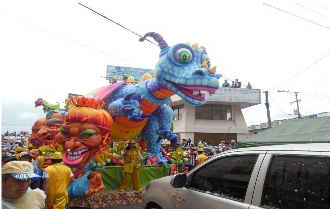
Figura 16. Carroza síganme los buenos con sus respectivos integrantes, desfile 6 de enero de 2015.

ALIMENTACIÓN: en lo que respecta a los gastos alimenticios, se toma en cuenta que estos se generan desde el comienzo del trabajo; con lo cual el maestro dice tener un gasto aproximado de $400.000; el gasto se incrementa especialmente durante los últimos 5 días ya que en el taller se aglomeran alrededor de 30 personas a las cuales se les da toda la alimentación. Sumado a lo anterior el día del desfile corre un gasto adicional el cual se sustenta en el refrigerio para los integrantes de la carroza el cual tiene un gasto de $3.000 por persona para un total de $90.000 si se tiene en cuenta que son aproximadamente 30 integrantes; gastos alimenticios que en definitiva suman un total de $490.000 respectivamente.