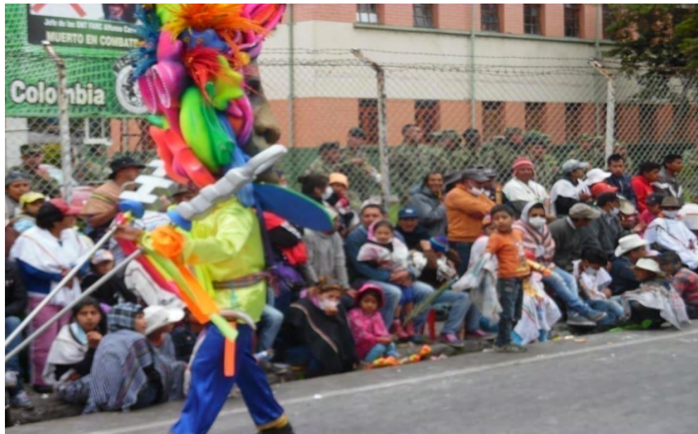
Figura 19. Colorido del disfraz de uno de los integrantes de la modalidad, desfile 6 de enero de 2015.