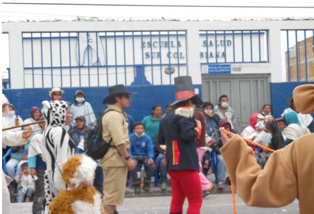
Figura 21. Representación de la comparsa teatro; utilización de la soga en el desfile del 6 de enero de 2015.

SOGAS: se utilizan para amarrar a las bestias que son hombres y mujeres disfrazados de ellas durante el desfile; y se requieren para ello 10 metros de este material, por un costo total de $10.000 pesos.