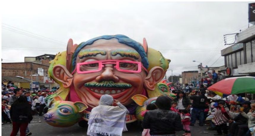
Figura 24. Concentración de propios y turistas por la senda del carnaval en el desfile del 6 de enero de 2015.