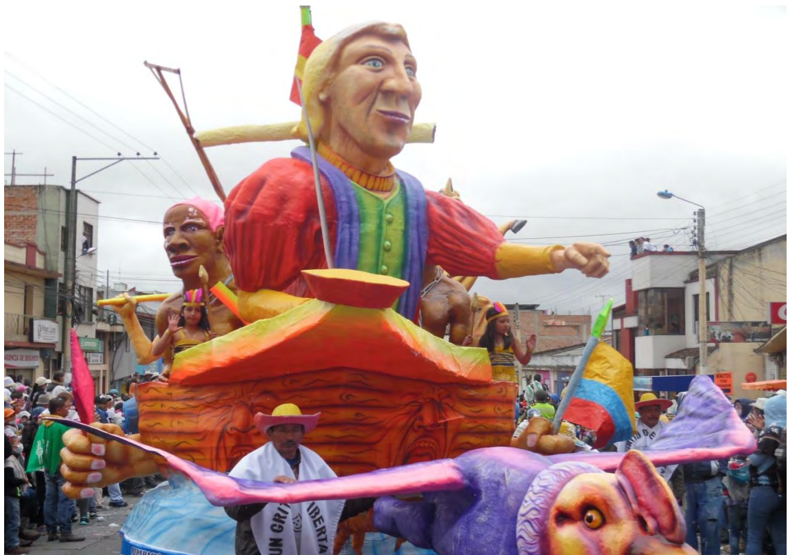
Figura 1. Carroza 6 de enero de 2015 “un grito de libertad”.

El Carnaval Multicolor de la Frontera del municipio de Ipiales al igual que la mayoría de carnavales del mundo, trasciende más allá de un simple acto festivo. Es la expresión histórica, un principio sociológico y desde luego cultural que se observa a flor de piel, en la que se conjugan la oralidad, la danza, la música, el arte dramático, la pintura, la escultura, la literatura, la imagen y un sinnúmero de expresiones propias de cada una de las culturas que se entremezclan como si fueran una sola; con un elemento típico que ha sido distintivo desde sus orígenes la “mascara”; así mismo le ha dado a la humanidad las bases del teatro al ser el escenario de picarescas representaciones que expresan el rechazo a una visión rígida y estática de corte aristocrático de la sociedad.