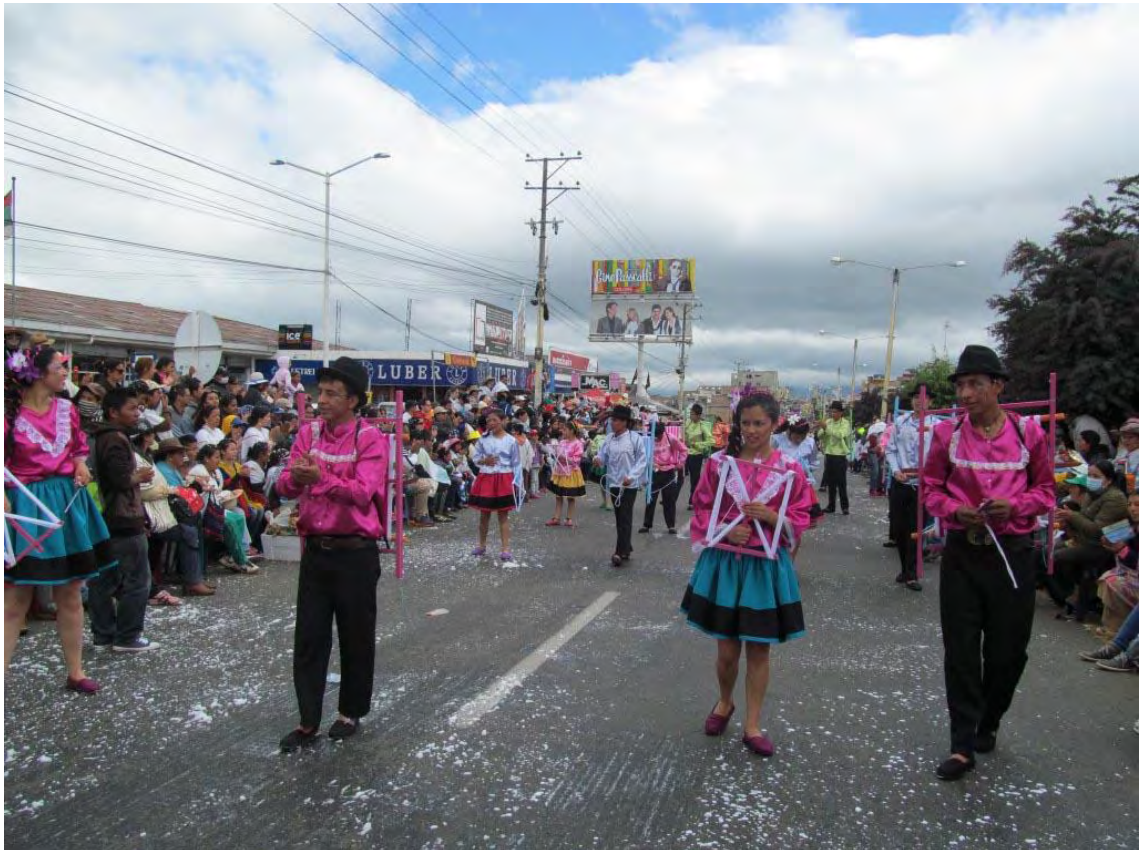
Figura 9. Comparza danza del corregimiento Jose Maria Hernandez, ganadora del primer lugar desfile multicolor del 3 de enero de 2015

Una vez finalizado el desfile todas las delegaciones se reúnen en el parque 20 de Julio para esperar el veredicto de los jurados y gozar de un momento ameno con la presentación de bandas y artistas que deleitan con su música a la gente.