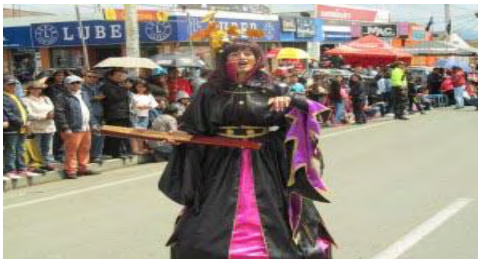
Figura 6. Viuda ganadora en el desfile del 31 de diciembre de 2014

Cada una de las representaciones artísticas que hacen parte del desfile con sus particularidades y sus mensajes; son inscritas con anterioridad ante el comité de eventos y festejos populares de la alcaldía de Ipiales; con el propósito de entrar a competir por el incentivo económico que se llevan los cinco primeros lugares de cada modalidad artística (viudas, año viejo tradicional y año viejo artístico); el puntaje depende de la creatividad y el grado de complejidad artística que el jurado calificador evidencie en cada representación. Culminado el desfile las calles se llenan con propios y extraños a la espera de la noche para despedir el año y esperar el próximo con una serie de tradiciones de la cultura popular.