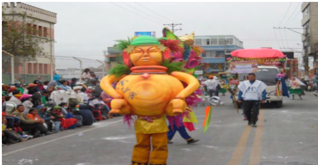
Figura 18. Representación disfraz por pareja de la artesana Elizabeth Ramírez, 6 de enero de 2015. Tema: el guaquero y el infiel.

modalidad va acompañada de atuendos fantásticos, exhibidos por dos personas que hacen conjunto armonioso y complementario, que rescata los valores, virtudes de personas o representaciones con una crítica constructiva sobre unas actitudes o hechos históricos de vital relevancia. En el disfraz por pareja se toma en cuenta que éste sea en un 90 % extensión del cuerpo y un 10 % podrá constituirse en ayuda materializada en la utilización de ruedas; así mismo tiene que ser una representación armoniosa, equilibrada, con buen manejo del espacio, buen manejo corporal y teatral; las técnicas utilizadas en su elaboración deben conservar lo tradicional con la creatividad del artesano(a).