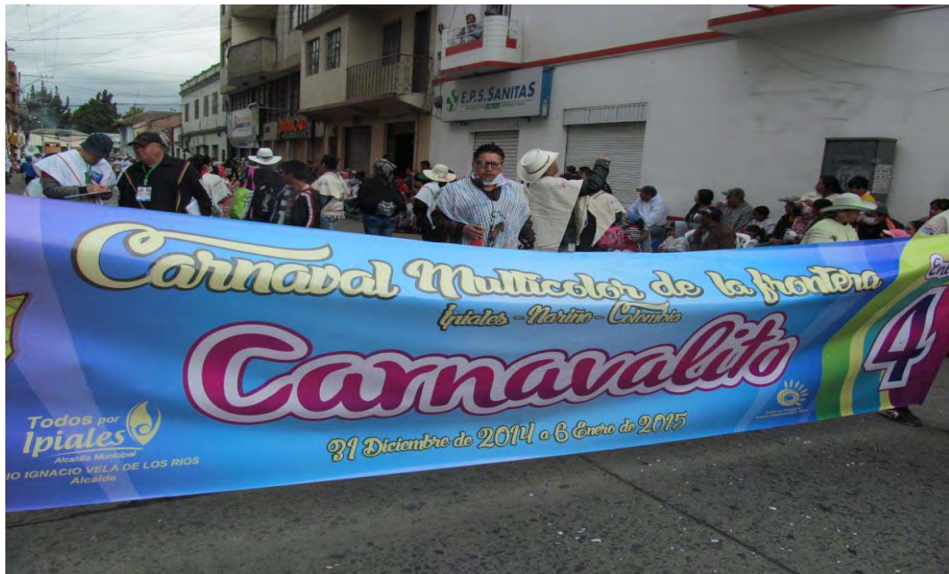
Figura 10. Desfile Carnavalito Por La Senda Del Carnaval, 4 De Enero De 2015