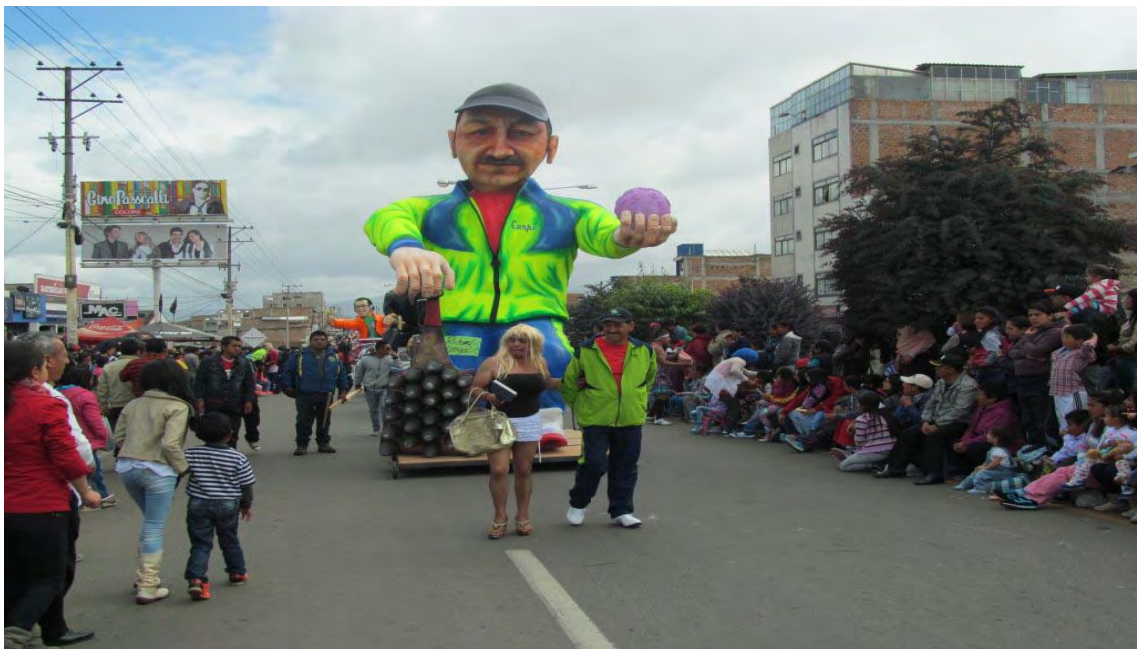
Figura 5. Año viejo acompañado de su respectiva viuda, 31 de diciembre de 2014

2.1.1 31 De diciembre “desfile de años viejos y viudas” .Se celebra el último día de cada año; su característica principal es la representación a través de monigotes de los principales eventos, hechos, acontecimientos o personajes públicos que se destacaron en el año que termina ya sea a nivel local, regional, nacional o internacional; los monigotes realizados artísticamente para deleite de la comunidad por parte de los artesanos participan en el desfile mediante dos modalidades: 1) Año Viejo Tradicional que es un muñeco realizado con técnicas tradicionales, estructura en madera, relleno con ropa y papel periódico con un mensaje alusivo a personajes o hechos públicos que sea fácilmente reconocido por la comunidad; 2) Año Viejo Artístico caracterizado por su estética y sincronía con el mensaje, los materiales empleados deben ser en su mayoría reciclables que no atenten al medio ambiente y la representación por lo general es de personajes públicos cuya popularidad se haya destacado ya sea positiva o negativamente durante el año que culmina.