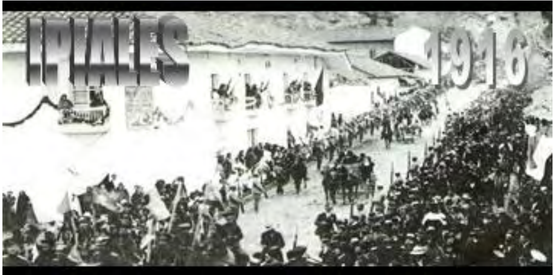
Figura 3. Primeros indicios del carnaval en Ipiales