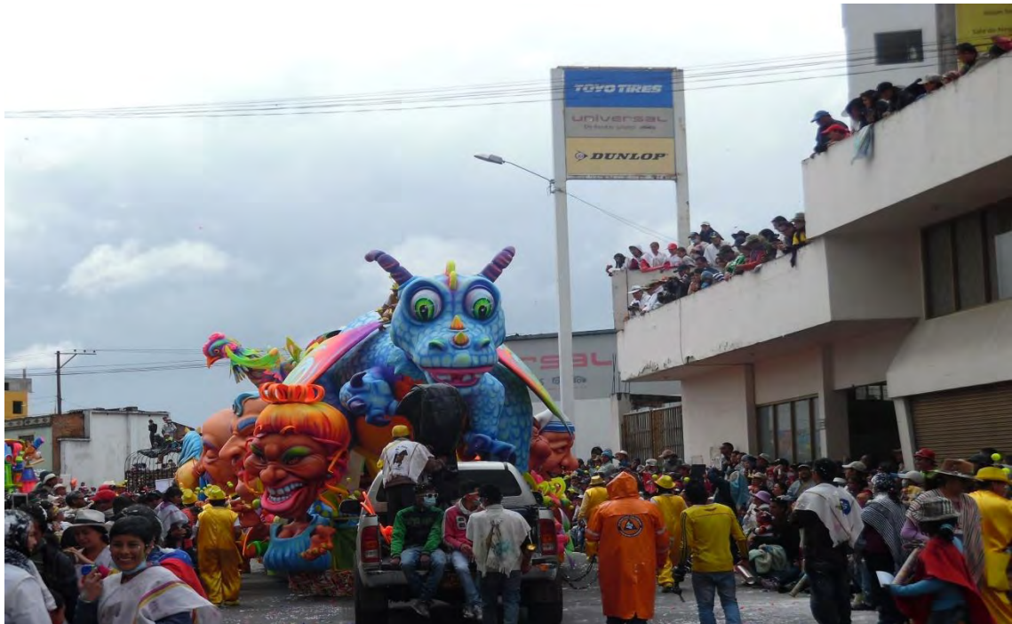
Figura 2. Ipialeños y turistas apreciando el arte e integrándose en el juego; carroza 6 de enero de 2015.

Así mismo el Carnaval además de constituirse en el escenario donde confluyen multiplicidad de expresiones ya sean culturales o artísticas que denotan un significado profundo para el pueblo, es el evento más importante que se celebra cada comienzo de año, con características de identidad, creatividad y salvaguardia autóctonas. A través de esta fiesta se identifican las creencias, resaltando los valores culturales locales y como la máxima expresión de cultura popular de Ipiales; evento dinamizador de la cultura, la economía y turismo de la región, que despierta el subconsciente colectivo. En su entorno aparecen simbolismos y se desprenden imaginarios colectivos que representan la razón de ser, sentir y actuar de la gente con una acción para cada día.