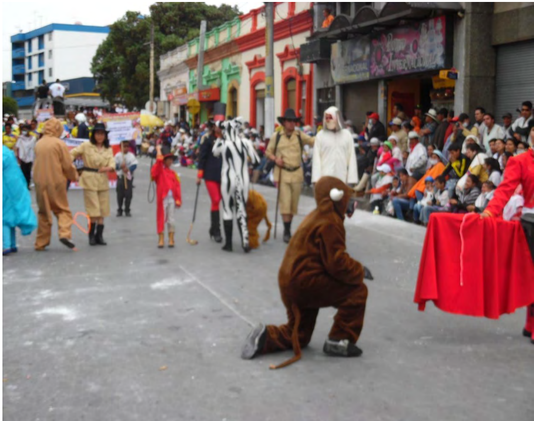
Figura 22. Escenificación de la comparsa teatro “bestiario”.

INVERSIÓN TOTAL DE LA MODALIDAD COMPARSA TEATRO: llevar a feliz término esta modalidad, hasta verla representada en el gran desfile, tiene un costo total de $1.607.000 pesos. Si en el gran desfile obtienen el primer lugar, tendrán un reconocimiento económico de $3.993.000 pesos.