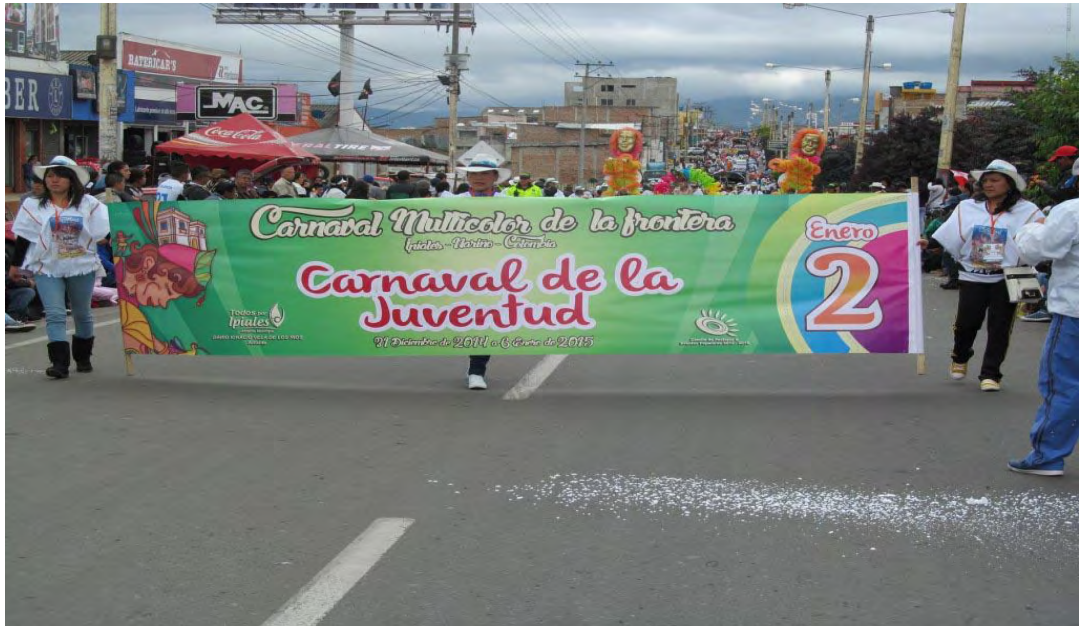
Figura 7. Desfile carnaval de la juventud, 2 de enero de 2015