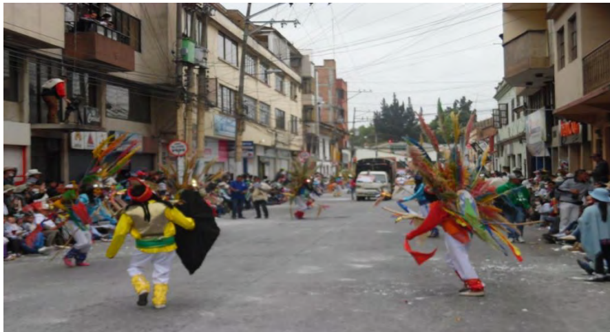
Figura 4. Danza indígena 6 de enero de 2015 “agrupación cultural innova danza del municipio de Ipiales”

Llevar a cabo la realización del carnaval es su forma acabada, es un trabajo que denota meses de ardua labor y un sinnúmero de personas que trabajan para que se haga posible, las cuales se reúnen al inicio del trabajo de forma periódica en la casa del maestro o artesano quien lidera el grupo, intensificándose al final, especialmente en los últimos días con el fin de terminar el trabajo a tiempo y brindar un espectáculo digno de ser apreciado a la comunidad en general. Así mismo en los días de carnaval, la calle es el escenario propicio que brinda información detallada del trabajo mancomunado tanto de organizadores como de artesanos, ya que en ella se escenifican y representan todas las modalidades participantes en el desfile que es el acto central de cada uno de los días de carnaval que desde tiempos atrás, en la génesis histórica del mismo conserva ciertas características que han trascendido en el tiempo y espacio; como es el caso de la burla, las máscaras, las carrozas, los bailes y las representaciones picarescas de personajes o situaciones concretas del tiempo coyuntural en que se desarrollan.