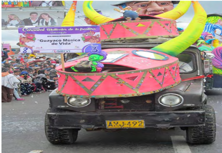
Figura 8. Carroza ganadora en el desfile del 3 de enero de 2015