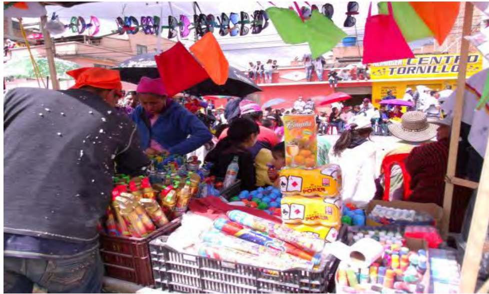
Figura 23. El comercio informal en el carnaval multicolor de la frontera.