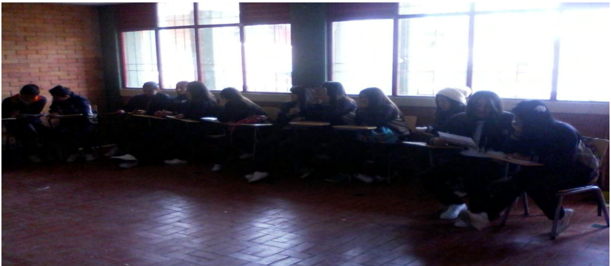
Figura 8. Grupo 1 del debate

El debate tenía como objetivo defender la opinión que se otorgue del tema con argumentos claros y coherentes, esta vez es necesario que sean los educandos quienes muestren la documentación sobre el tema y lo hagan notar con los argumentos que expresen, de esta manera se podrá evidenciar las mejoras obtenidas a partir de los ejercicios realizados anteriormente.