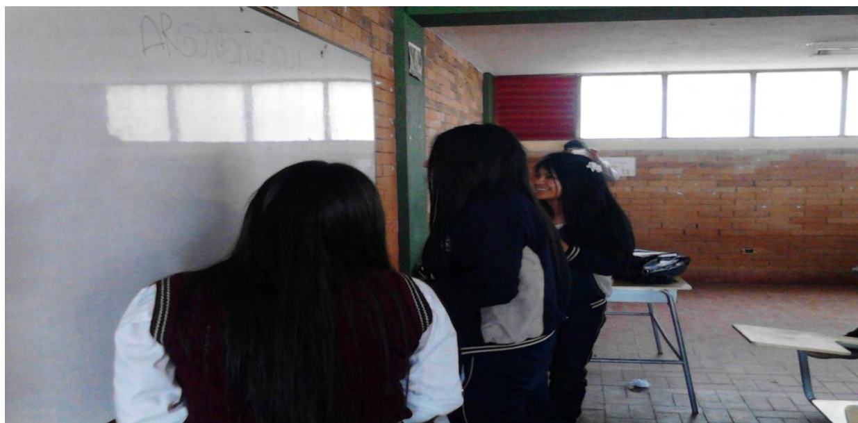
Figura 5. Exposiciones de alumnos

Es esencial implementar técnicas diferentes para hacer de la clase un lugar más activo, con mayor participación, donde la voz del educando tenga validez y pueda proponer didácticas diferentes a las usualmente trabajadas, como es el taller y la evaluación, además del tablero que es una herramienta que encierra a los alumnos a escribir, sólo alzan la cabeza para copiar lo redactado en el pizarrón, la innovación es primordial.