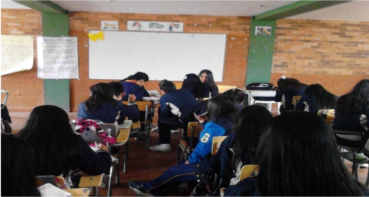
Figura 10. Taller final