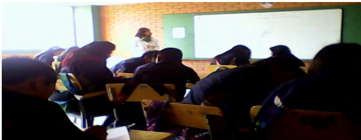
Figura 3. Rol del docente

En este sentido se observó que la participación es muy limitada en el aula y por ello el docente se siente inconforme. Si se retrocede en el tiempo observamos que el rol del docente ha padecido cambios, por ejemplo, antes era él quien poseía la información, pero las tecnologías de la comunicación y la información han permitido que todos los ciudadanos tengan acceso a ella, así mismo se procura que no haya transmisión de los conocimientos, sino construcción de estos, donde se presentan tareas relacionadas con la realidad de los estudiantes, anteriormente había una escasa relación docente-alumno, hoy se requiere que el docente sea un asesor y facilitador manteniendo un contacto permanente con ellos.