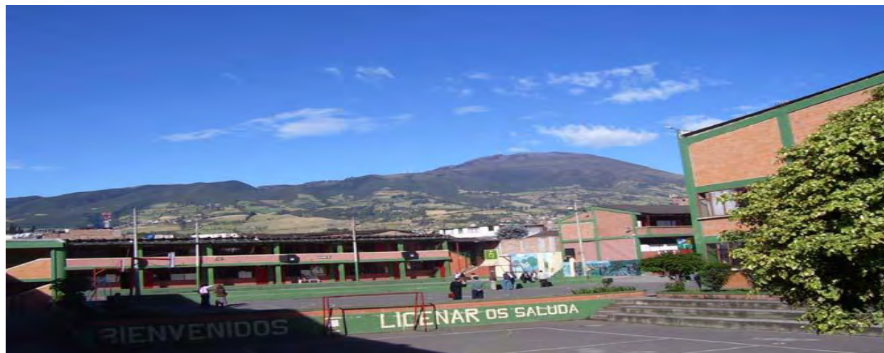
Figura 2. I.E.M Liceo Central de Nariño