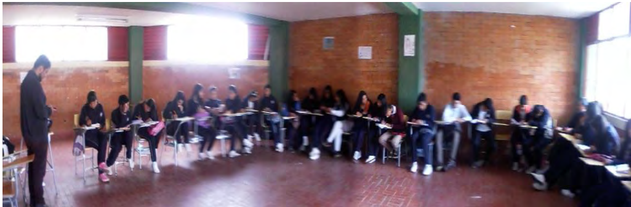
Figura 7. Mesa redonda