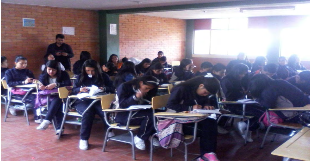
Figura 9. Preparación del foro

refutación, en términos generales fue aceptable, ya que a los estudiantes les falta estructurar mejor su argumento.