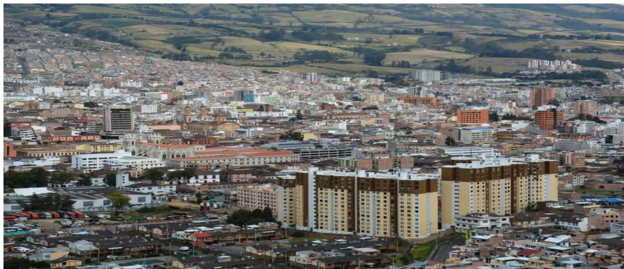
Figura 1. Municipio de Pasto, Nariño

Es adecuado percibir la contextualización del trabajo, ya que permite tener nociones del lugar y los momentos que se establecieron para realizar la investigación, que fue un proceso enriquecedor, siendo la ciudad de Pasto el macro contexto.