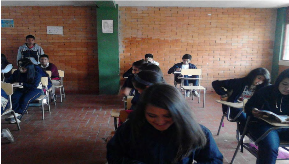
Figura 6. Taller inicial