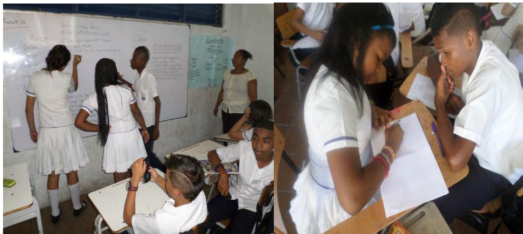
Figura 5. Construyendo sus primeros versos rimados