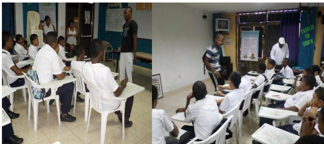
Figura 7. Expertos decimeros, explican construcción de décimas