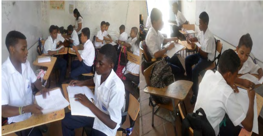
Figura 2. Trabajo en binas sobre oralidad