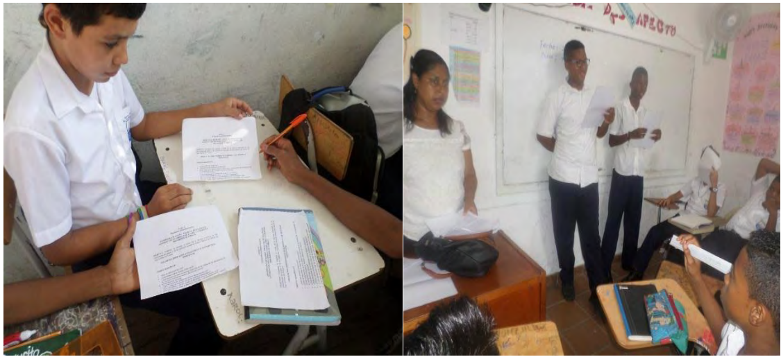
Figura 10. Compartiendo escritos con otro compañero