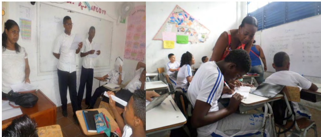
Figura 6. Construyendo y compartiendo con orgullo versos rimados