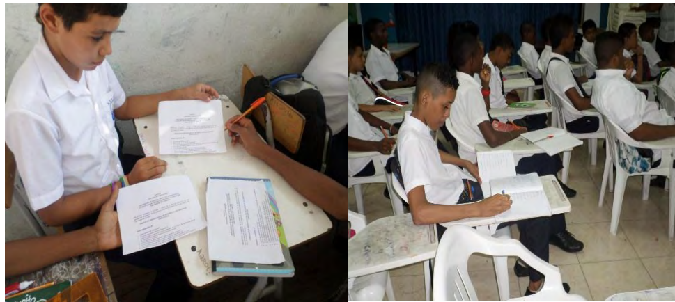
Figura 3. Iniciando sus producciones individuales

Dichas aclaraciones permitieron que cada estudiante, iniciara su proceso de producción individual, desde la narración escrita de los hechos más sobresalientes de su vida. (ver figura 3).