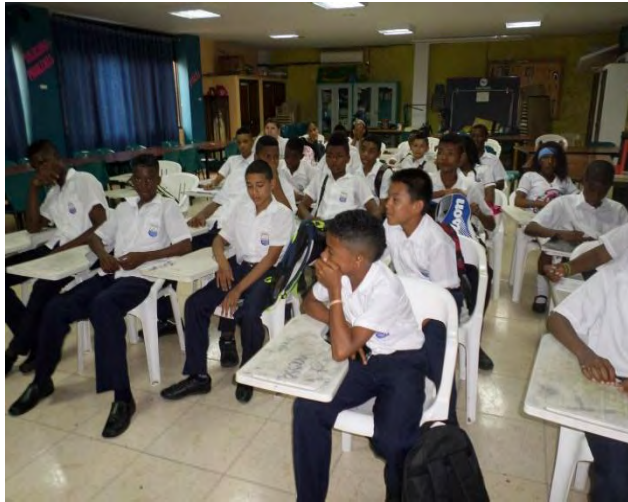
Figura 9. Apatía frente a la producción literaria

divino, a lo humano y de argumentos que narran la cotidianidad y vivencias de sus autores (ver anexo F).