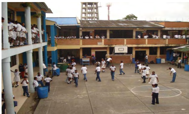
Figura 1. Planta física de la Institución Educativa Nuestra Señora de Fátima. Sede central