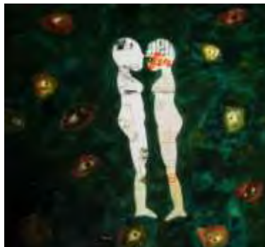
Figura 3. Letras, 2014

“Las máscaras que uso tan solo ocultan mis gestos, sin embargo mi mirada quiere salir volando. El día se torna naranja más mi vida esta gris, los colores se dilatan y terminan en un negro apocalíptico”