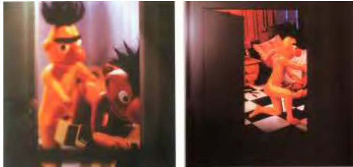
Figura 8. Bert topping to Ernie, 2005

Todos tienen un interés en común y es mostrar una emoción, y claro está conectarse de una u otra forma con el espectador y que este sienta que le transmite algo. El cambio tan drástico que se ha generado con el pasar de los años y la tecnología que poco a poco ya es parte de nuestra vida, ha logrado que el artista busque otros medios novedosos para generar arte.