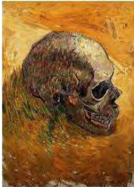
Figura 6. Calavera, 1887/1888

Por otro lado, tenemos un artista que trabaja desde lo íntimo. A simple vista el artista no es tan obvio a la hora de plasmar lo que piensa, todo lo contrario, cada obra está invadida de misterio y surgen preguntas como ¿Qué está pasando por la cabeza del artista?, algunas generan dudas, otras polémicas. La obra de Van Gogh se inicia con una pintura de tonos oscuros y profunda sensibilidad, como puede verse en su obra “Comiendo patatas”. Realizó numerosos paisajes e interiores, donde resalta la pincelada quebrada. Sus potentes pinceladas hacían que los objetos representados en ellas parecieran otorgados de movimiento, como si estuvieran animados por penetrantes emociones. Su paleta de pintor se fue llenando de colores vivos, y en ella mezcló el verde con el rojo, el azul con el naranja, el violeta con el amarillo. Su colorido tenía una poca relación con la realidad, pero eso que importaba, era su creación.