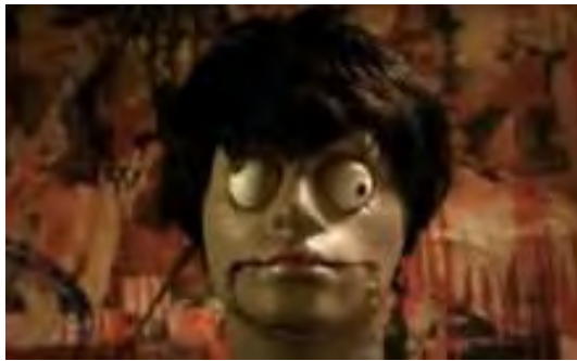
Figura 7. Minutos, 2008

Finalmente, el colombiano William Cruz y su obra “Bert topping to ernie” donde claramente muestra una serie de fotografías que revelan una intimidad entre dos personas, las expone una por una y hace que el espectador reflexione, estudie y vea lo que él quiere ver más allá del propio concepto del artista. Este nos induce a indagar sus restos y examinarlos dentro de nuestro contexto. Quiere que disfrutemos y nos enfrentemos a su propio ridículo, su propia historia y su cotidianidad queriendo como resultado que las miradas de los espectadores se crucen, se rocen, miradas e imágenes que recuerden qué hacer con el deseo convertido en mirada.