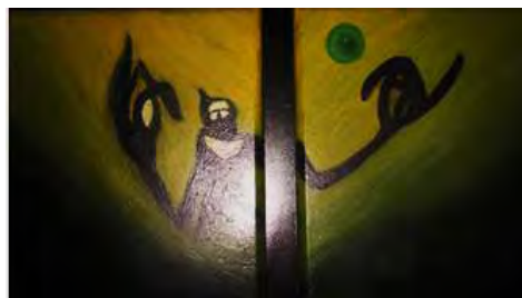
Figura 1. Absorción, 2013

“No soy tan valiente, pero tampoco tan frágil, ellas llegan pues a mi vida y la tornan un tanto compleja. Quisiera ser la niña que un día fui, tan radiante y alegre, libre de todo lo malo que la rodea y con su esencia única que cautiva los corazones”