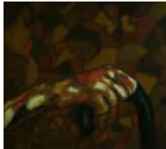
Figura 4. Abuelita, 2013

“Si, así es la vida. Siempre nos da una oportunidad.