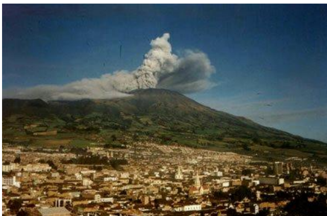
Fotografía 1. Panorámica San Juan de Pasto

La capital del Departamento de Nariño, San Juan de Pasto (Ver Fotografía 1), está ubicada al suroeste del país, en la altiplanicie de la Cordillera Andina a una altura de 2560 m sobre el nivel del mar. Además, la majestuosidad de la denominada “ciudad sorpresa” se conjuga con la imponente muestra de la naturaleza que se ve al levantar la mirada y apreciar al “león dormido”, a “Urcunina”, o como lo denominaron los españoles, el volcán Galeras (con actividad en la actualidad).