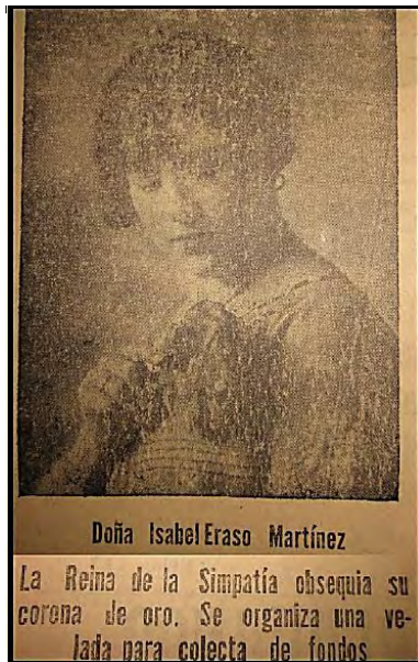
Ilustración 7: La señorita simpatía de 1932, da prueba de su amor patrio al entregar su corona al fondo para la defensa nacional.

Que sepa la Madre Colombia, que la vida espiritual y material de sus hijos, se moviliza toda para servirla.” 58