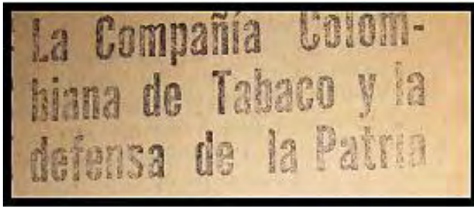
Ilustración 1: La industria comprometida con la defensa de la patria.