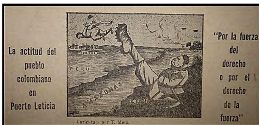
Ilustración 5: Bajo el lema “Por la fuerza del derecho o por el derecho de la fuerza”, esta caricatura muestra como la nación colombiana representada en el general Vásquez Cobo, debía expulsar a los peruanos de Leticia, estos últimos simbolizados en el presidente Sánchez Cerro.

A partir de los discursos anteriores, se genera una visión positiva de la actuación diplomática de Colombia, al declararla respetuosa y bondadosa. Mientras se describe negativamente la diplomacia del Perú, al referirse a ella como: traicionera e irrespetuosa del derecho internacional. Es importante atender este código binario, porque se constituye en el argumento central del autor para incentivar el sentimiento nacionalista en los pastusos y de esta forma que ellos defendieran su patria del enemigo peruano.