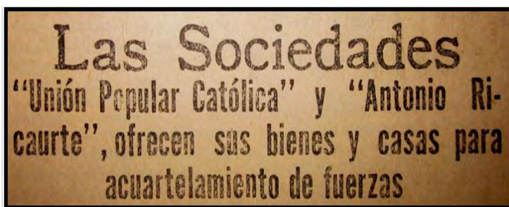
Ilustración3: La ciudadanía aportó económicamente a la guerra y se puso al servicio de la defensa nacional.

En este discurso el autor motiva a la ciudadanía a donar bajo las expresiones: “despojándose de sus joyas para acrecentar el arca nacional”, “todos los habitantes haciendo la dejación de sus bienes en beneficio del fondo destinado a la seguridad territorial”, “ejemplo ciudadano”, “la nobleza del sentimiento colombiano”, “Abandonan su ración para que ese producto vaya a robustecer el fondo de defensa nacional”.