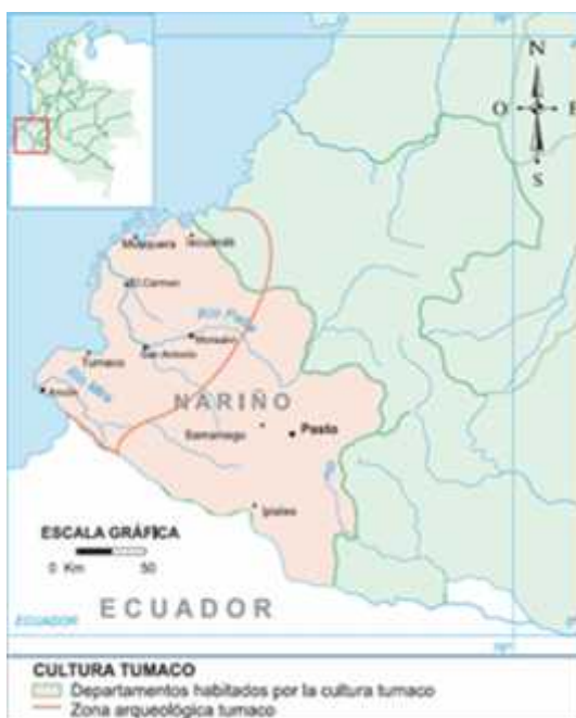
Figura 1. Ubicación del Municipio de Tumaco en el Departamento de Nariño.

“El municipio de Tumaco se ubica en la costa pacífica nariñense, a 280 kilómetros al suroccidente de la ciudad de San Juan de Pasto, capital del Departamento de Nariño; limita al norte con el municipio de Francisco Pizarro, al sur con la República del Ecuador, al este con los municipios de Roberto Payán y Barbacoas y al Oeste con el Océano Pacífico” 1