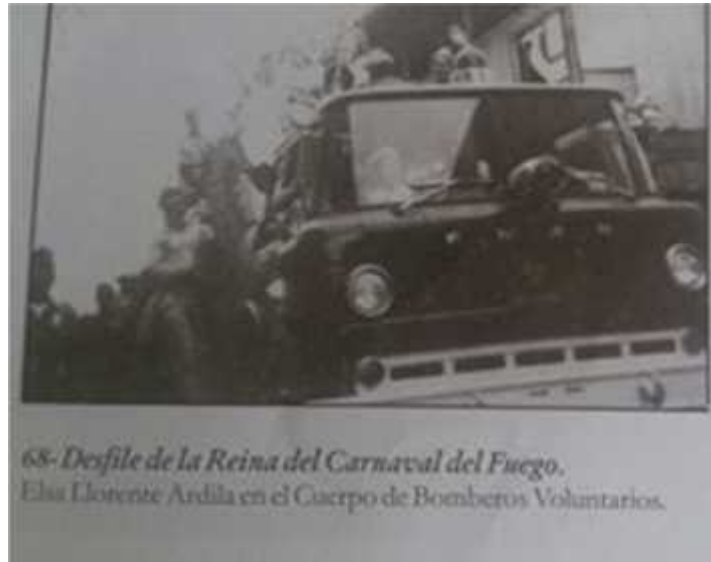
Figura 4. Antecedente Fotográfico