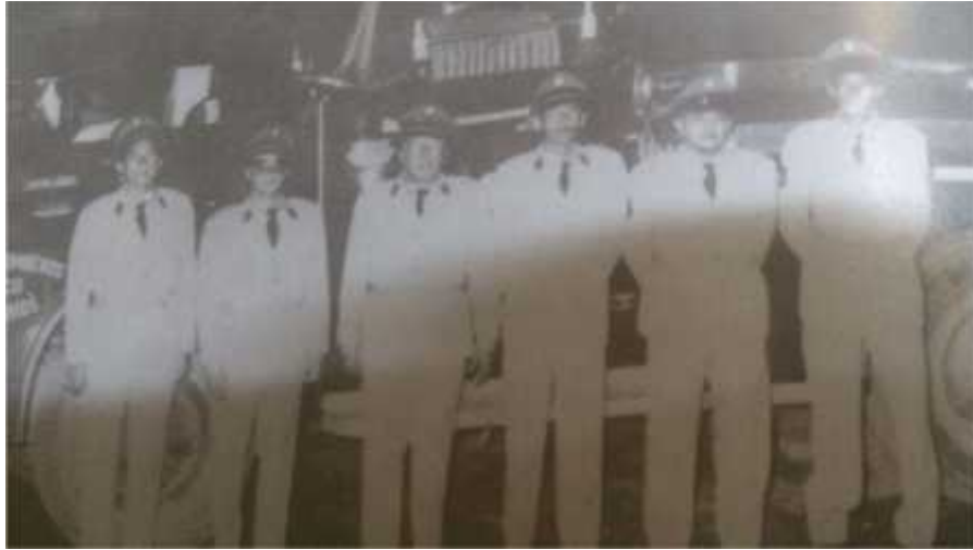
Figura 2. Antecedente Fotográfico

Fuente: GALLO, Martínez. Licenia. Tumaco ayer y hoy “por amor al arte”. San Andrés de Tumaco 2005.