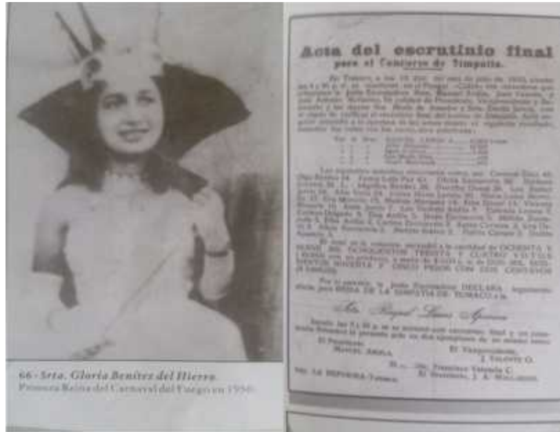
Fuente: GALLO, Martínez. Licenia. Tumaco ayer y hoy “por amor al arte”. San Andrés de Tumaco 2005

El reencuentro con el pasado genera firmeza a la identidad de la población Tumaqueña: