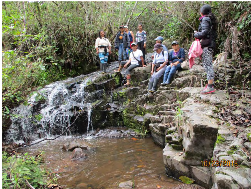
Figura 8. Grupo de mujeres campesinas limpiando sus fuentes de agua.

De esta manera, la Red de Mujeres Las Gaviotas, en el municipio de San Lorenzo, surgió para trabajar sobre el reconocimiento colectivo de las prácticas de discriminación de las cuales eran objeto y la falta de organización entre ellas (Vásquez, 2017), y a la fecha, son lideresas que se caracterizan por su fuerte compromiso con la comunidad y el territorio.