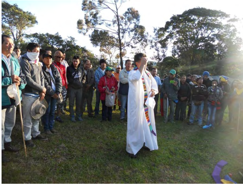
Figura 16. Mística de armonización espiritual en la microcuenca La Santana.