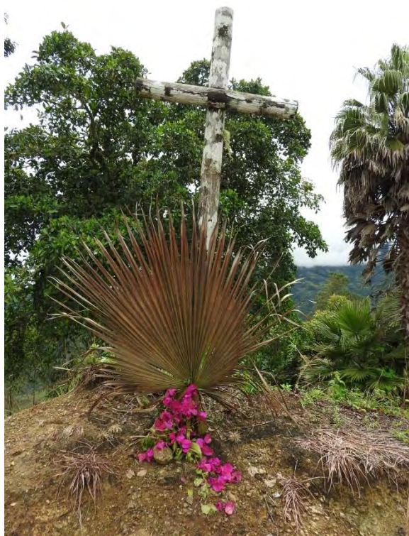
Figura 15. “Viacrucis ecológico” en San Lorenzo, Nariño.

Para los campesinos de San Lorenzo, una forma de resistencia, donde lo ambiental posibilita que la gente se organice para proteger el agua y el territorio, es a través de la pedagogía de lo que ellos llaman la “armonización del territorio”, que logran realizar con acciones y actividades de concientización y protección de las microcuencas. Estas prácticas de armonización conectan espiritualmente al ser humano con la naturaleza y a la naturaleza con el ser humano. Así lo da a entender Antonio Alvarado, al contar que: