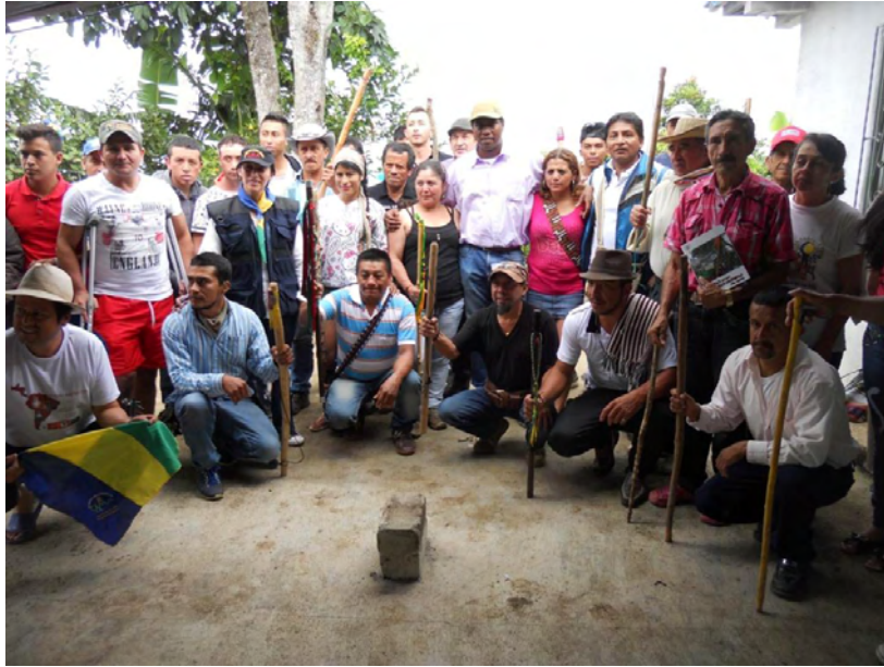
Figura 20. Constitución de la guardia campesina. Primer taller formal de guardia, 17 de marzo de 2016.

Con relación a la consulta popular, es una herramienta que el TCAM está procesando, como mecanismo jurídico en contra de la minería y en protección del agua. Este mecanismo demuestra la lucha organizada de los campesinos, con una madurez política que les permite saltar de lo social a lo comunitario, de lo comunitario a lo ambiental, de lo ambiental a lo jurídico, en función de la exigibilidad de los derechos fundamentales de los campesinos y de la humanidad, en general. Si bien la consulta popular se ha realizado en otras partes de Colombia, como un derecho constitucional, en el departamento de Nariño se implementará por primera vez en el municipio de San Lorenzo el 17 de diciembre de 2017, después de que la propuesta de los campesinos evacuara y cumpliera todos los protocolos jurídicos. La consulta popular, según explica Patricia Guzmán: