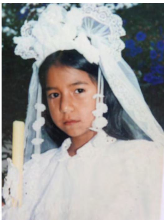
Figura 32. Niña enduendada, vereda Santa Cecilia.

Por aquí arriba (señala hacia la montaña) es el tanque del acueducto y por ahí para arriba es montaña, es bosque y por allá arriba dicen que está, por ahí se lleva, y como son varios duendes, duende y duenda, pues la duenda se enamora de los niños y el duende de las niñas.