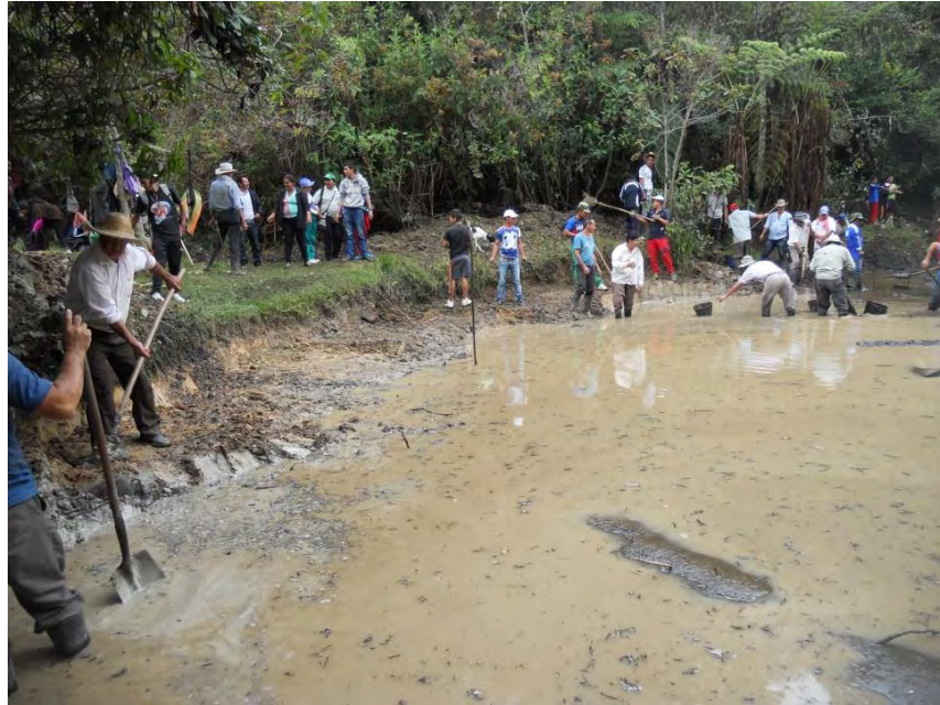
Figura 14. Pago en la laguna La Marucha, San Lorenzo, Nariño.

Por otra parte, el pago está relacionado con las actividades de agradecimiento a los sitios sagrados del agua y de la Madre Naturaleza por los favores recibidos, como el agua, el aire, el fuego, la tierra y los alimentos y a su vez pedirle perdón por los daños ambientales ocasionados por el mismo hombre, asumiendo, al mismo tiempo, el compromiso de cuidar, proteger ese territorio, como lo hizo la comunidad en tres oportunidades de forma masiva, en los últimos dos años, visitando las chorreras de La Santana, la quebrada El molino y laguna La Marucha; allí la gente hizo caravana de mojoneo y pago.