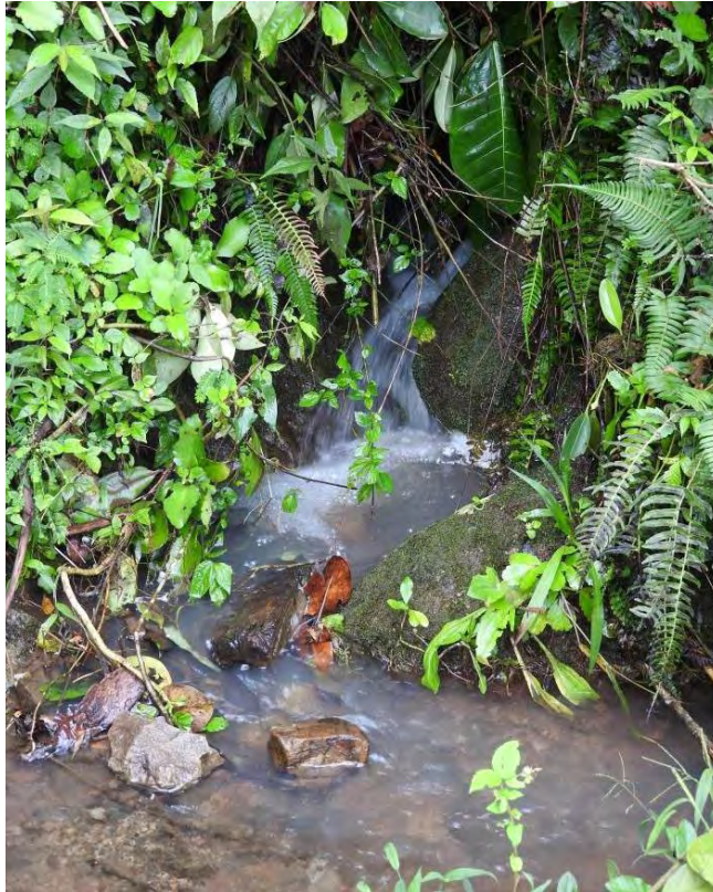
Figura 30. Lavadero comunitario, vereda Santa Cruz.

Los mayores comentan que el ángel de la guarda limpia el agua cada tres metros, y uno no le encontraba explicación a eso, a ratos se imaginaba que debía de haber un ángel pues escogiendo las impurezas del agua, pero en vista de lo natural, uno se da cuenta estos filtros que se hacen con las crecientes de agua y se hacen como unos filtros y se llenan de arena y la que filtra abajo, ya pasa más limpia, entonces ese es el fenómeno de la explicación del ángel de la guarda está limpiando el agua cada tres metros, para que los abajo la puedan consumir, y eso es algo natural por medio de los filtros, las piedras, las arenas y todo eso.