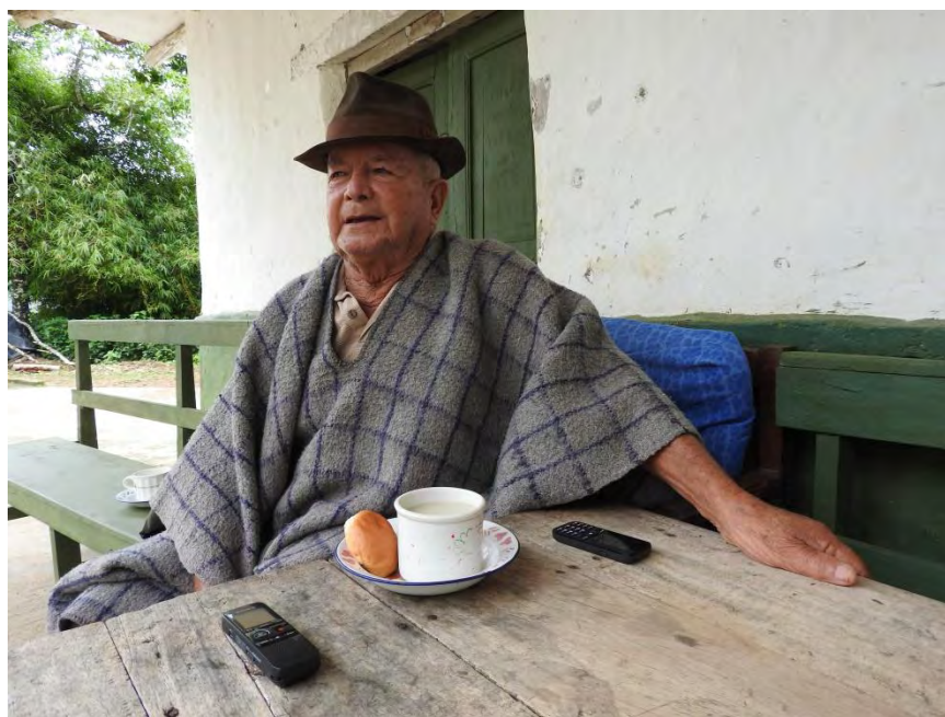
Figura 43. Momentos alusivos a la narración del relato.

Resulta que por ahí había un señor, un menor de mí, ha de haber sido de por acá, a ver sido, y él decía que lo tenía cogido en la cuenta, el duende, que dormía por allá en el monte, entonces decía que por allá había una chorrera en donde por allá permanecía y cierto una vez, yo me fui a bañar por ahí, y no me acuerdo bien cómo fue, yo venía de Taminango y me provocó de irme a bañar por ahí abajo, cuando yo me estaba bañando se rodó una piedra grandota y calas al agua, y yo no puedo decir quién fue o qué se fue de gusto, pero fue ahí donde decían, ahí en la chorrera, pero no sé si puedo decir si fue una ilusión mala o algo así.