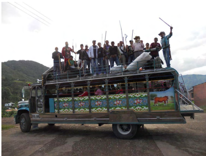
Figura 21. La lucha organizada en contra las transnacionales mineras es también en favor del cuidado del agua.

Según Scott (2002, p. 4) “...las personas de las que se tiene que temer más son los jóvenes subordinados que respetan, creen y defienden al sistema”, de ahí que es muy valiosa la posibilidad de que los relatos del agua recopilados, se conviertan en una herramienta más para formar y sensibilizar a niños y jóvenes, hacia la protección del agua y del territorio, escuchando las voces de enseñanza y experiencia de sus mayores. Si logramos este propósito, podemos decir que valió la pena recorrer, paso a paso las veredas de San Lorenzo, ayudando a tejer la palabra de sus líderes y mayores alrededor de la memoria del agua.