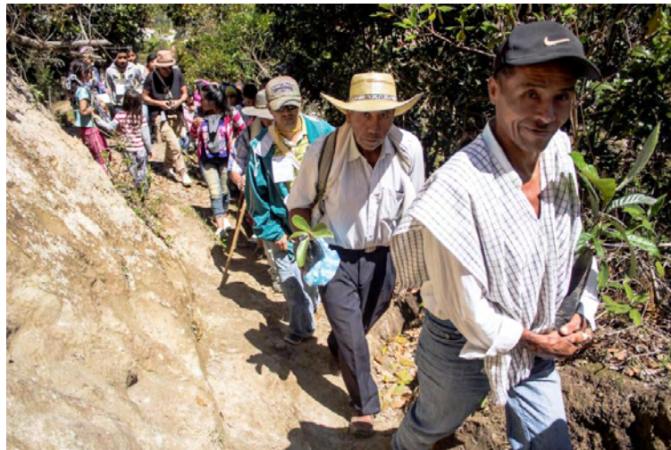
Figura 18. Comunidad ambiental de San Lorenzo, practicando la ecología profunda.

“Primero que todo nosotros somos ambientales, no somos ambientalistas, somos profundamente ambientales... el ambientalista es como más teórico y más académico, más institucional y el ambiental es más comprometido, más práctico, más cuidadoso, más protector y más comprometido con el entorno natural.” (A. Alvarado, comunicación personal, 4 de agosto de 2017).