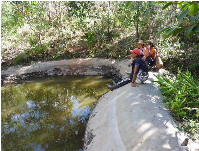
Figura 11. Reservorio de agua, vereda Valparaiso, San Lorenzo.

“Los reservorios se hicieron en unos tanques gigantes, en cemento y barro y entonces el uno tiene como 15.000 litros y el otro como 6.000... para todas las actividades, esos reservorios se hicieron para arriba en la parte del bosque, y dónde llega el agua más abajo en la bocatoma, la idea es que toda el agua que se recoja se vaya filtrando mediante el proceso de filtración para la gente, para el consumo;” (J. I. Fernández, comunicación personal 25 de marzo de 2017).