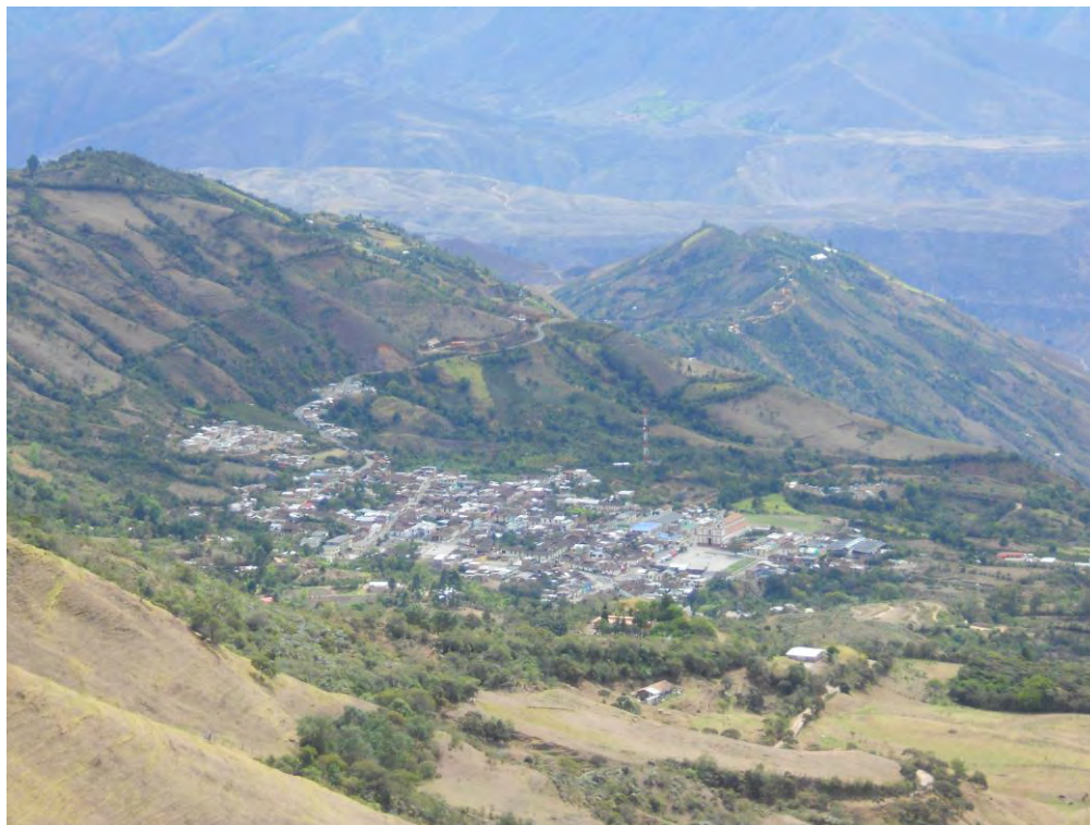
Figura 1. Panorámica de San Lorenzo, Nariño.