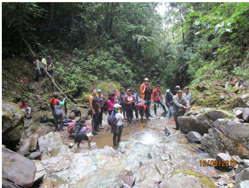
Figura 10. Realización del mojoneo y pago en la microcuenca La Santana, San Lorenzo.