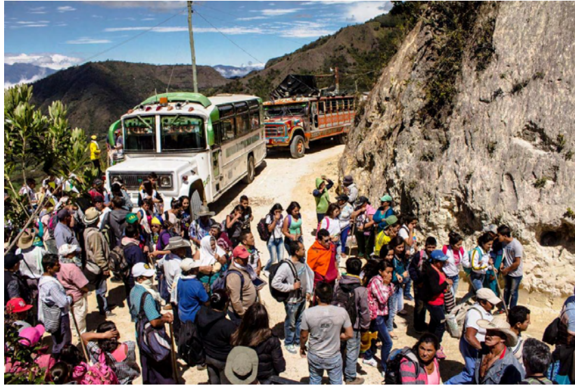
Figura 12. Caravana de mojoneo y pago entrando por El Mirador, San Lorenzo.

El mojoneo, según explica Patricia Guzmán, (comunicación personal, 2 de septiembre de 2017) es realizar una delimitación de los territorios y señalar lo que es de ellos, donde no debe entrar nadie sin permiso, sobre todo en las quebradas, en los cerros más importantes y donde plantan unas banderas para dejar el mensaje de que ese territorio la gente lo está protegiendo. En los mojoneos los campesinos invitan a niños, jóvenes y adultos y hacen jornadas de recreación para conectarse con los buenos espíritus de la naturaleza.