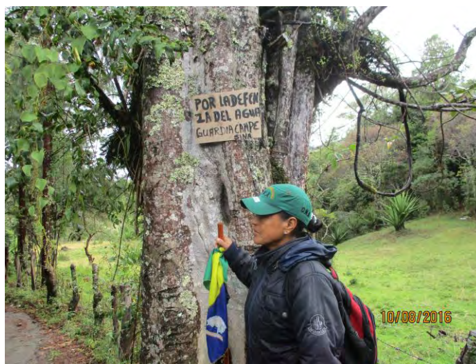
Figura 7. Líder campesina CIMA participando en actividades de mojoneo.

Estas mujeres empezaron a asociarse entre ellas, alrededor de las necesidades de sus hogares y la falta de reconocimiento de su trabajo; luego, poco a poco buscaron la manera de capacitarse, integrando un pequeño grupo que se fue nutriendo y, en el 2004, aproximadamente, se creó formalmente con personería jurídica la Red de Mujeres Loreenseñas Las Gaviotas, de manera que empezaron a trabajar y empezaron a ser reconocidas por la construcción de sus escuelas agroambientales. Así también lo reconoce Vázquez (2017):