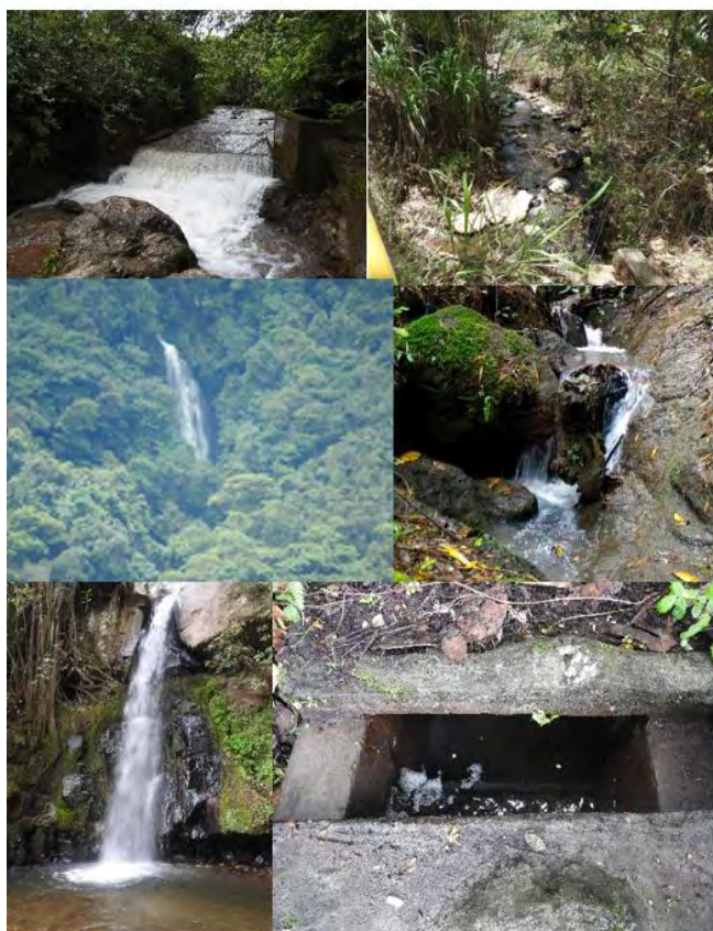
Figura 4. Algunas fuentes de agua del municipio de San Lorenzo.

Un dato interesante es que las referencias más antiguas que el municipio posee son los petroglifos, uno de ellos, el que se encuentra ubicado en el Colegio Sagrado Corazón de Jesús, que según los hallazgos de uno de los estudios realizado por Granda (2010), tiene una altura de 7 m por 17 m de largo, está conformado por figuras circulares con rayos, espirales, líneas y representaciones antropozoomorfas; otro de ellos, se encuentra en la vereda La Cañada, de dimensiones más pequeñas, 1.4 m de alto por 2.3 m de largo, conformado por espirales, rectángulos y monos; de igual forma, Granda registra otros tres petroglifos, ubicados en el sector de Saranconcho, en límites con Buesaco. Sobre ellos se conoce que guardan mucha similitud con los encontrados en el norte y centro de Nariño, pertenecientes a la cultura Quillacinga, quienes ocuparon gran parte del territorio nariñense.