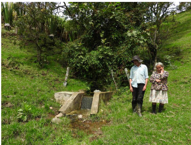
Figura 24. Nacimiento de agua - Isidro Fernández.

Bueno más antes yo he escuchado, en la Viyorga era un monte que le habían puesto porque los abuelos conversaban que ahí la sentían llorar y gritar. Era un espíritu y entonces lo habíamos dejado por el hueco de la Viyorga. Yo la escuché cuando uno salía de abajo que tenía que ir a trabajar y de aquí allá arriba había que caminar tres horas, entonces uno se iba aquí a las tres de la mañana y de allá para venirse el día mismo tocaba venirse a las tres de la tarde y entonces, a veces a uno le cogía la noche y llegaba, pues, porque tocaba en