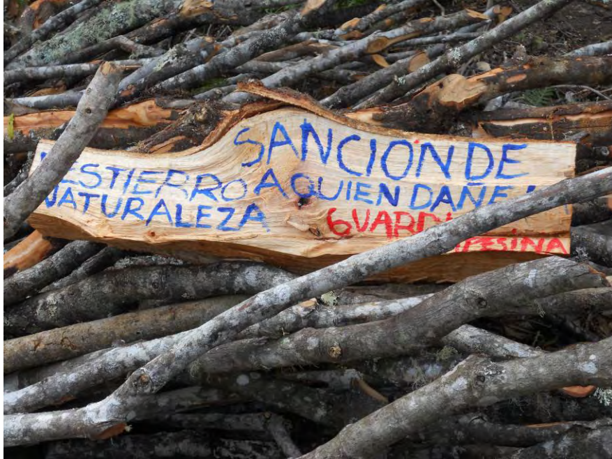
Figura 9. Mensajes que ubica la guardia campesina en el territorio para protegerlo y crear conciencia.