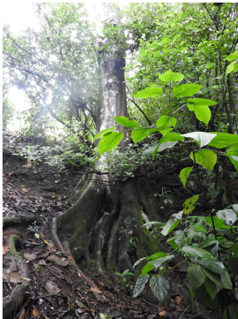
Figura 27. Nacimiento de agua – árbol de higuierón.

estudiantes, todo, tienen ahí los trapitos que usan para limpiar los zapatos y salir para allá, mírelos ahí están. Y los animales, cuando ellos pasan aquí, es como si ellos detectan el sabor del agua, porque uno los apega a que tomen agua, y ellos huelen aquí, huelen aquí y terminan tomando allá, al pie del chorro.