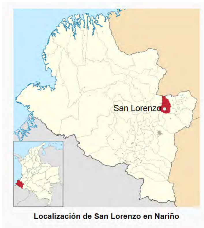
Figura 2. Mapa de ubicación municipal de San Lorenzo.

Este municipio de Nariño está constituido por nueve corregimientos: El Carmen, Especial, Salinas, San Gerardo, San Lorenzo, San Rafael, Santa Cecilia, Santacruz y Santa Martha; además, una serie de secciones o veredas alimentan este paisaje, entre ellas se puede nombrar: El Arenal, Bellavista, La Estancia, etc. Este territorio se encuentra en medio de altas montañas, estrechos, valles, cañadas, extensas faldas y pequeñas mesetas, lo cual hace que el suelo sea apto para el pastoreo, cosecha de una gran variedad de productos y para la conservación de la vegetación natural, la cual es fundamental para la protección de las cuencas hidrográficas (Ojeda, 1990).