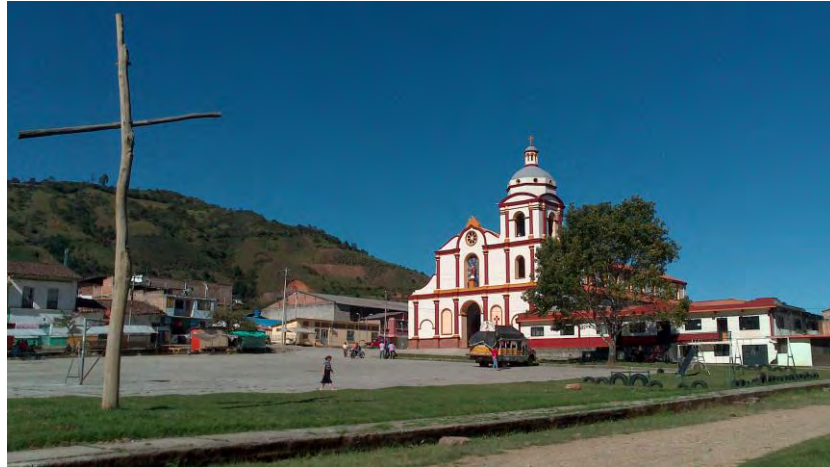
Figura 6. Iglesia y parque central del municipio de San Lorenzo.