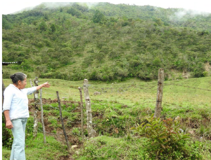
Figura 31. Potero que conduce a la montaña donde se desarrolló el suceso.

Ella era pequeñita, entonces las más grandes la llevaron a jugar al potrero, acá atrás, y en esas ya llegaron, me trajeron la niña, ella empezó a mirar para lo alto y a reírse y a reírse... y cuando ella dejó de reírse se desmayó; yo mandé a traer a una señora que tiene experiencia en eso, y ella vino y me le hizo unos sahumeros y entonces se me le quitó eso, después de eso, ya unos días estuvo tranquila, y después ya nos fuimos por allá arriba a cortar leña, y entonces dijo ella; mamá ese hombre me va a coger y se me cayó, se me desmayó vuelta, entonces, yo cogí unas ramas de poleo y sobé y le puse en la cara, entonces medio me le pasó y me la descargué y me la traje a la espalada, y bien acá al filo, me dijo: ya me pasó mamá, yo camino y ya la cargué y la eché por delante y nos vinimos; y cuando ya bien por la tarde, ya empezó otra vez, que se ha entristecerse y ya no quería nada, y por ahí a las seis y media ya que teníamos que aprontarle un olla de agua hervida porque la sed la mataba, entonces nosotros le preguntábamos que qué veía, que ella veía un niño decía que le cantaba, que le tocaba música, y ella hacía los amagos como a bailar, miraba para alto, allá está, decía.