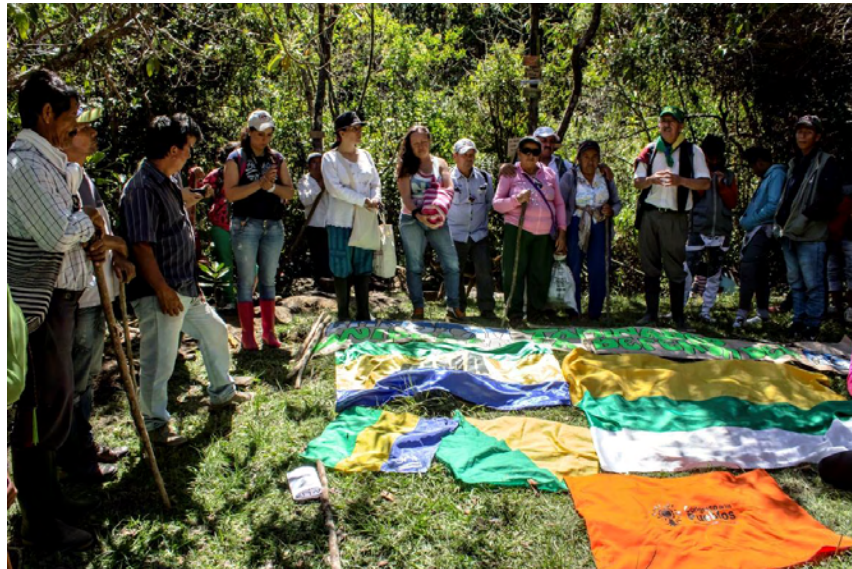
Figura 13. Delimitación de los territorios con banderas de procesos organizativos en San Lorenzo.

El mojoneo, según explica Patricia Guzmán, (comunicación personal, 2 de septiembre de 2017) es realizar una delimitación de los territorios y señalar lo que es de ellos, donde no debe entrar nadie sin permiso, sobre todo en las quebradas, en los cerros más importantes y donde plantan unas banderas para dejar el mensaje de que ese territorio la gente lo está protegiendo. En los mojoneos los campesinos invitan a niños, jóvenes y adultos y hacen jornadas de recreación para conectarse con los buenos espíritus de la naturaleza.