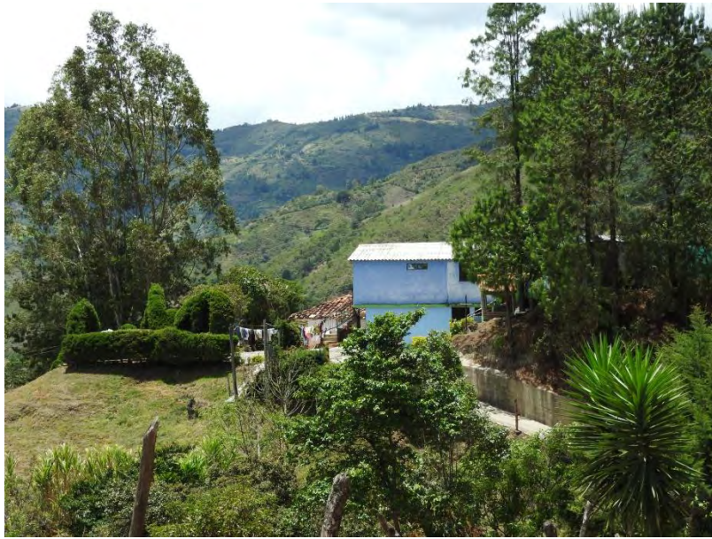
Figura 19. Lugar donde estuvo ubicado el campamento de exploración minera de la empresa Gran Colombia Gold en Nariño - 2010.