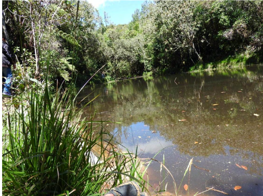
Figura 22. Laguna La Marucha, municipio de San Lorenzo.