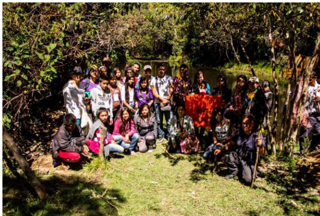
Figura 17. Los niños recorriendo los sitios por donde nace el agua en San Lorenzo.

“... con los niños, el año pasado (2016) el 12 de mayo, estuvimos en la parte alta de San Lorenzo donde se trae el acueducto para Santacruz, entonces ahí se fue a conocer y a mirar el deterioro ambiental que están haciendo y los niños analizaban esa parte, y se sensibilizan más, porque ellos todavía piensan que es abrir la llave y que el agua está ahí, ya después de ver, caminado dos horas, entonces ellos ya empiezan a valorar, todo el trabajo que los adultos hemos hecho para traer esa agua desde allá, entonces ahora, en vista de que el hombre en la ambición de producción, de la parte económica, toda esa zona de allá la volvieron zona de potrero, y entonces allá, el lugar donde nace el agua, que es la bocatoma que surte a la comunidad, ya está sin bosque, entonces ese día, se sembraron algunos árboles y eso es como la forma de ir sensibilizando.” (A. Ortis, comunicación personal, 4 de agosto de 2017).