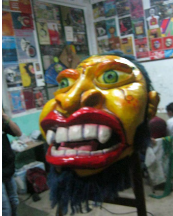
Figura 23. Realización de mascara, escala 1,20 cm