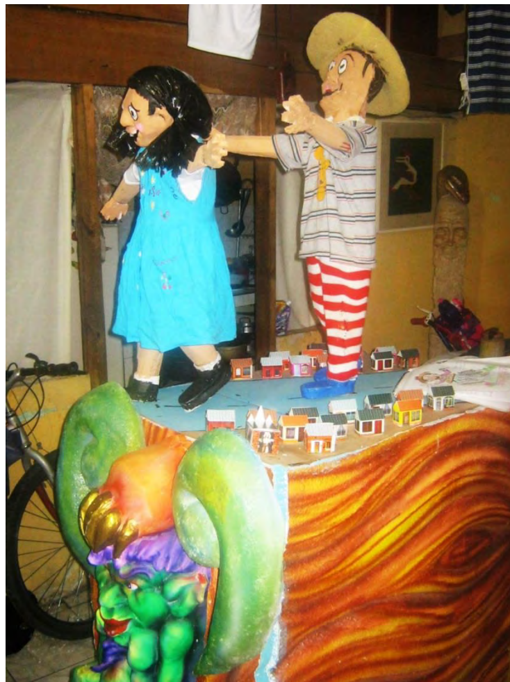
Figura 37. Carrocita que viva el tres que viva yo