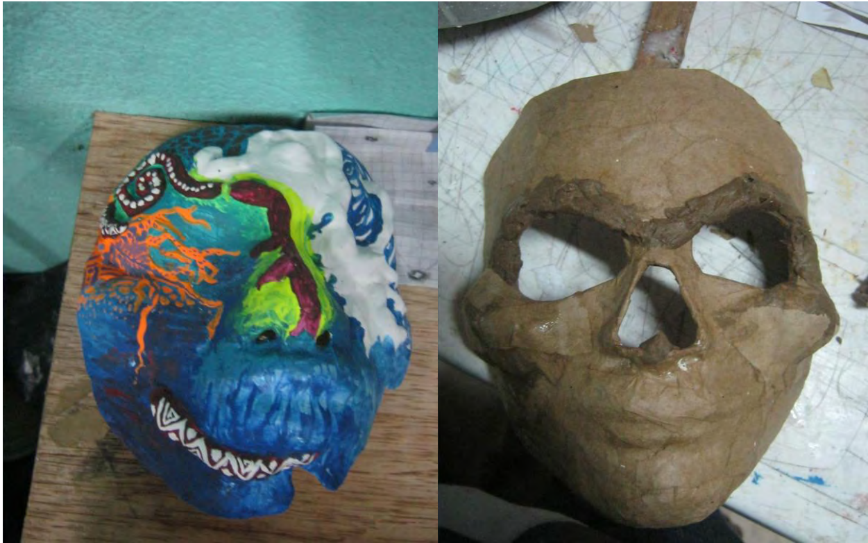
Figura 30. Pintura y Empapelado de máscaras de Yeso