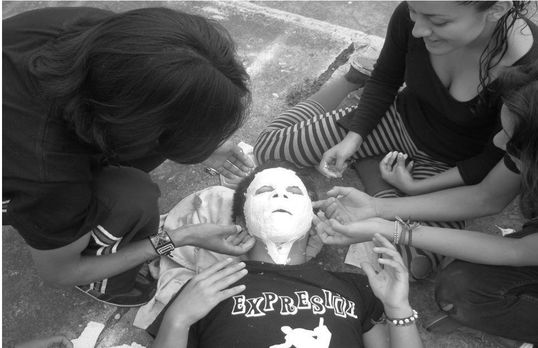
Figura 5. Proceso de hacer mascararas