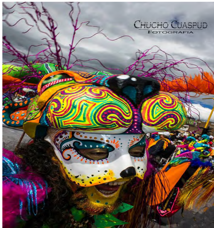
Figura 15. Mascara del carnaval. Fabricada con vendas de yeso

Cuando empecé a trabajar con el Colectivo Escaleras al Cielo el primer punto fue aprender a dibujar rostros con enfoque en la caricatura y partiendo de esto se les mostro la forma de realizar rostros con figuras geométricas y distintos movimientos del rostro y sus expresiones. La técnica de dibujar genera confianza y creatividad, y El Colectivo Escaleras se ha ido fortaleciendo con el tiempo, su ingenio por hacer las cosas se enriquece con el dibujo y la caricatura.