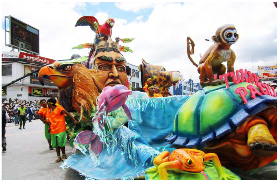
Figura 8. Carroza no motorizada “TUKUY PACHA MAMA”

A medida que van adquiriendo los conocimientos que se comparte, el estudiante desarrolla sus aptitudes artísticas y expresivas hacia la sensibilización del Carnaval de Negros y Blancos. Sin importar en las condiciones donde se trabajen pues sus estatutos económicos no son impedimento de no hacer las cosas.