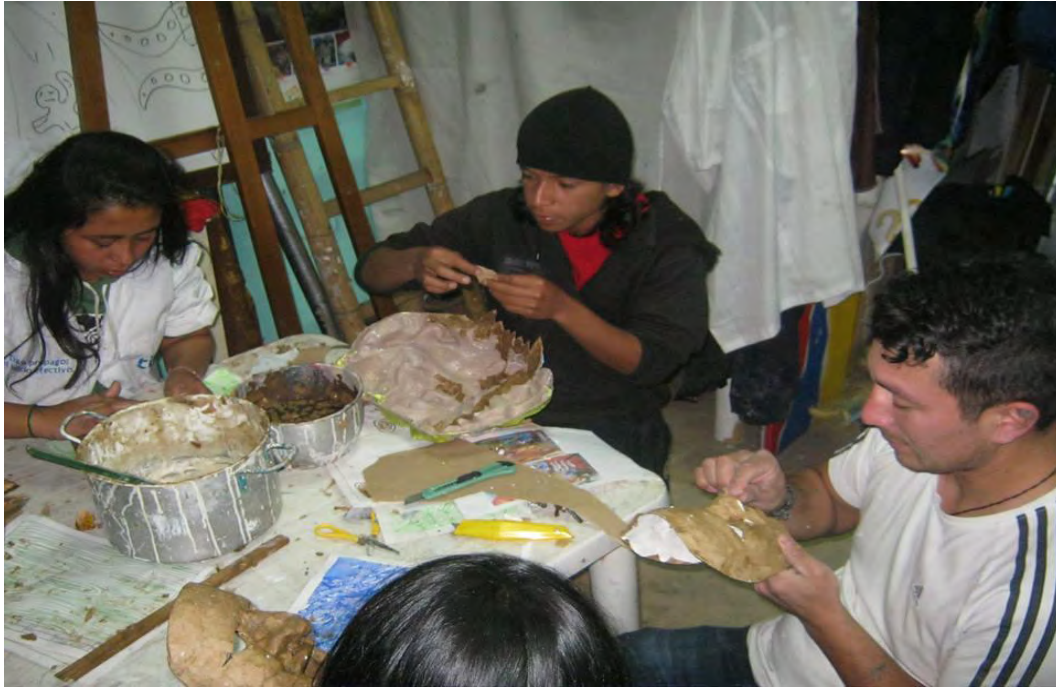
Figura 21. Dando forma a mí sueño