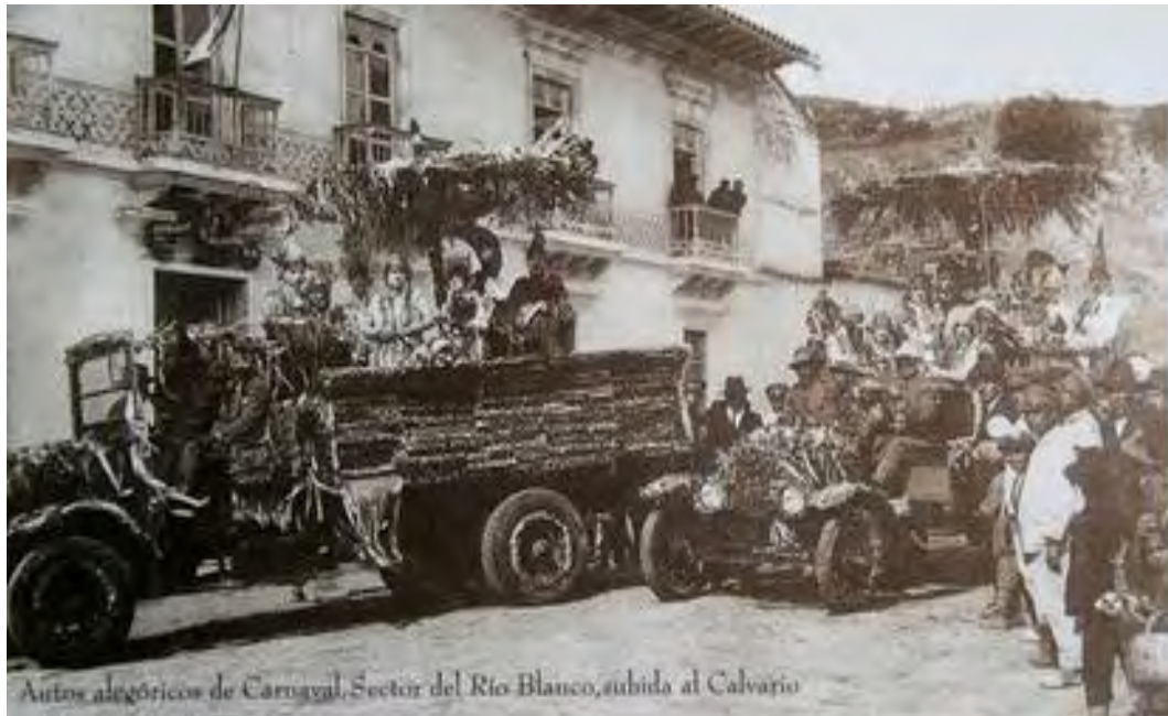
Figura 12. Desfile de carrozas