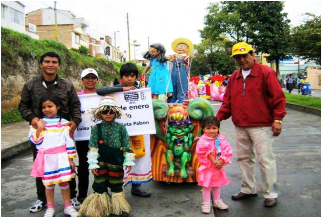
Figura 25. Alegría y orgullo de hacer parte del carnaval

los familiares más cercanos y las felicitaron y se tomaron fotos creo que ese es el reconocimiento de un artesano el elogio la cordialidad de los demás el aplauso, la foto, en su cara se miraba esa alegría y el orgullo de hacer parte del carnaval.