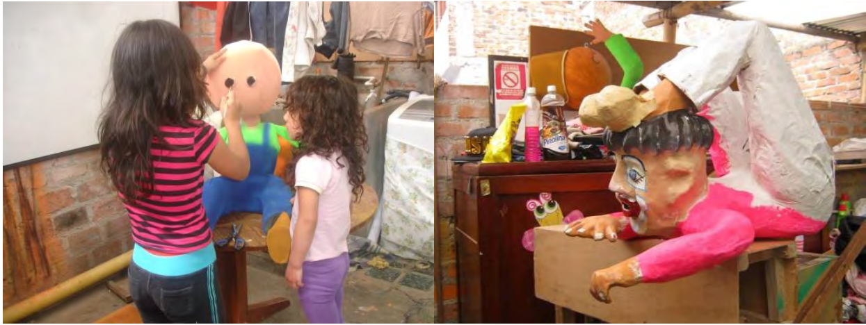
Figura 36. Detallando imágenes principales carnavalito