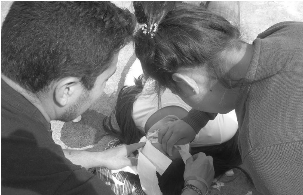
Figura 4. Proceso de hacer mascarar

Al mismo tiempo se iba trabajando el vestuario y la creación máscaras en yeso, en el cual el Colectivo Escaleras al Cielo, afirman no tener mucho conocimiento de la técnica.