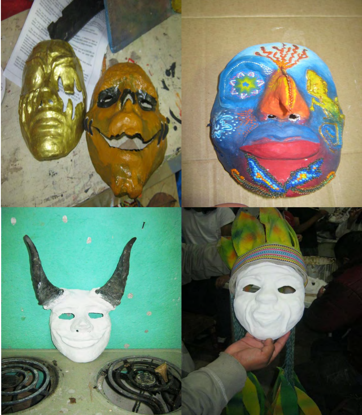
Figura 32. Máscaras de Yeso terminadas