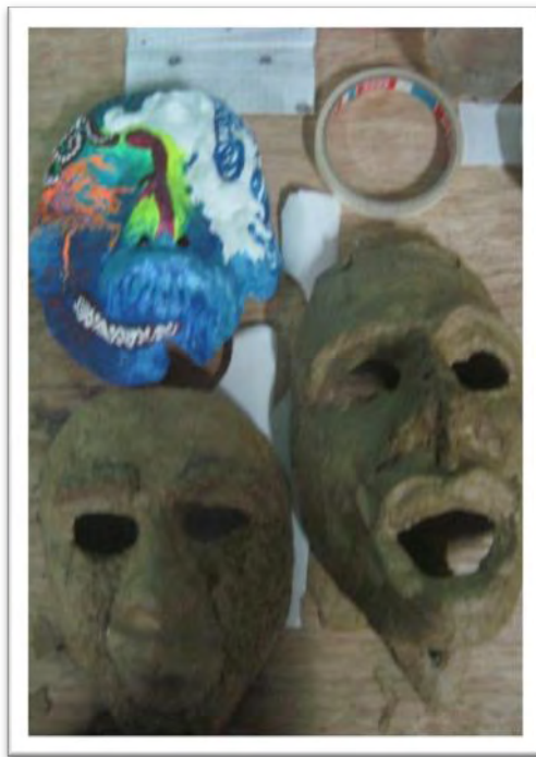
Figura 29. Empapelado de máscaras de Yeso