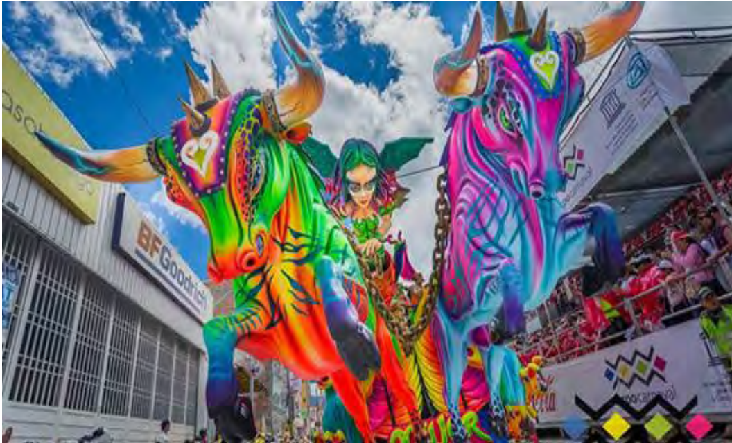
Figura 9. Carroza motorizada “MUJER GUERREA DE VIDA

Continuando muchas veces el tiempo es el enemigo del artesano pero al mismo tiempo es la unión entre amigos, familiares y vecinos que se reúnen a ayudaren especial los niños que con su inocencia y curiosidad dan lo mejor para aprender de algo nuevo que le ofrece la vida.