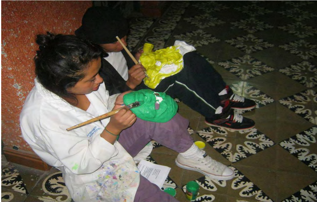
Figura 22. El sueño y la fantasía se llena de color