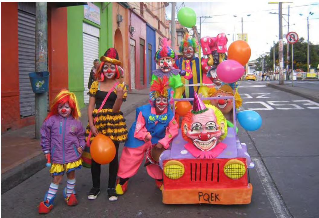
Figura 39. Payasaditas en el carnavalito