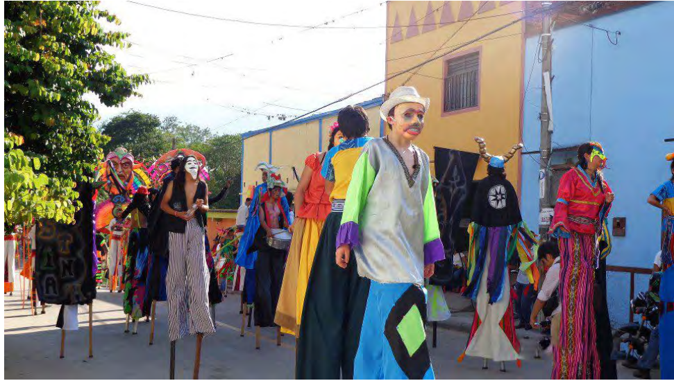
Figura 33. Integrantes colectivo Escaleras al Cielo en desfile Neiva.