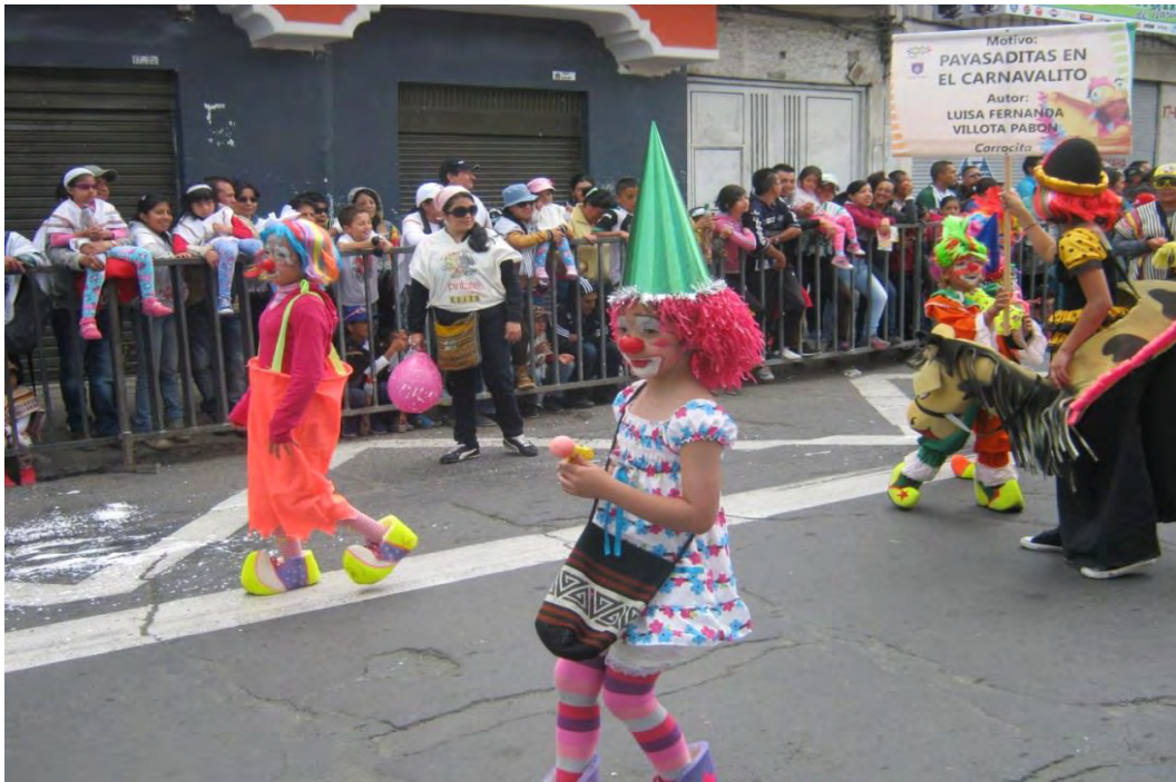
Figura 40. Payasaditas en la senda del carnaval