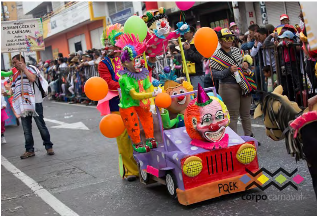
Figura 41. Payasaditas en la senda del carnaval