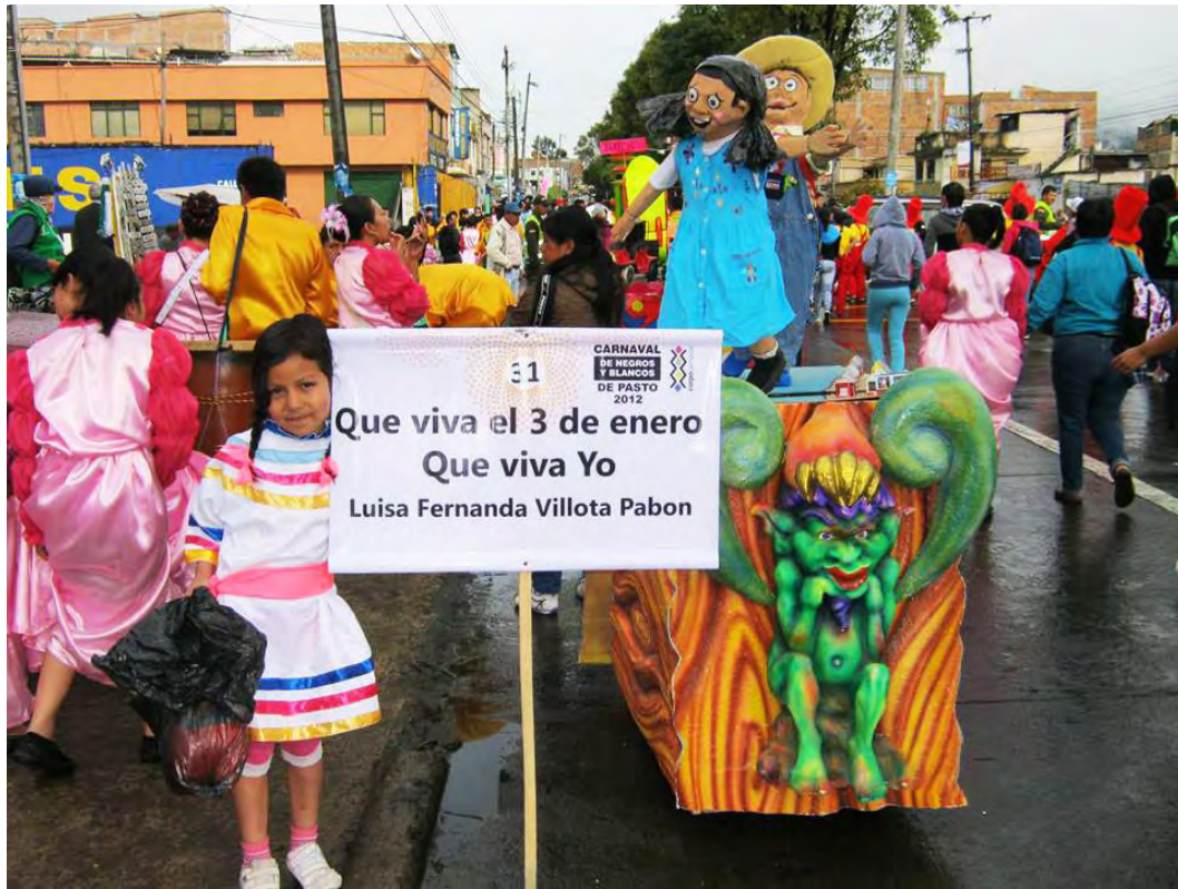
Figura 44. Autora que viva el tres que viva yo