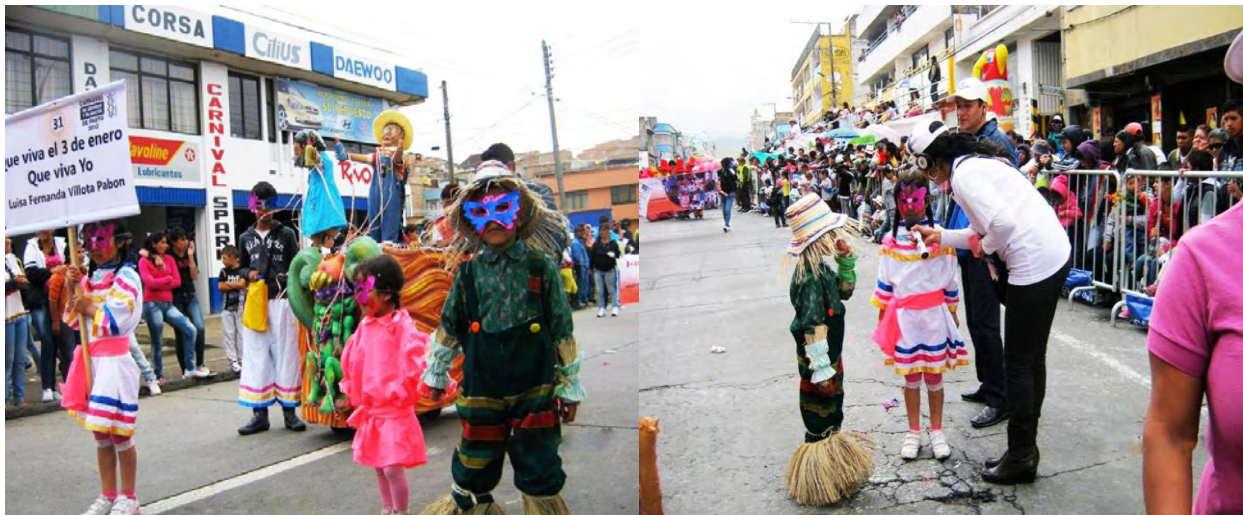
Figura 26. El camino de la locura y la alegría