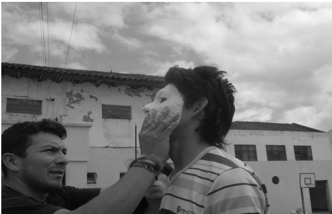
Figura 6. Proceso de hacer mascararas