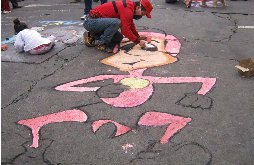
Figura 18. Dibujando en la vía. Conocido como arcoíris en el asfalto