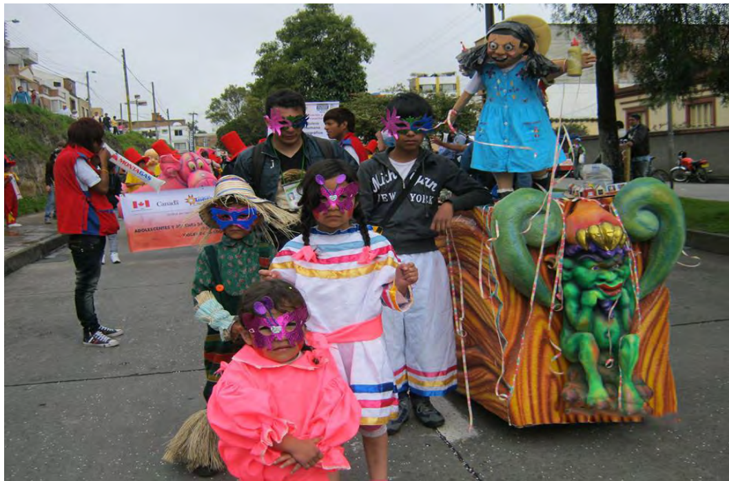
Figura 45. La familia, que viva el tres que viva yo