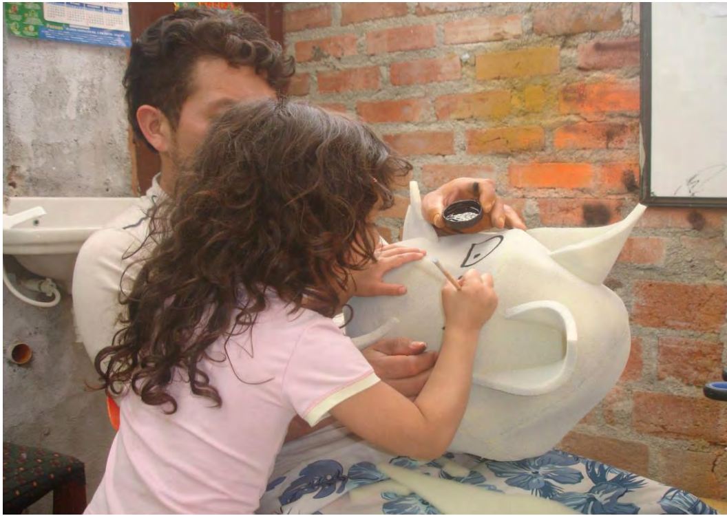
Figura 34. Elaboración tocados en espuma