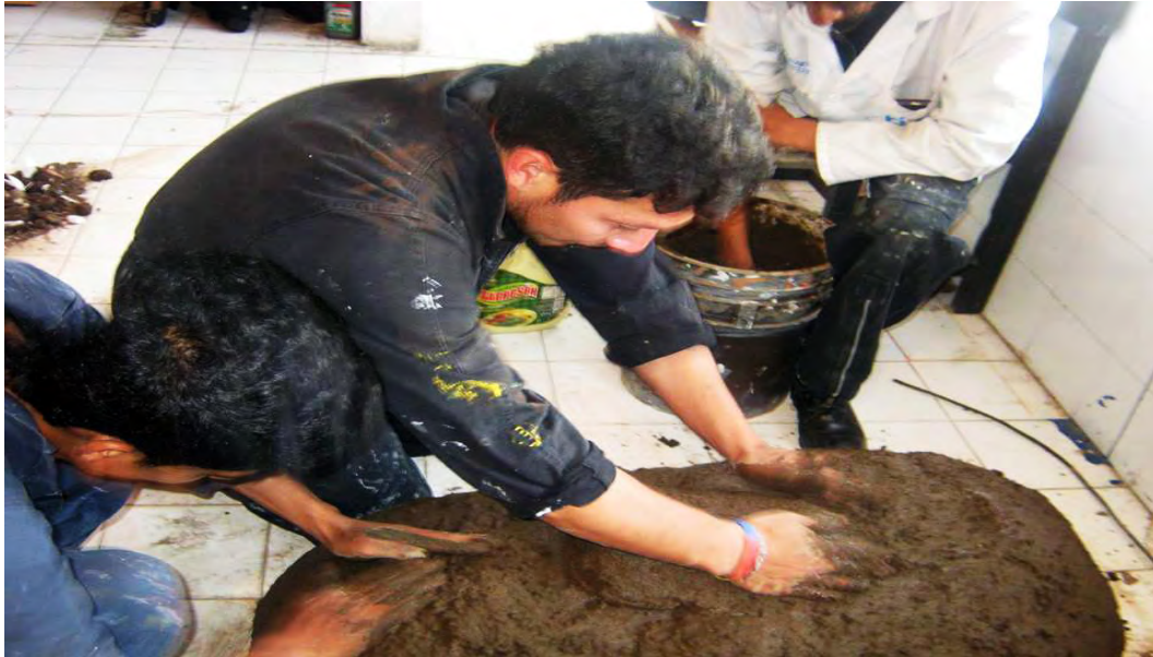
Figura 13. Proceso tradicional del modelado con barro