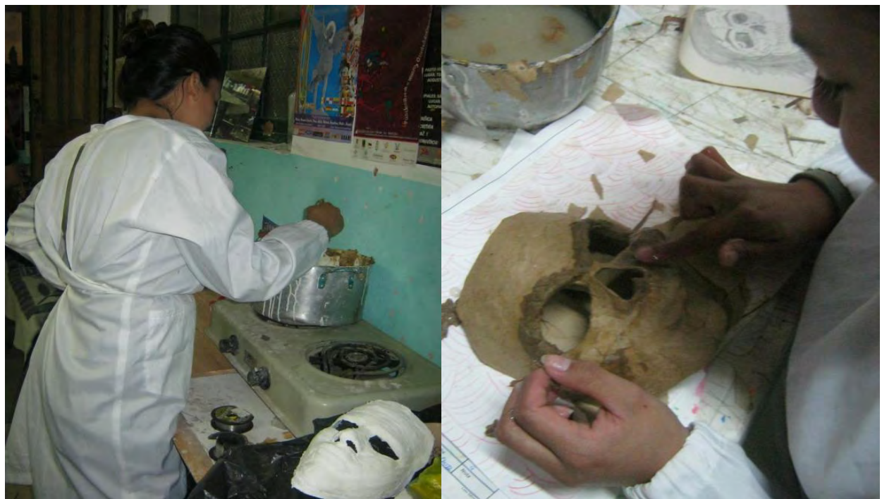
Figura 31. Empapelado de máscaras de vendas de Yeso