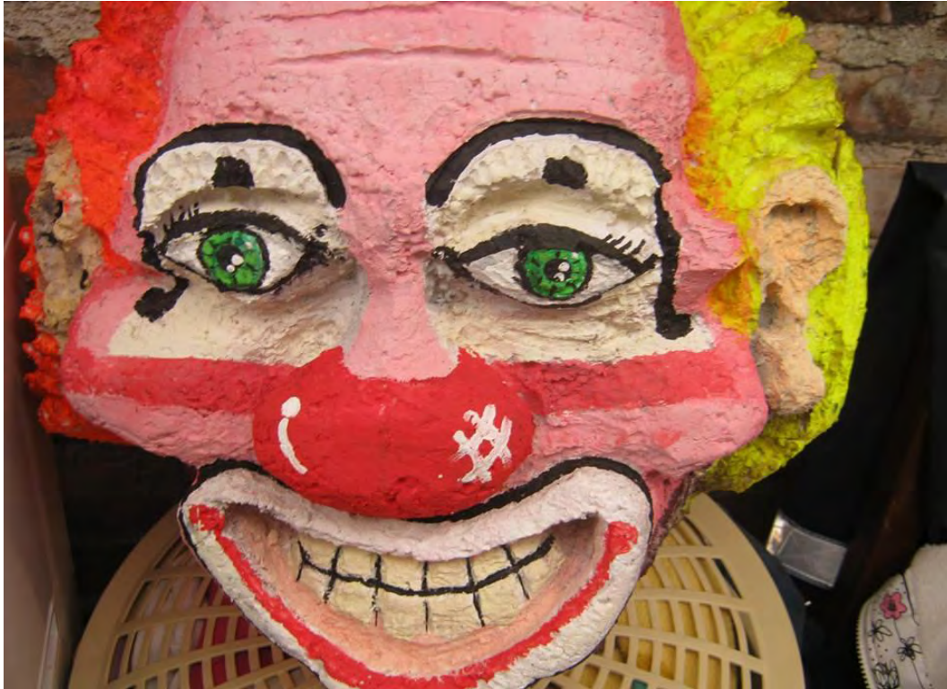
Figura 38. Payaso tallado en icopor