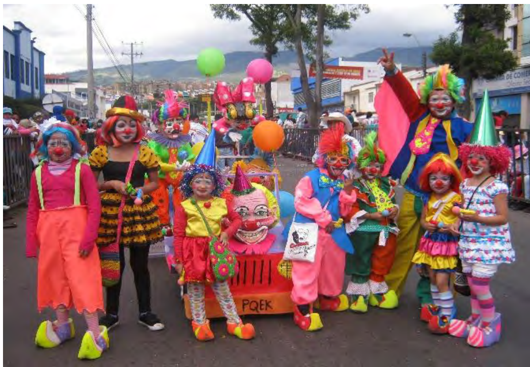
Figura 27. Actividad artística con nuestros hijos

La educación viene desde la casa, y que bueno sería que las casas sean escuelas y talleres, en donde todos los miembros de la familia participen y sean fuente principal de nuestros saberes, aquí está demostrado que para aprender solo es necesario tener las ganas y la disposición en fortalecer nuestro Carnaval de Negros y Blancos.