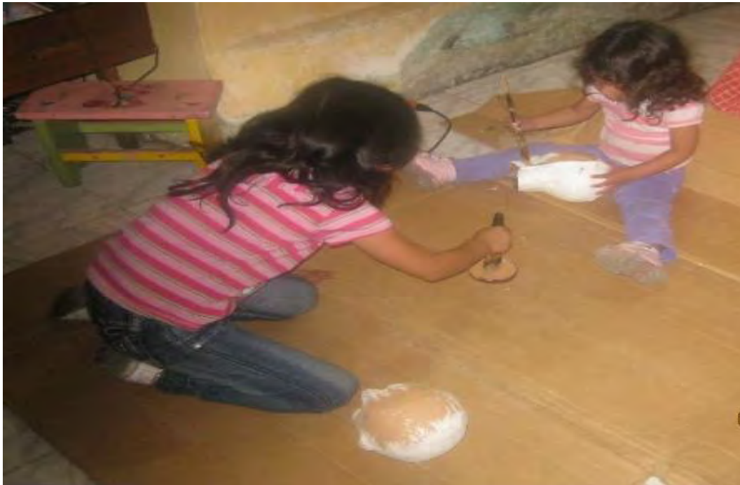
Figura 24. De travesura en travesura se fue armando la carrocita

“Pintar, modelar, dibujar son actividades fundamentales en el proceso de desarrollo y madurez de los niños. La experiencia estética constituye una parte vital del fenómeno de construcción del pensamiento” (Colombia. Ministerio de Educación Nacional, s.f., párr. 1).