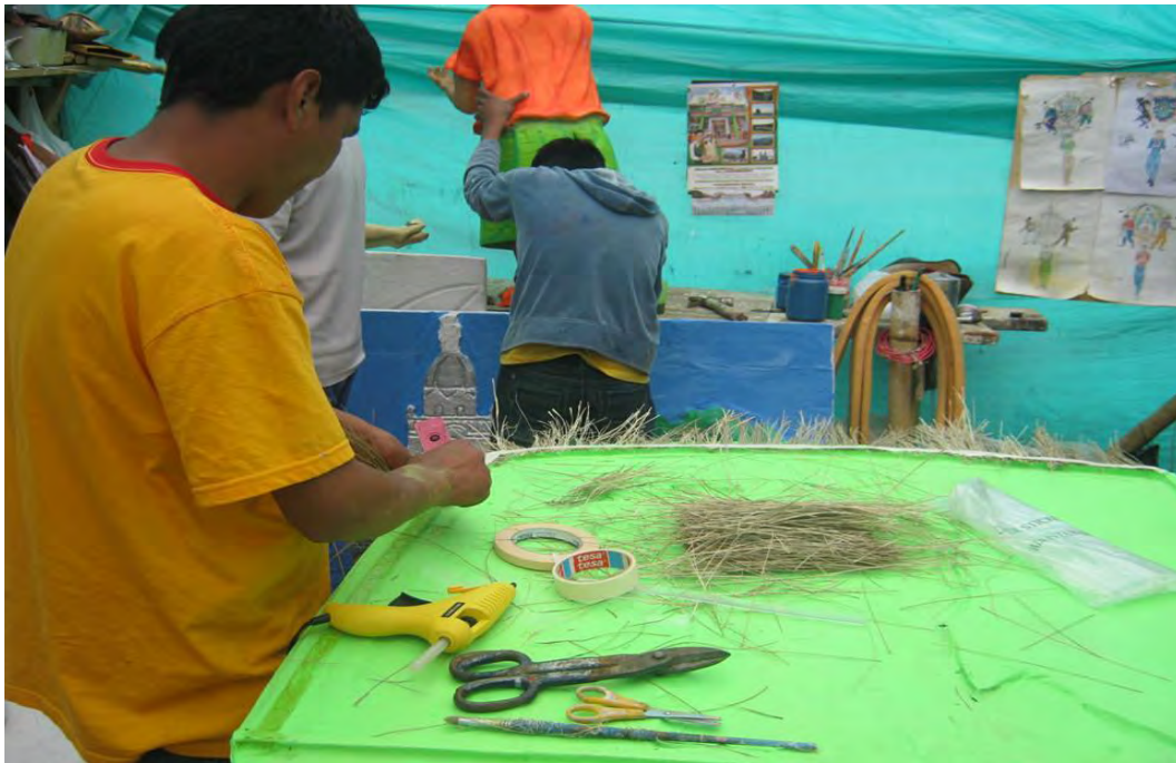
Figura 7. Decorando con paja seca un motivo para el carnaval