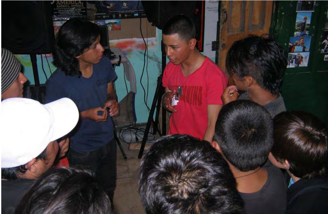
Figura 3. Colectivo Escaleras al Cielo, dando a conocer su personaje