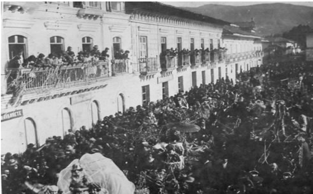
Figura 11. Desfile del 6 de enero por las calles de Pasto

“Entre los elementos fundamentales de nuestro carnaval, están el hecho de ser incluyente, tiempo en el cual todos somos iguales y podemos mofarnos hasta de las normas y autoridades que nos rigen el resto del año” (Vela, 2015, p. 1).