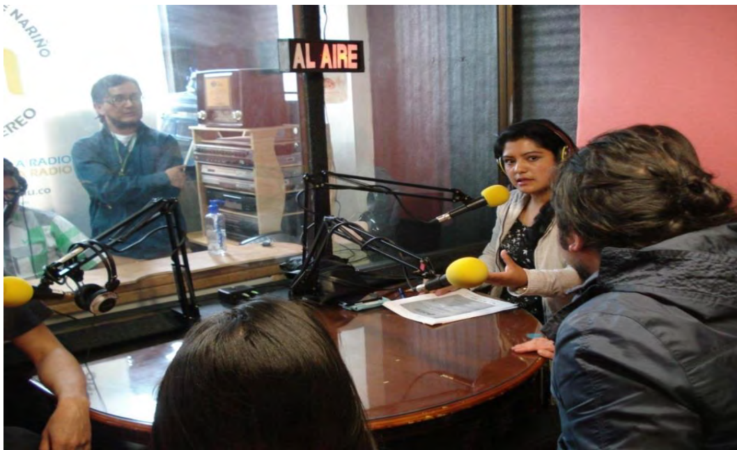
Figura 10. Presentación del cuento en la emisora Universidad de Nariño

La experiencia con el colectivo fue muy enriquecedora pues nunca habían tenido un contacto en la emisora, al iniciar, como todo, siempre con nervios, pero solo fue darles confianza y todo fluyó, dando como resultado colectivo de una experiencia pedagógica muy agradable y enriquecedora.