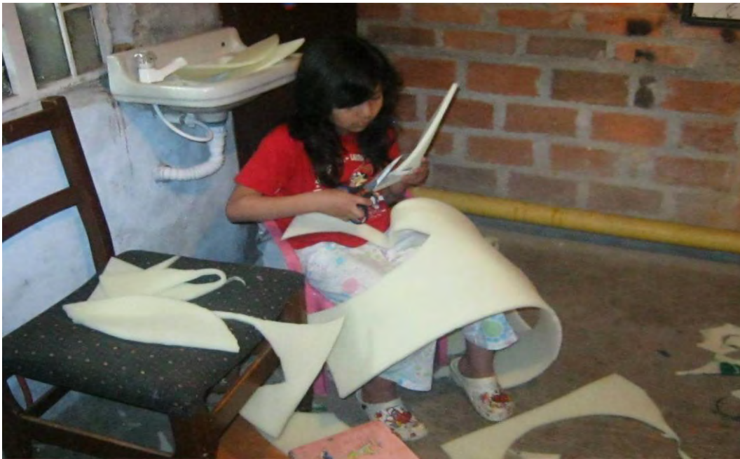
Figura 35. Elaboración de flores en espuma