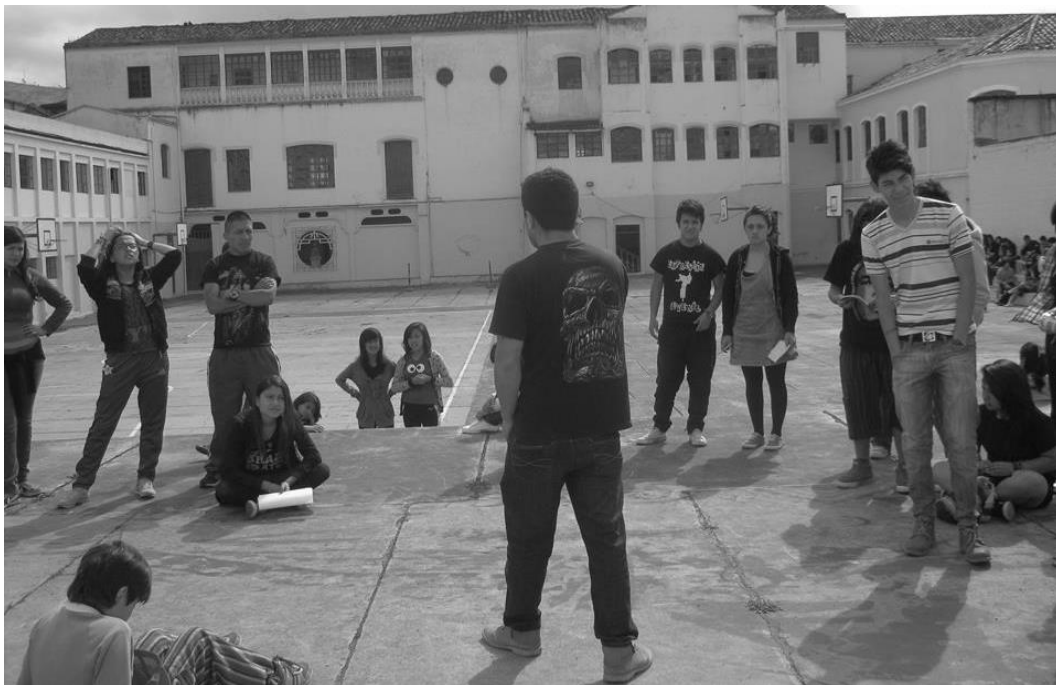
Figura 1. Socialización con el Colectivo Escaleras al Cielo

Ante esto se observó que los chicos y chicas integrantes del Colectivo Escaleras al Cielo tenían debilidades en la creatividad, de igual manera la carencia de conocimientos en la técnica sobre la realización de motivos para el Carnaval de Negros y Blancos. Pero con una gran ventaja, la del gusto por aprender, esto motivo al grupo de jóvenes de manera enérgica, y posteriormente se da a conocer la metodología de trabajo el cual el Colectivo Escaleras a Cielo lo tomo de muy buena manera.