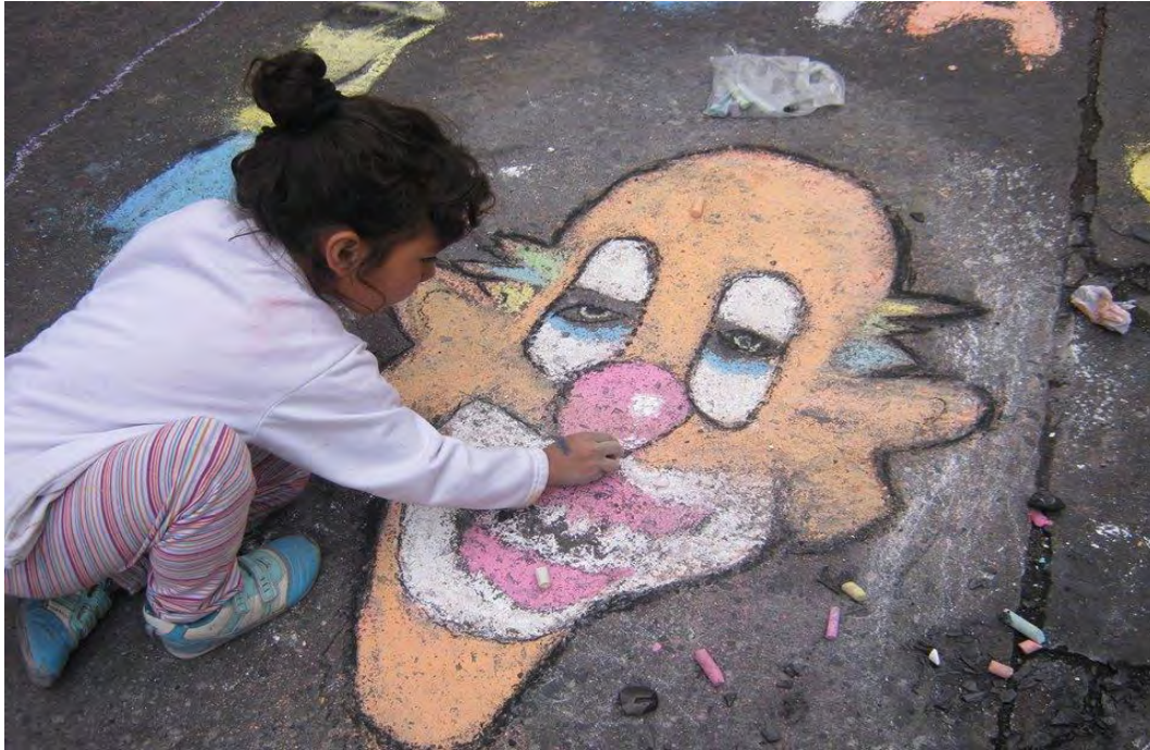
Figura 19. Niña dejando volar su imaginación y colorido