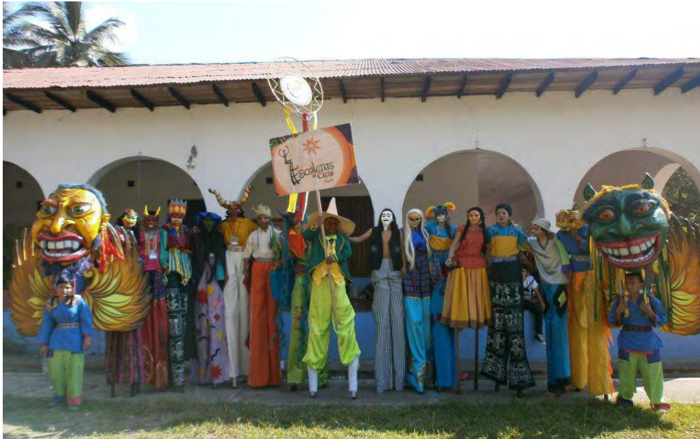
Figura 28. Colectivo Escaleras Cielo en el nacional de sancos en Neiva