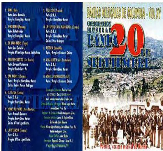
Imagen 8. Bandas musicales de Colombia. Vol. 15.