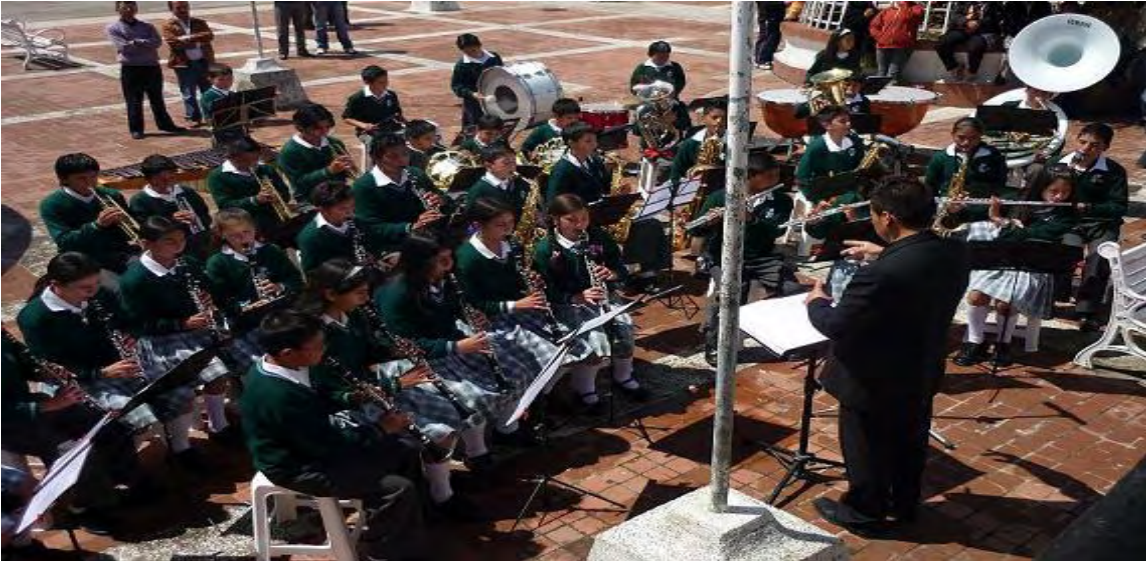
Imagen 3. Escuela de Música Floresmilo Flores