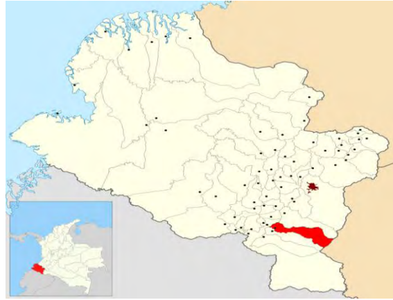
Imagen 2. Mapa geográfico del municipio de Puerres