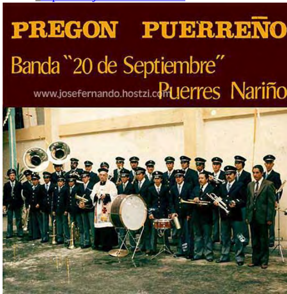
Imagen 6. Lp 1. Pregón Puerreño