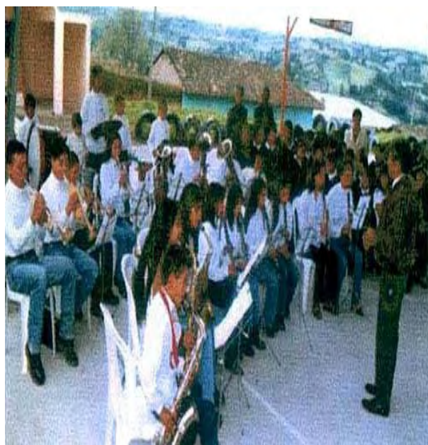
Imagen 5. Escuela de Música Floresmilo Flores.