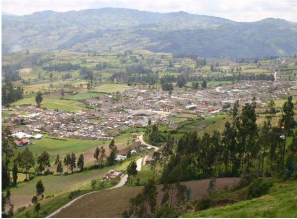
Imagen 1. Panorámica del municipio de Puerres