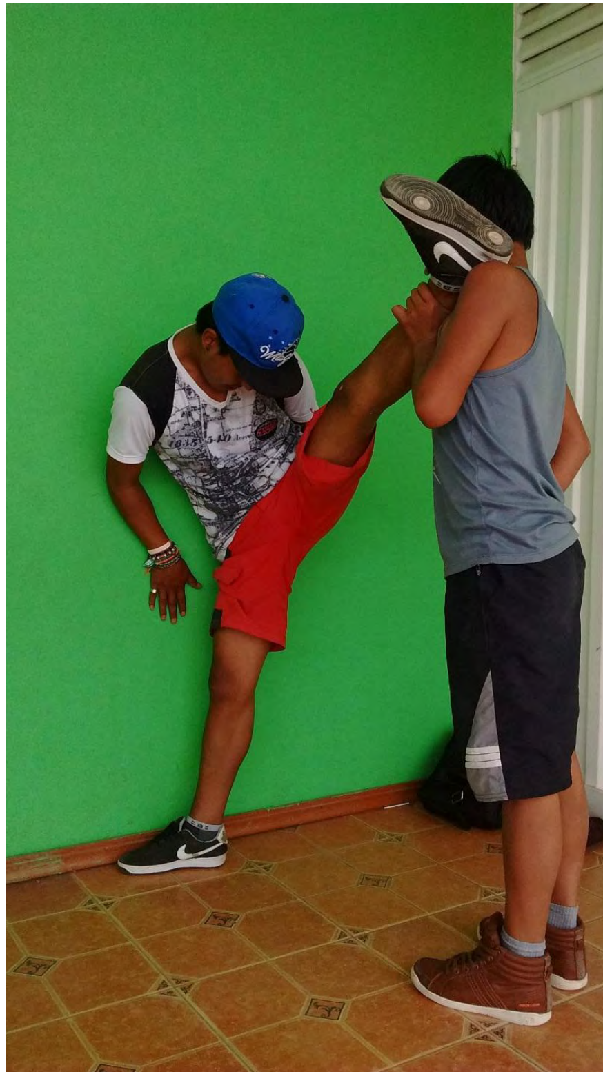
Figura 33. Ejercicios grupales 3