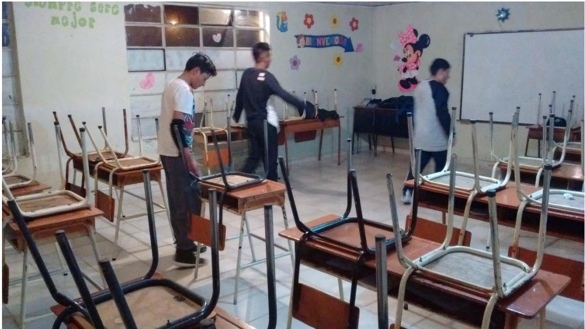
Figura 18. Re conceptualizar al aula – Fuente: Archivo Personal.

En esta imagen se observa como los jóvenes organizan el salón para realizar el ensayo, al ejecutar esta acción, de mover los pupitres, se genera otro concepto respecto al que normalmente tenemos sobre un aula de clases, desde este punto se aporta a la transformación del pensamiento porque rompemos ese pensar de que un aula es simplemente para llegar a sentarse y escuchar, encontramos así en este lugar una alternativa diferente de formación transformando ese espacio a nuestro estilo de formación.