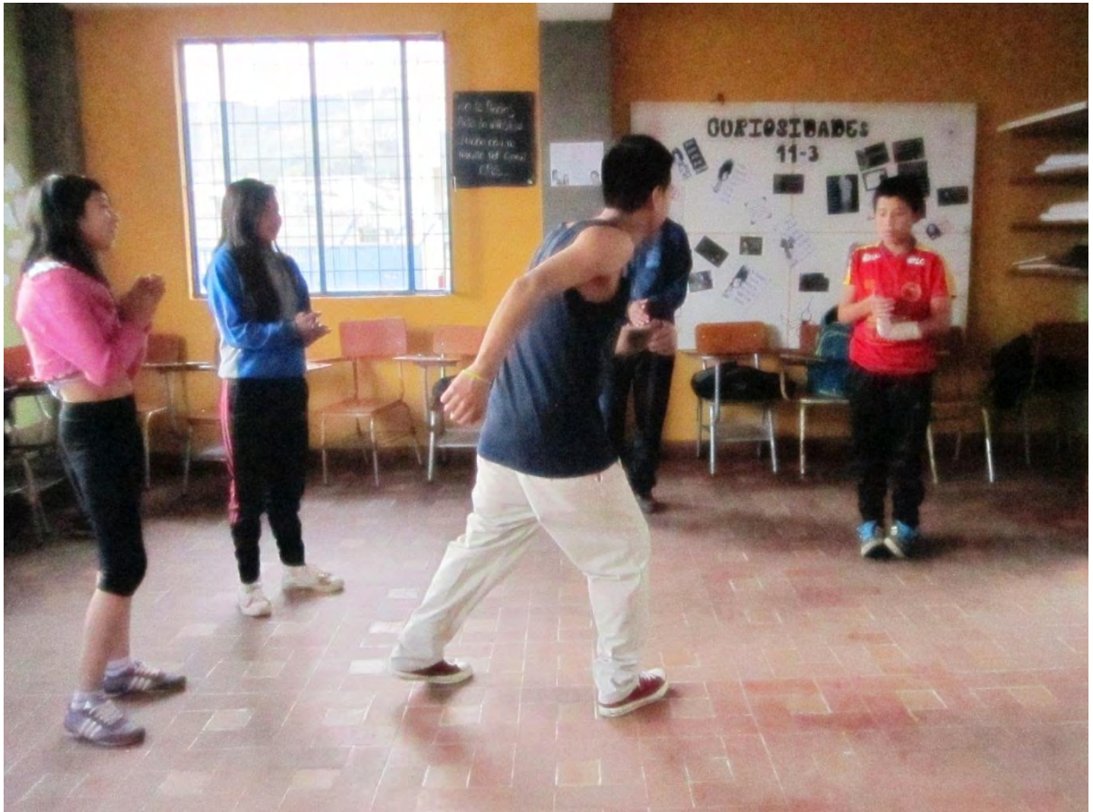
Figura 3. Pasos básicos top rocking break dance.

Como se observa en la imagen, en esta clase se realizó la introducción a pasos básicos del top rock brindando algunas pautas en cuanto a la postura de los brazos y piernas, también es evidente la facilidad para realizar y asimilar la mecánica del movimiento en algunos de ellos, por el contrario en otros se les dificulta la coordinación al ejecutar los pasos.