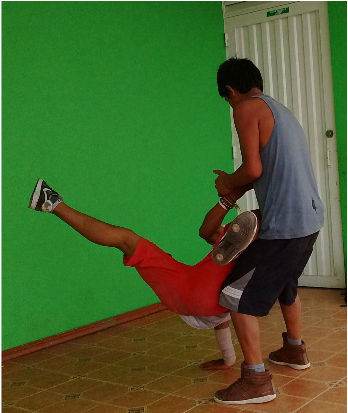
Figura 34. Ejercicios grupales 4 – Fuente: Archivo Personal.

Otro aporte que se genera a través de la danza es la creatividad, potencializarla es fundamental en nuestra formación porque una persona creativa resuelve con mayor facilidad dificultades en su vida al observar diferentes maneras de hacer o resolver ciertas situaciones,