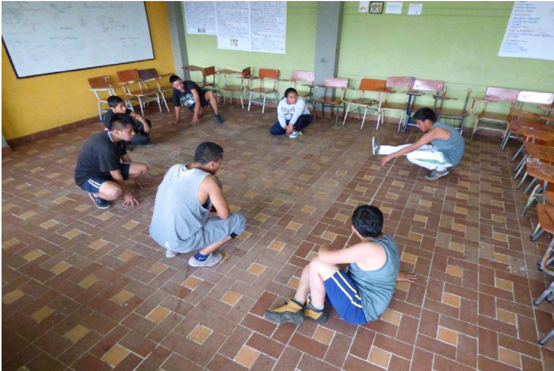
Figura 15. Interactuando en grupo

un factor que influye considerablemente en el desarrollo integral de un individuo ya que fomenta las capacidades corpóreas, psicológicas y sociales, porque la práctica de ella es necesaria para la interacción social y por ende para generar un incremento en la parte cognitiva del sujeto y espiritual a cada persona” E2ES1234P3