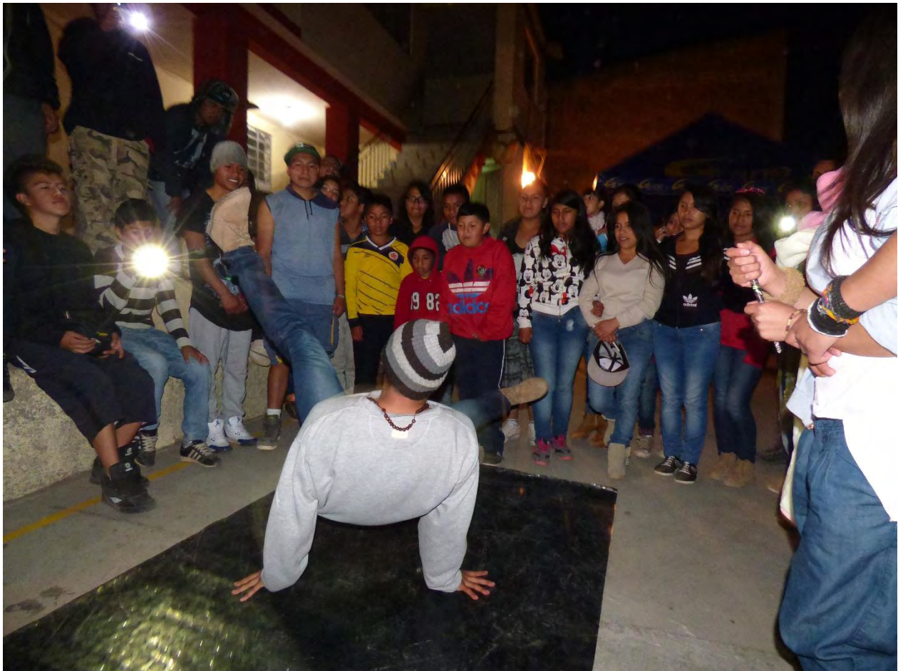
Figura 23. Exhibición encuentros Hip Hop por la paz Catambuco – Fuente: David Prado.

El hombre ha bailado incluso antes de aprender a servirse de la palabra es decir, el hombre utilizó como medio de comunicación sus gestos corporales, sus señas, movimientos y expresiones. Por este motivo la danza ha permanecido viva a través de la historia como la palabra y ha servido y servirá para aquellos momentos en que la palabra