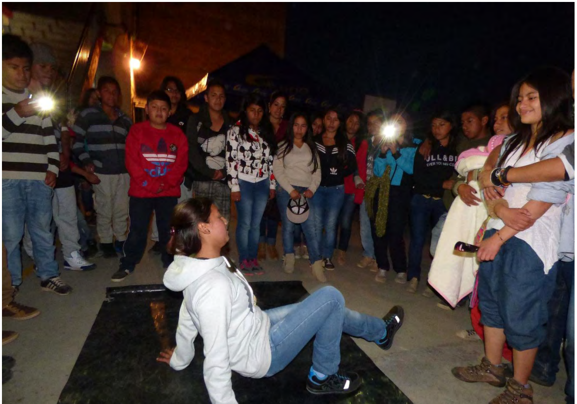
Figura 22. Demostrando habilidades

En el taller “Identidad y fortalecimiento colectivo” se plantea como objetivo compartir de manera grupal actividades alternas a las planteadas dentro del entreno, la intención de este taller fue interactuar y socializar con los diversos grupos que trabajan dentro de la institución, uno de ellos es la selección de microfútbol, quienes realizan su entreno cerca a nuestro espacio de ensayo, entonces se realiza un juego amistoso en el cual se relacionan e interactúan, también se evidencia la dificultad de algunos estudiantes en cuanto al manejo del balón pero el apoyo grupal genera esa confianza para entenderse y desenvolverse dentro del juego, al finalizar se crea un ambiente tranquilo y la facilidad de relacionarse con otras personas por medio del juego, fortaleciendo la capacidad de socializar en un entorno diferente al de los entrenos