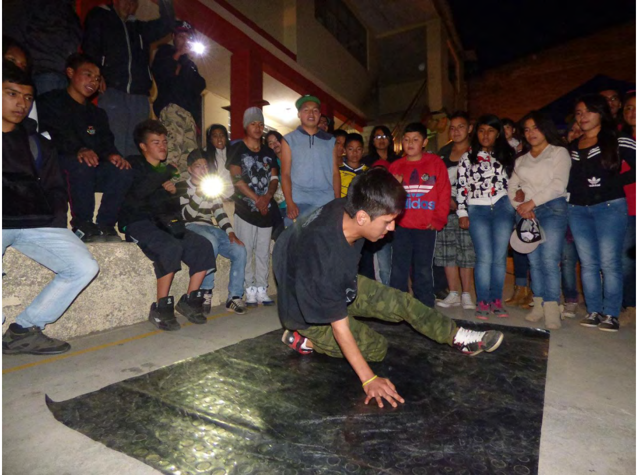
Figura 25. Encuentros Hip Hop por la paz Catambuco 2

Otra forma de generar un proceso de enseñanza es a través del ritmo, “la introducción del ritmo en cualquier movimiento, asegura su armonía y coherencia, la estructura temporal del movimiento, es lo que otorga unidad. ( Fructuoso Alemán & Gómez Serrano, 2001, pág. 32)