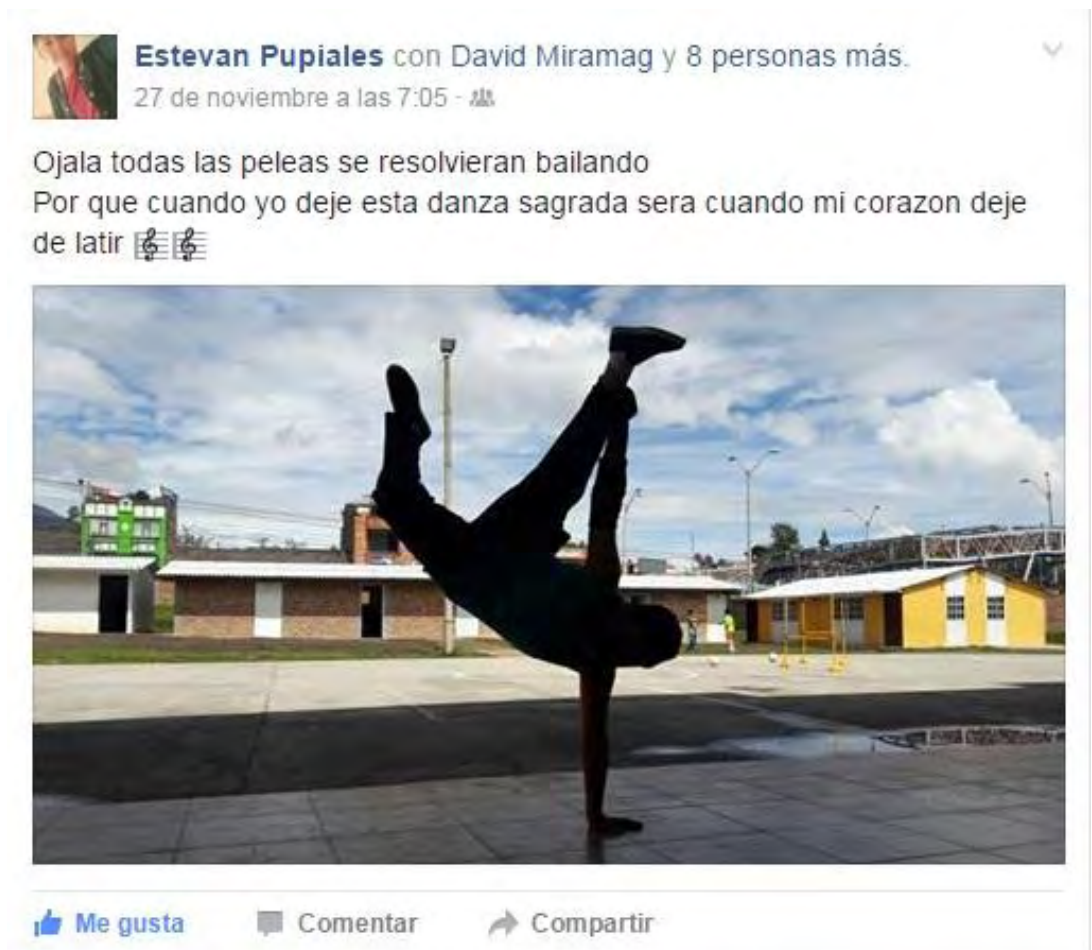
Figura 20. Apropiación de una ideología – Fuente: Facebook

https://www.facebook.com/photo.php?fbid=276149006120301&set=pb.100011756105039.-2207520000.1490286515.&type=3&theater