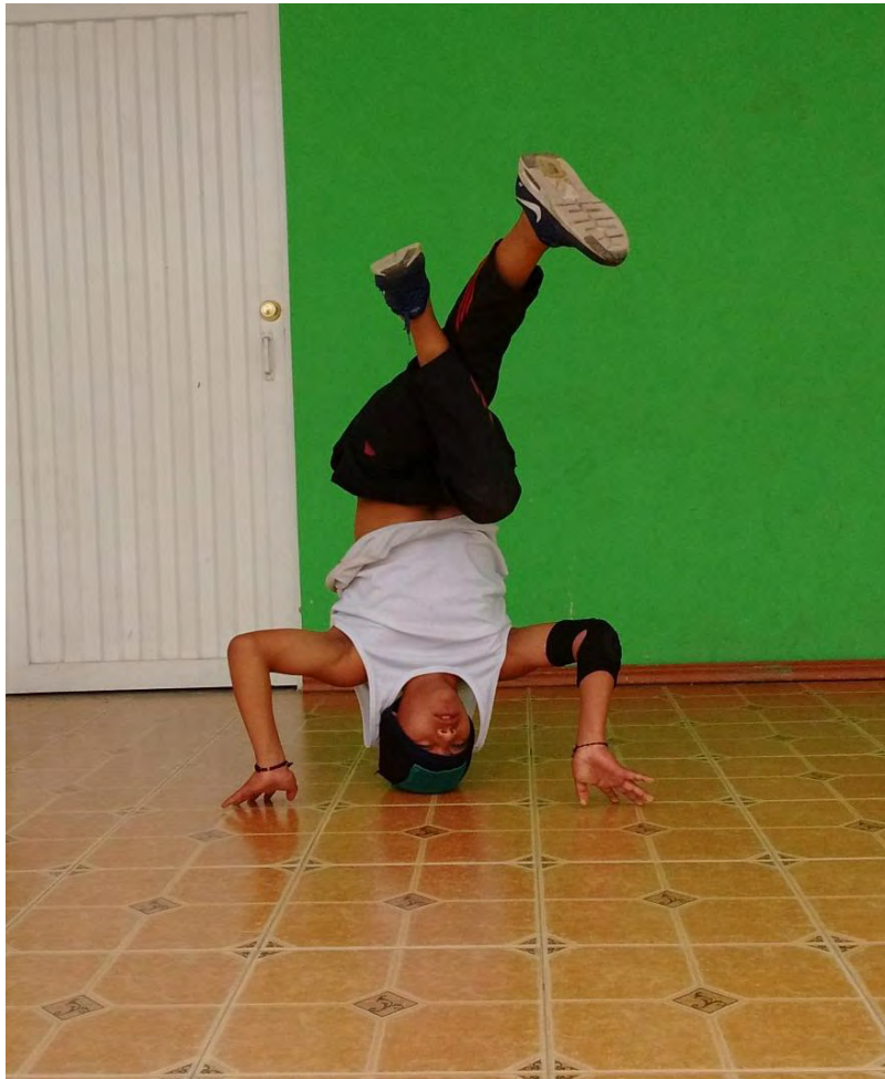
Figura 14. Giro de cabeza – Fuente: Archivo Personal.

Existen diversos tipos de disciplina que se manifiestan desde nuestra actitud o comportamiento. Hay muchas definiciones desde lo social, educativo, artístico, algunos la relacionan con seguir reglas, el buen comportamiento, practicar algún deporte, dentro del arte estaría la escultura, pintura entre otras, también se menciona la danza, cuando hablamos de el break dance como disciplina artística los estudiantes de las escuelas de formación afirman que “la danza aporta a la persona que lo practica porque uno crece, aprende a tratar a las personas a respetar, a escuchar, a coordinarse, a ser disciplinado. La danza es