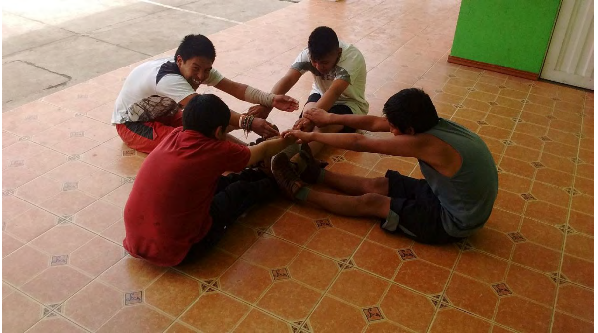
Figura 9. Compartiendo en grupo – Fuente: Archivo Personal.

“La danza es un fenómeno humano, universal y un elemento activo de la cultura que se manifiesta a través de diversos lenguajes que permiten comunicar, transformar ideas y opiniones y compartir emociones.” ( Rodríguez Abreu, 2010)