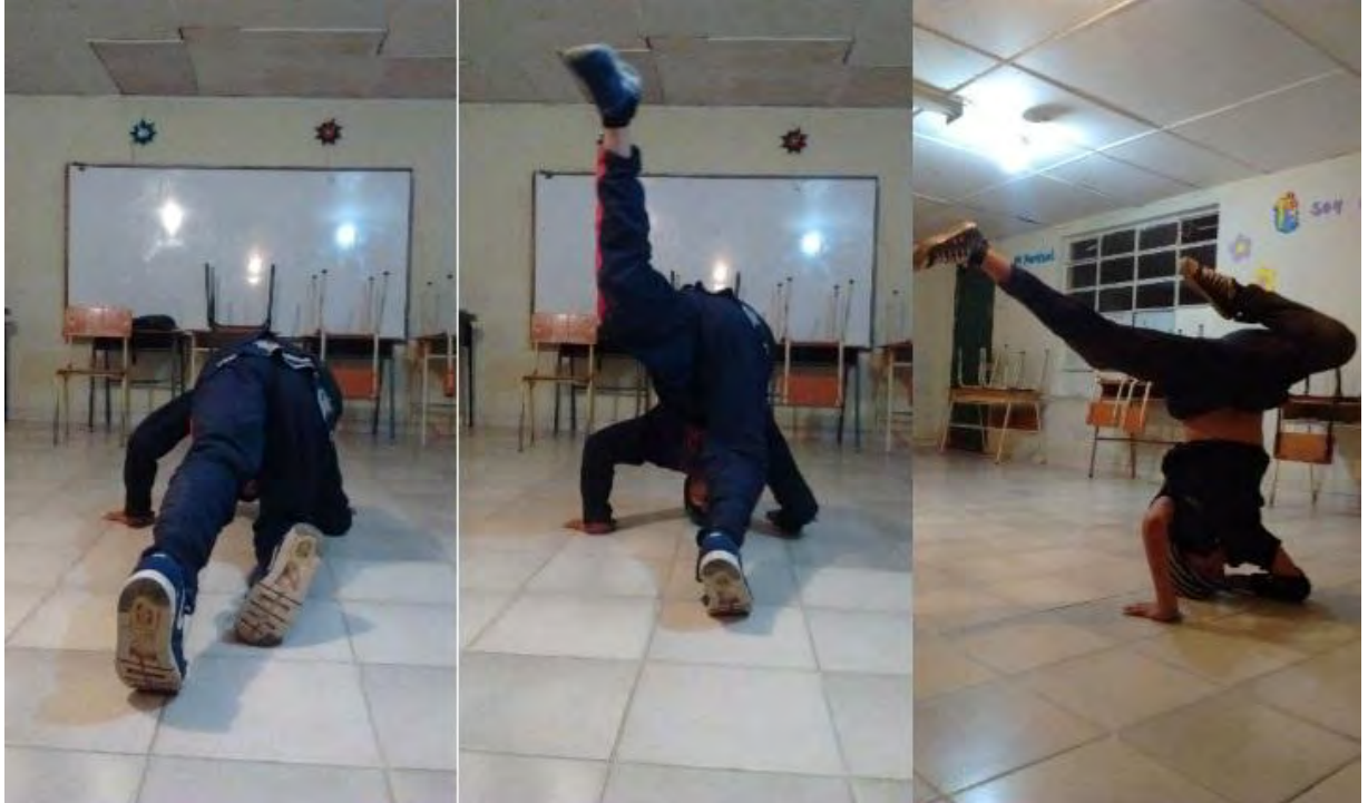
Figura 7. Freez de codo – Fuente: Archivo Personal.

En esta imagen el estudiante está realizando un freez de codo apoyado en la cabeza, esta es la postura básica de este movimiento que posibilita controlarlo con la práctica, mejorarlo y adecuarlo a su creatividad.