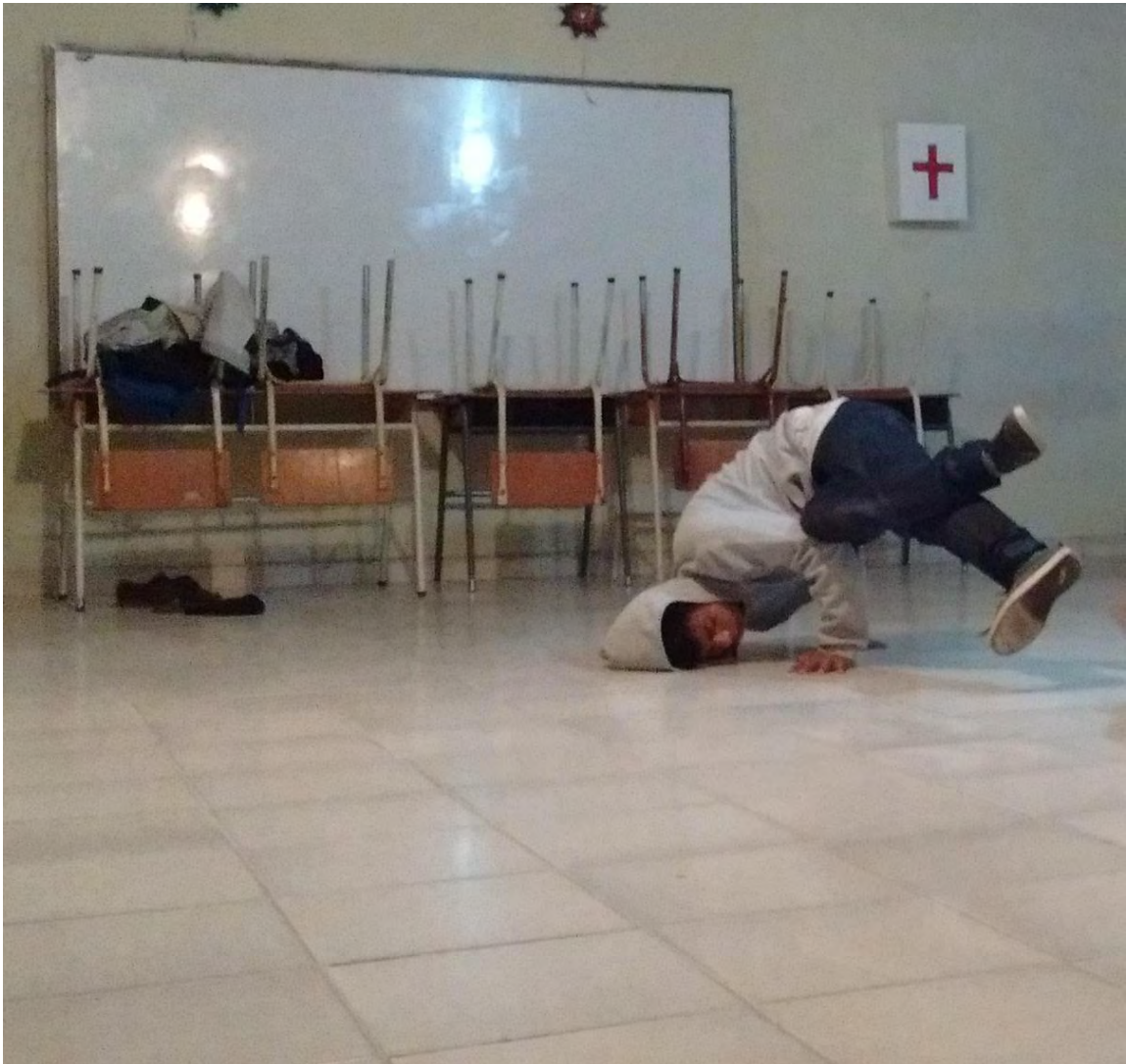
Figura 29. Taller A-B-C-DARIO – Fuente: Archivo Personal.

Los integrantes del grupo Coalición Crew demostraron apropiación e interés por generar diversas formas de enseñanza así como se evidencia en el taller “MI ENTORNO A TRAVÉS DEL CUERPO” temática planteada uno de los integrantes del grupo el tema fue apropiarse de un personaje de su comunidad, familia o escuela, representarlo, asignándole una sensación para transmitirla utilizando gestos corporales, con el objetivo de aportar en la confianza y liderazgo en el grupo, el estudiante estará a cargo de dirigir la temática al igual de sus compañeros los cuales deberán describir que personaje es. En la realización de este trabajo cada integrante se apropió de una representación entre las cuales se identificó profesores, futbolistas e integrantes de su familia, se observó que la mayoría de alumnos son creativos a la hora de representar su personaje aunque para algunos se les dificulta