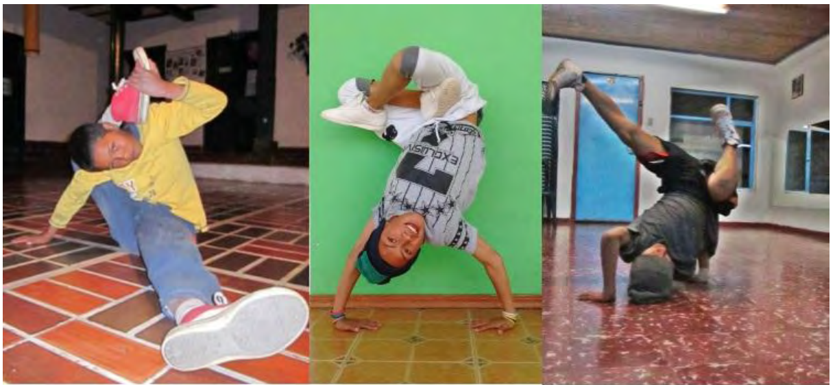
Figura 1. B-boys - Fuente Archivo Personal.

Como danza, nace en la marginalidad de las urbes en Nueva York, en barrios marginales como el Bronx y Brooklyn que son ejemplo de reivindicación y expresión cultural, por eso se convirtieron en el origen de la cultura Hip Hop.