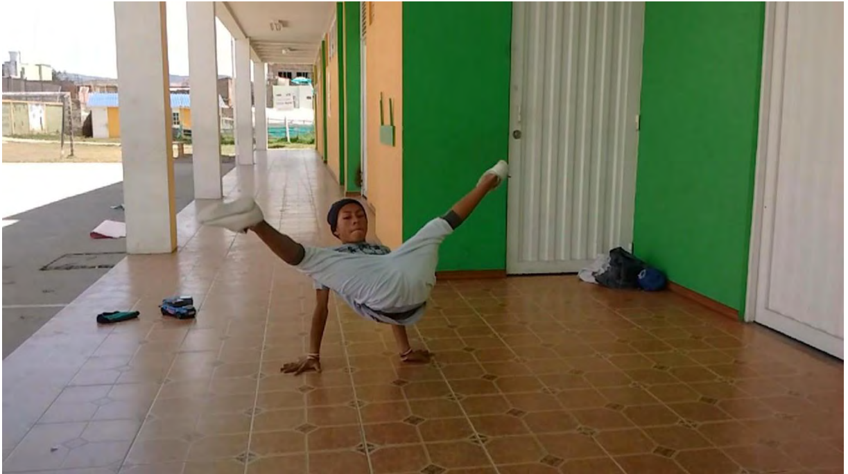
Figura 6. Caballete o Fler – Fuente Archivo Personal.

En esta imagen el estudiante está realizando un fler o caballete donde la finalidad de este paso es girar el cuerpo con las piernas abiertas tratando de mantener una posición en V sin bajarlas, soportando el peso del cuerpo con los brazos y el impulso de la patada.