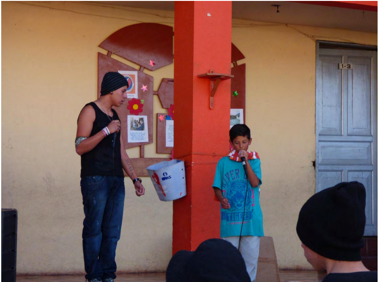
Figura 38. Vinculando futuras generaciones – Fuente: Archivo Personal.

Las personas habitan un territorio, que en este caso es urbano, una ciudad, que implica una pertenencia a un barrio pero también a una región a pesar de que algunos grupos juveniles compartan elementos estéticos y musicales con pares en otros lugares no es lo mismo ser joven en diferentes ciudades en diversos países del mundo. Las culturas juveniles, se apropian de espacios desde unas particularidades que están atravesadas por la clase social, el género y, por supuesto, lo local, lo que implica que las condiciones culturales, económicas y, en general, sociales son diferentes en la medida en que obedecen a dinámicas particulares. Aunque esto pueda parecer obvio, muchos de los estudios que se han realizado no muestran o ignoran aspectos diferenciales importantes, (...) las culturas juveniles diseñan estrategias concretas de apropiación del espacio: construyen un territorio propio ( MONTENEGRO MARTÍNEZ, 2004, págs. 132,133)