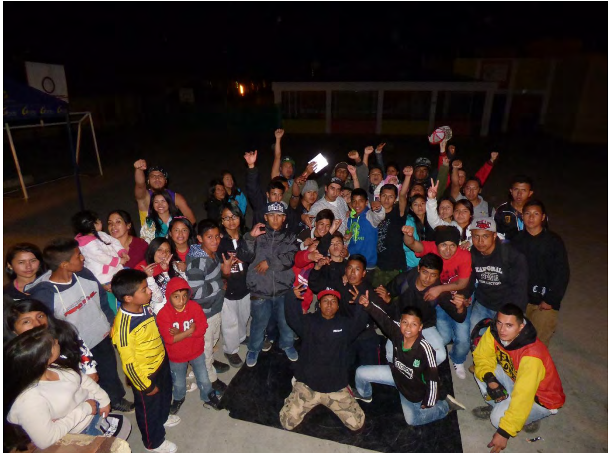
Figura 30. Hip Hop Catambuco – Fuente: Archivo Personal.

El break dance como herramienta de formación hace parte de un movimiento conformado por muchos complementos en la parte artística, no solo se habla del baile, es el Hip Hop en general, todas sus ramas de expresión y conocimiento forman un estilo de vida, el cual lo aplicamos en nuestra cotidianidad, representamos lo que somos en todo lugar, es un movimiento que forma seres humanos conscientes, creativos y únicos además que cada elemento que lo conforma lo podemos aplicar para generar diversos procesos de enseñanza educación y formación entorno a la cultura.