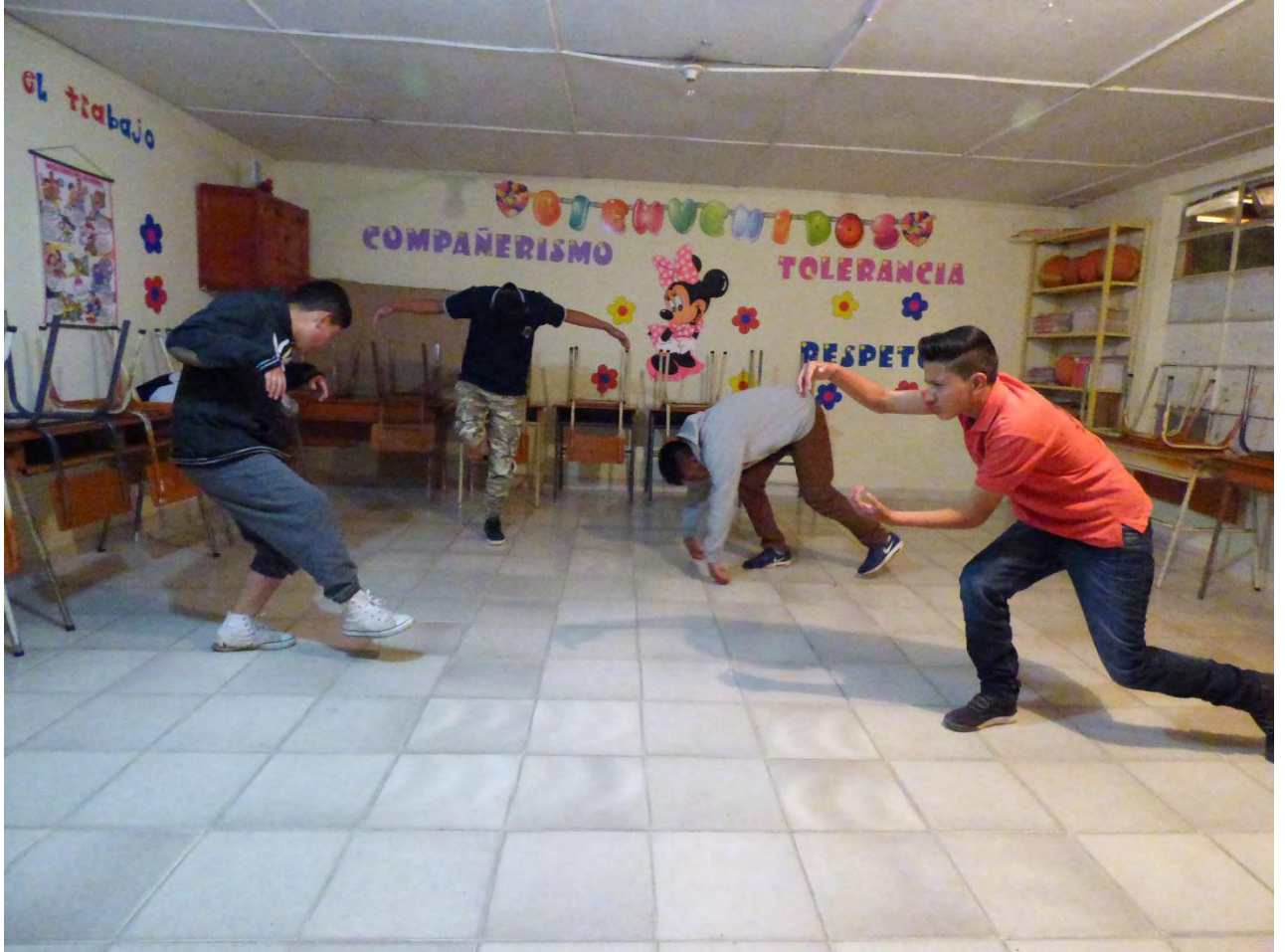
Figura 26. Taller BREAKZOO-MORFING – Fuente: Archivo Personal.