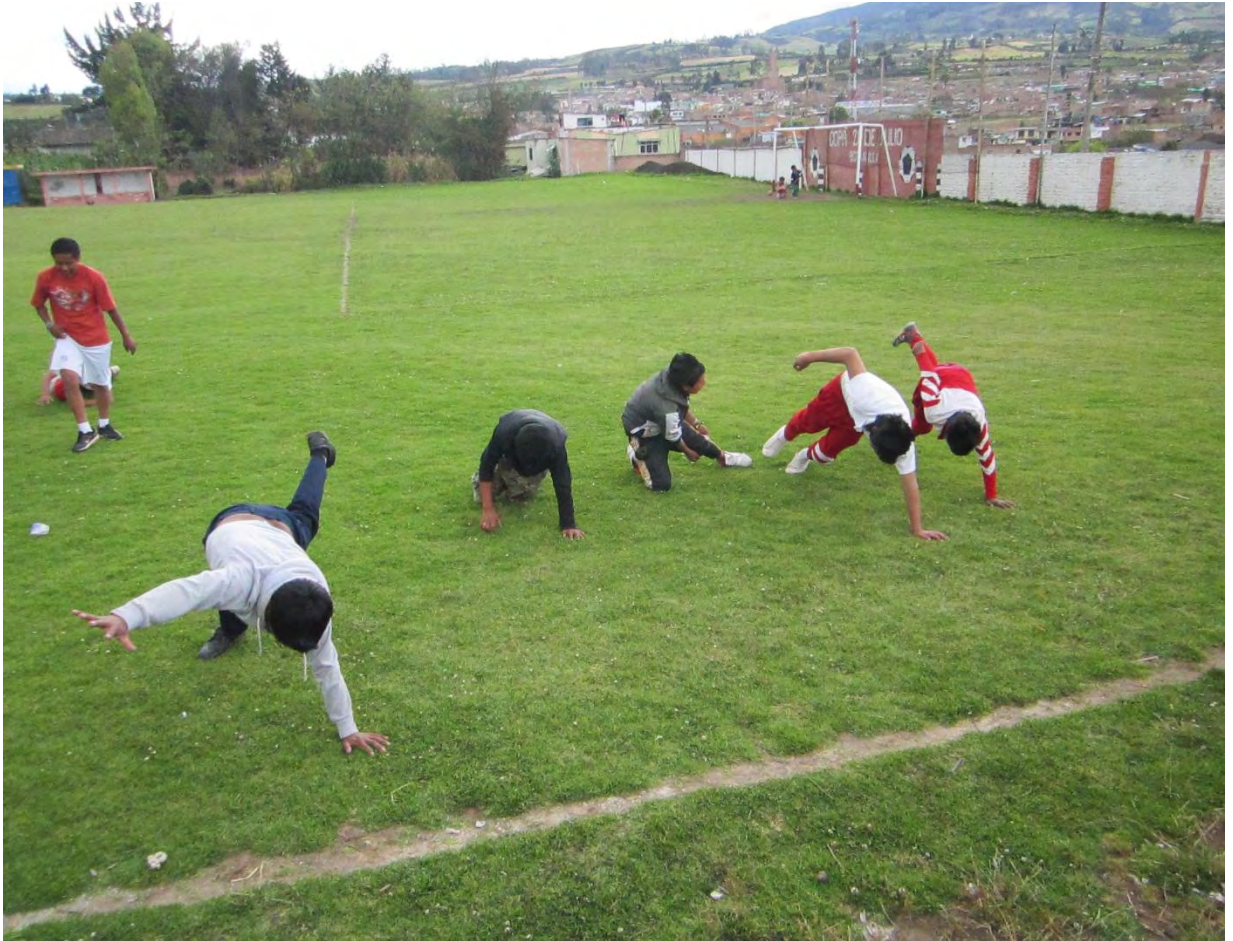
Figura 17. Compartiendo en diversos escenarios

Coombs y Ahmed, 1973, como se citó en Camors, 2009, afirman que la educación no formal se define como “toda actividad organizada, sistemática, educativa, realizada fuera del marco del sistema oficial, para facilitar determinadas clases de aprendizajes a subgrupos particulares de la población, tanto adultos como niños.”