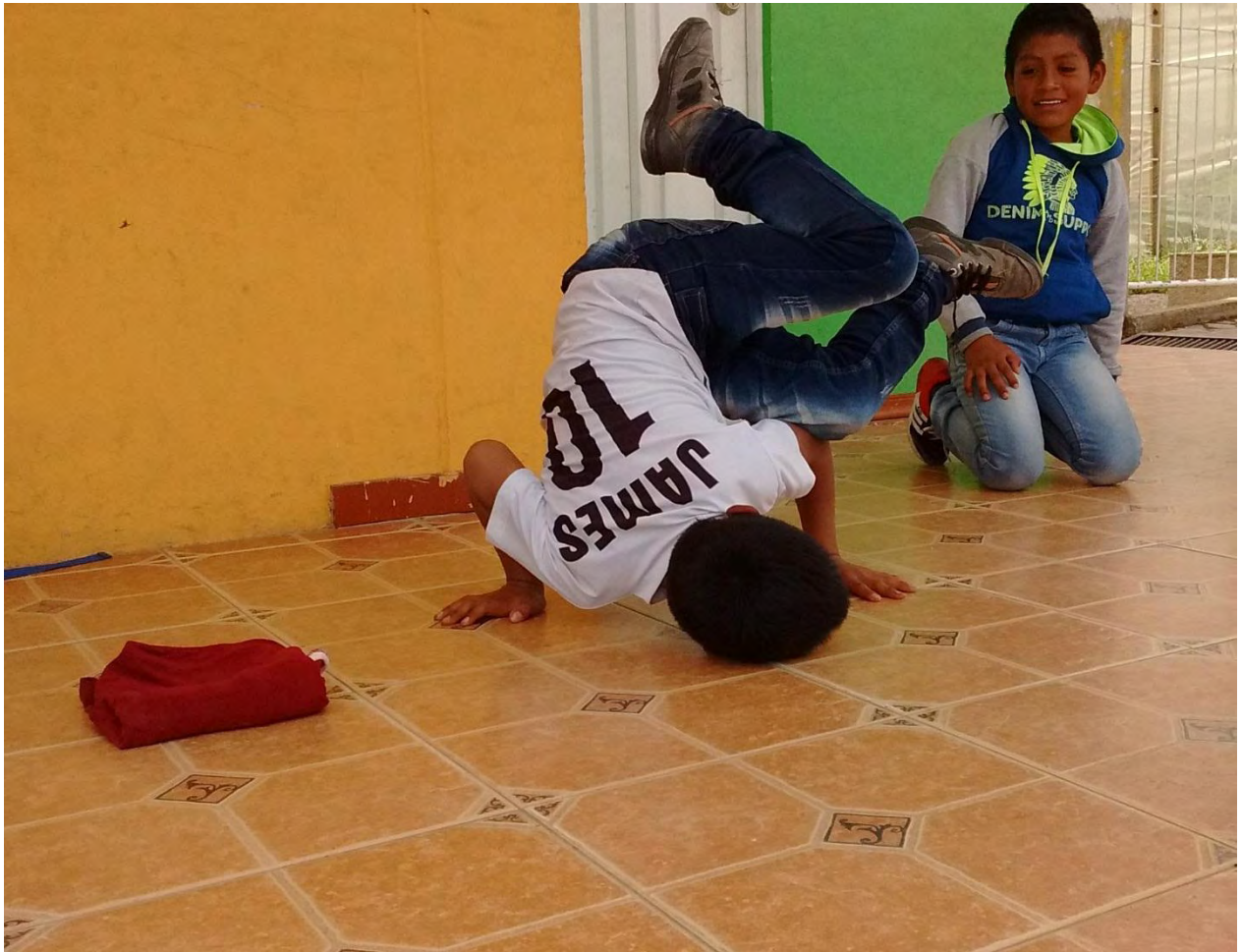
Figura 12. Despertando el interés en niños

Esta interacción a partir del conocimiento se realiza de una manera no formal, con valores que aportan a la formación personal como respeto, amor, paz, unión y la danza como tal, el propósito de crear las escuelas de formación, es brindar espacios que sean apropiados para jóvenes y niños en donde puedan practicar y aprender, compartir un saber específico que en nuestra vida cotidiana potencializa aspectos como, el fortalecimiento físico, la creatividad, habilidades motrices y las relaciones sociales.