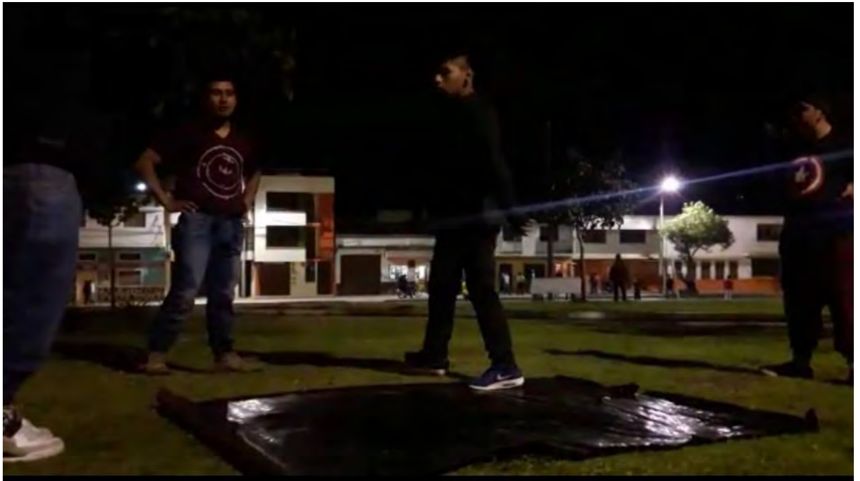
Figura 11. Iniciativa apropiación del baile

hacen parte de estos grupos, además de emerger líderes a través de la apropiación del proceso, aporta a generar más espacios para compartir conocimiento dirigidos por los jóvenes.