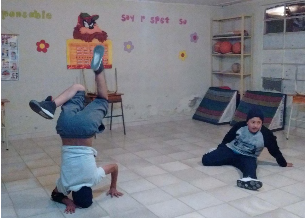
Figura 28. Taller A-B-C-DARIO