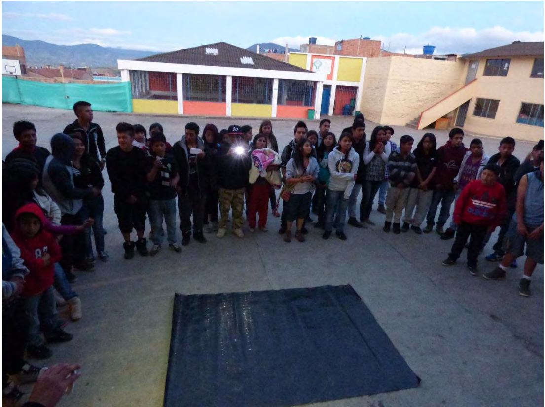
Figura 39. Generando espacios de cultura y formación - Fuente: Archivo Personal.

En las anteriores proposiciones se mencionan cuatro aspectos fundamentales: transformar, crear, desarrollo y educar, los cuales aportan a nuestra sociedad desde la transformación, a través del pensamiento; desde las acciones, generando diferentes espacios donde se incluya a la comunidad en general; creando estos espacios de interacción involucrando jóvenes e inculcando valores, formas de pensamiento diferentes, los cuales también puedan llegar a la personas mayores que poseen un pensar distinto respecto al nuestro en cuanto a las culturas y tendencias actuales, porque el contexto en el cual ellos vivieron era muy diferente, ampliando así las posibilidades de trabajar dentro de la comunidad; entonces interactuar con los demás aporta a que se genere un concepto más amplio sobre las nuevas tendencias juveniles, que aportan en el desarrollo de esta de una forma creativa a través de lenguajes de expresión, brindando propuestas diferentes lideradas por jóvenes a través de la cultura.