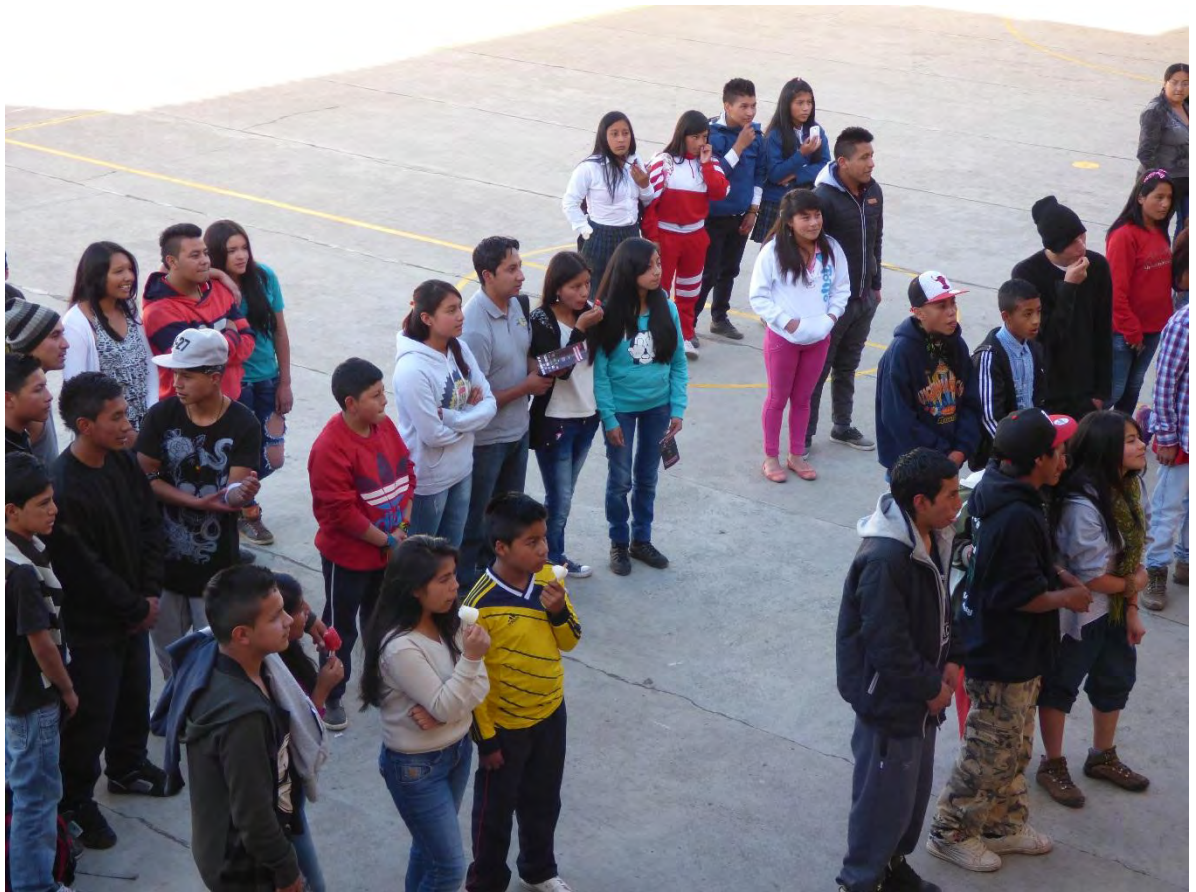
Figura 35. Encuentros Hip Hop por la paz Catambuco 3 – Fuente: Archivo Personal.

Uno de los elementos más característicos de las culturas juveniles es el que puede englobarse bajo la denominación "socio estética", que busca nombrar la relación entre los componentes estéticos y el proceso de simbolización de éstos, a partir de la adscripción a los distintos grupos identitarios que los jóvenes conforman. El vestuario, el conjunto de accesorios que se utilizan, los tatuajes y los modos de llevar el pelo, se han convertido en un emblema que opera como identificación entre los iguales y como diferenciación frente a los otros. No se trata solamente de fabricarse un "look", sino de otorgar a cada prenda una significación vinculada al universo simbólico que actúa como soporte para la identidad. ( Reguillo Cruz, 2007, pág. 97)