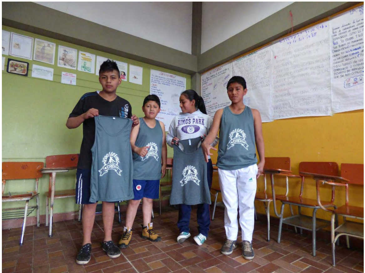
Figura 21. Creando una identidad

Como bailarines, nuestro cuerpo es el elemento que más cuidamos, porque a través de él realizamos todo, dentro y fuera de nuestro espacio de formación, se sensibiliza, se adopta un pensamiento consiente respecto al cuidado, las acciones que realizamos a través de él, ese interactuar la acción de conocernos y visualizar nuestro cuerpo de una manera diferente por medio de la danza.