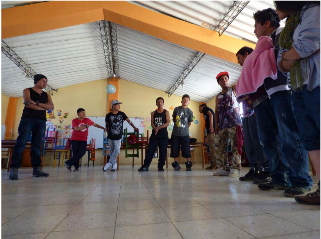
Figura 37. Socialización

Somos el reflejo de cómo nos formamos cuando interactuamos en comunidad, esta nos toma como ejemplo, entonces nuestro actuar dentro de ella además de lo que le transmitimos es muy importante en el momento de generar un concepto dentro de la misma, así nuestras acciones en relación con nuestro pensamiento influyen en cómo la gente nos observa, por ende la importancia de llevar nuestro pensamiento de formación en nuestro diario vivir. “Afirma que es importante la existencia de grupos culturales dentro de la sociedad para que una sociedad tenga una identidad y una cosmovisión propia” E2P7PRS3