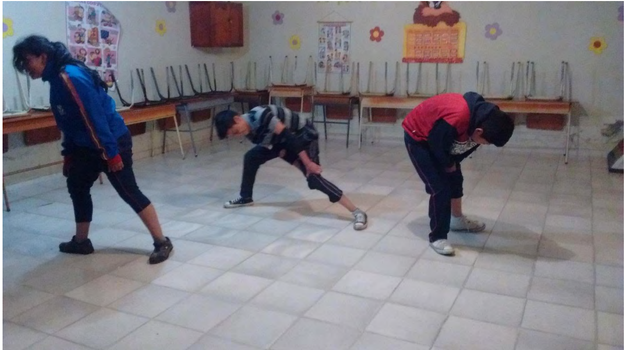
Figura 8. Jugando con el cuerpo

Después de realizados algunos talleres se concibió el concepto de expresión corporal en base a la experiencia vivencial de los estudiantes, quienes asimilaron de manera positiva y relacionaron las acciones echas durante los talleres con la expresión, dando razón a un elemento que se maneja dentro de la danza como lo es la expresión a través del cuerpo.