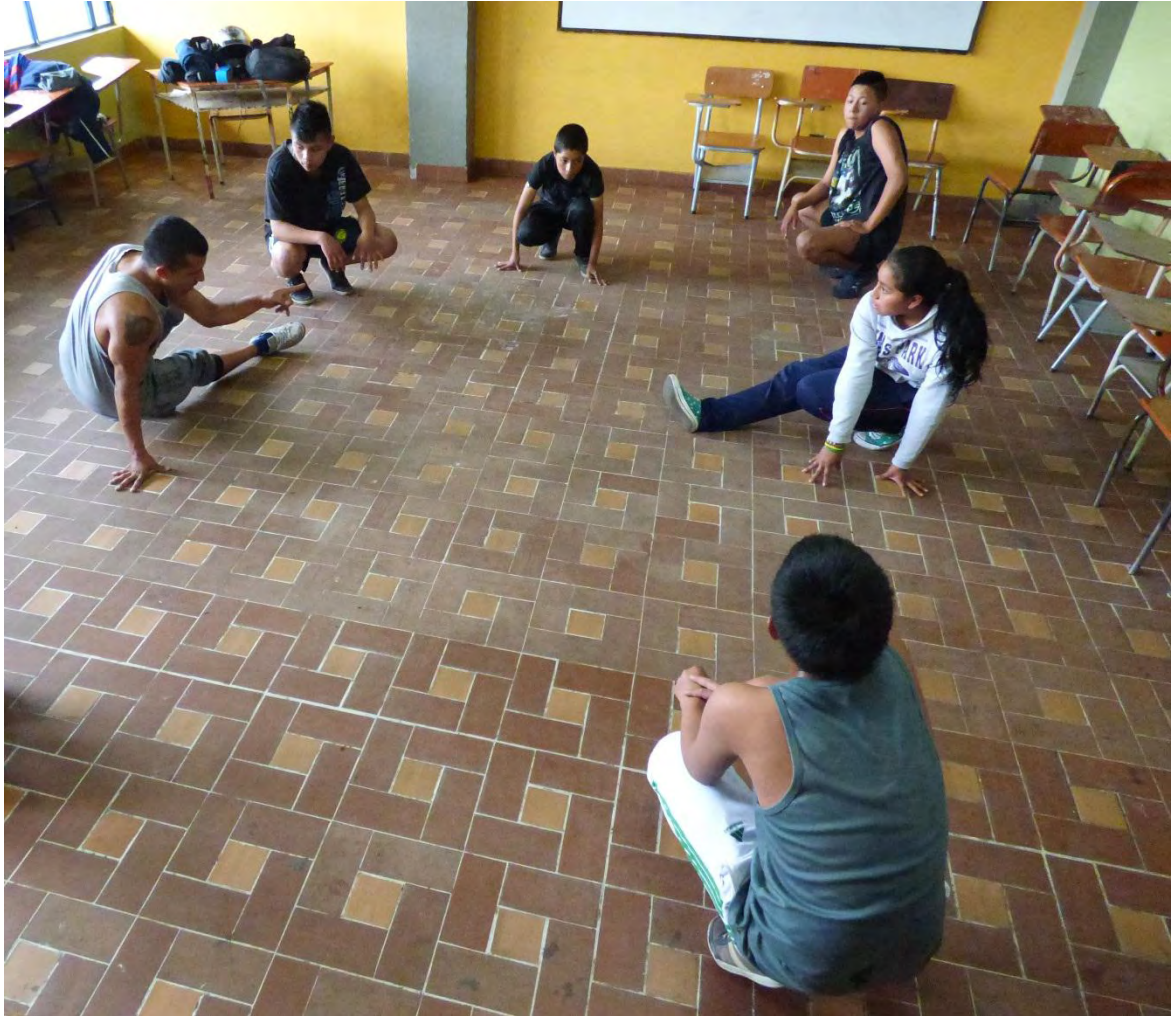
Figura 4. Clase de footwork en el aula – Fuente: David Prado.

Como se observa en la imagen, se brindan las pautas en cuanto a las posturas del foot work, lo primero que se observó durante esta clase fue la dificultad para permanecer un determinado tiempo en esta posición realizando diferentes movimientos, porque no estaban acostumbrados a realizar este tipo de ejercicios, también se observó que a los estudiantes se les facilita aprender con mayor elasticidad los pasos básicos en esta posición, porque al principio no es necesario marcar el ritmo de la música mientras se realiza un movimiento.