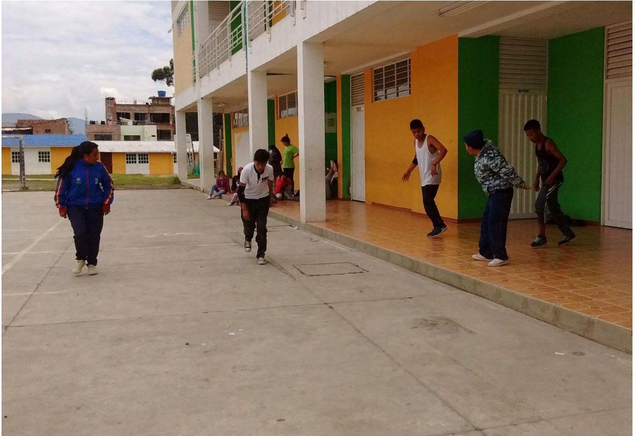
Figura 16. Apropiación de espacios en la institución – Fuente Archivo Personal.

Para Hegel, la formación es la transformación de la esencia humana, previo reconocimiento de que el ser, en términos de lo que debe ser, resulta indefinible en razón de que éste no es, sino que en su devenir va siendo; es una tarea que le resulta interminable. Por ello necesita de la formación para llegar a ser lo que en su devenir logra ser. (Villegas Durán, 2008, pág. 3)