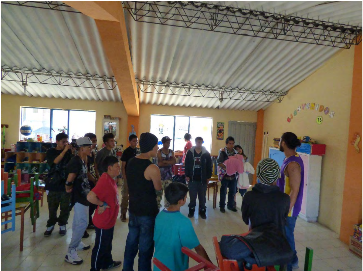
Figura 36. Trasmitiendo la ideología Hip Hop – Fuente: Archivo Personal.

Cada cultura se manifiesta de una manera diferente, en su parte integral se estructura en principios a los cuales adaptamos nuestra manera de pensar, que reflejamos en nuestra sociedad, en base a esto buscamos maneras de expresión formándonos dentro de estos grupos adquiriendo diferentes fortalezas y habilidades que nos aportan en nuestra vida.