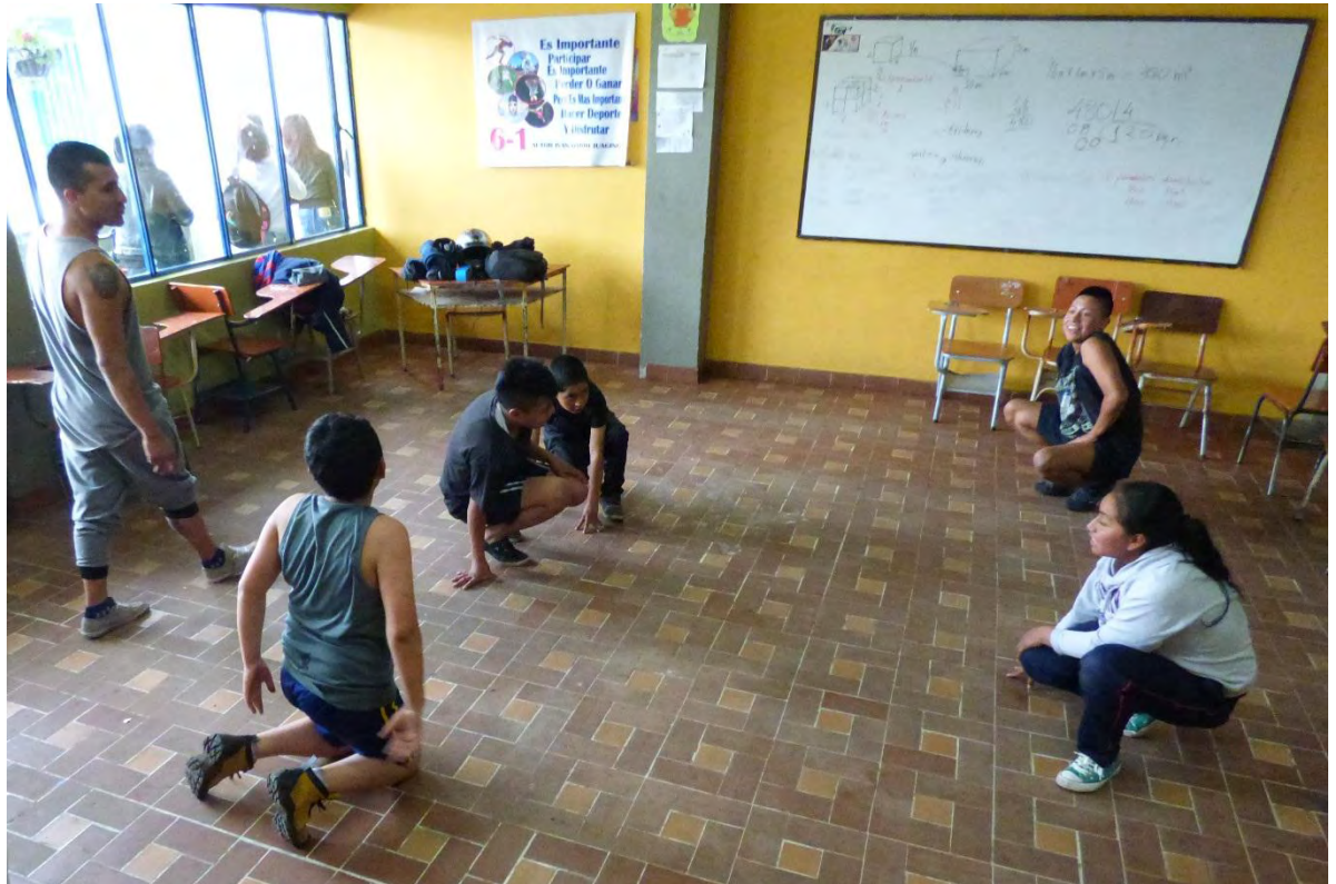
Figura 13. Fortalecimiento físico dentro del aula – Fuente: Archivo Personal.

Las Escuelas de Formación se definen como estructuras pedagógicas que incluyen programas educativos extra escolares implementados como estrategia para la enseñanza del deporte y disciplina en la población inscrita en ellas, principalmente el niño, la niña y el joven, buscando su desarrollo motriz, cognitivo, psicológico y social, mediante procesos metodológicos que les permitan su incorporación a la práctica del deporte de manera progresiva. (Instituto Distrital de Recreación y Deporte - IDRD, 2009, pág. 1)