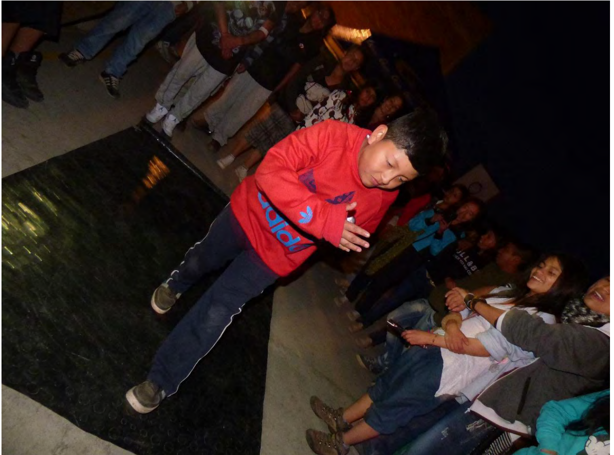
Figura 24. Encuentros Hip Hop por la paz I- Fuente: David Prado.

Por otra parte los estudiantes “afirman que el proceso de trasmisión de conocimiento a través de la danza se genera por la música, los movimientos, como nos tratamos” EC2P3E1