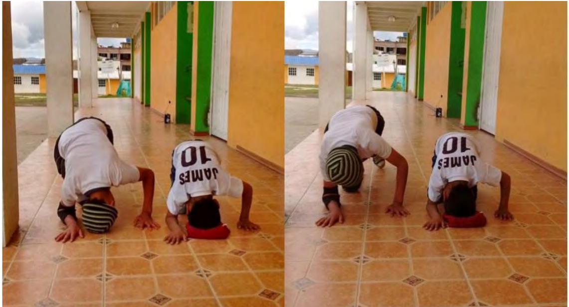
Figura 19. Iniciativa de formación y enseñanza – Fuente: Archivo Personal.

En esta imagen se observa cómo aporta el aprendizaje obtenido con los nuevos integrantes, además de la parte técnica también refleja el compañerismo, liderazgo cualidades generadas durante este proceso las cuales son practicadas y replicadas con las personas que se integran al proceso.