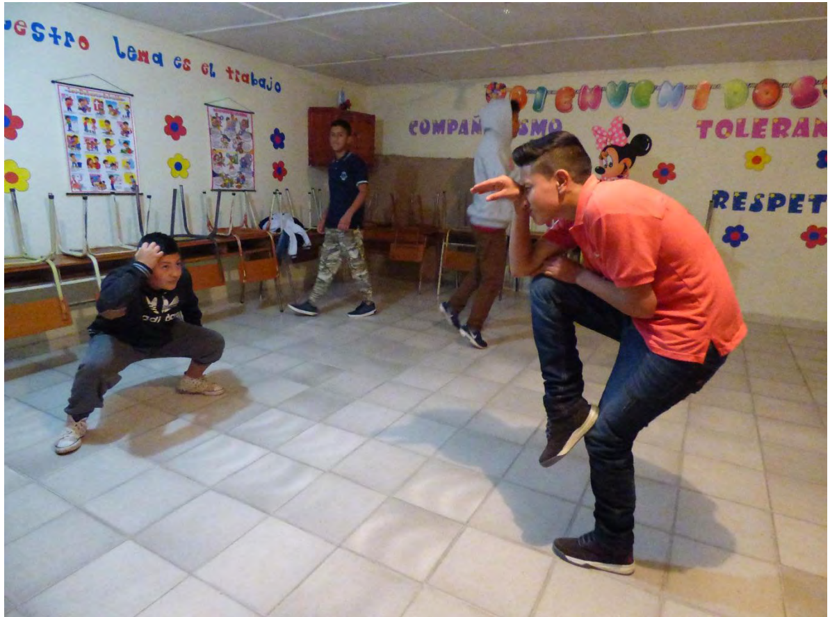
Figura 27. Taller BREAKZOO-MORFING 1 – Fuente: Archivo Personal.

En el taller “Bailando con el A-B-C-DARIO” El objetivo fue aportar a la creatividad bailando break dance mientras se escribe las letras del abecedario en el suelo a través del foot work, aportando a que el estudiante descubra e invente diferentes movimientos, se inició con las letras A-B y C como explicación para el ejercicio ejecutando todos el mismo trabajo, después cada alumno debe hacer el esquema de su nombre, en este momento se exigió y forzó de manera involuntaria al grupo a crear, descubrir y conocer formas alternativas de mover su cuerpo, al finalizar el taller se evidencio cierta impotencia en la realización del esquema de su nombre, porque no encontraron un movimiento fluido para algunas letras, también a través de este taller se logró visualizar las diversas formas de movimientos que se pueden generar desde el cuerpo aplicando la creatividad.