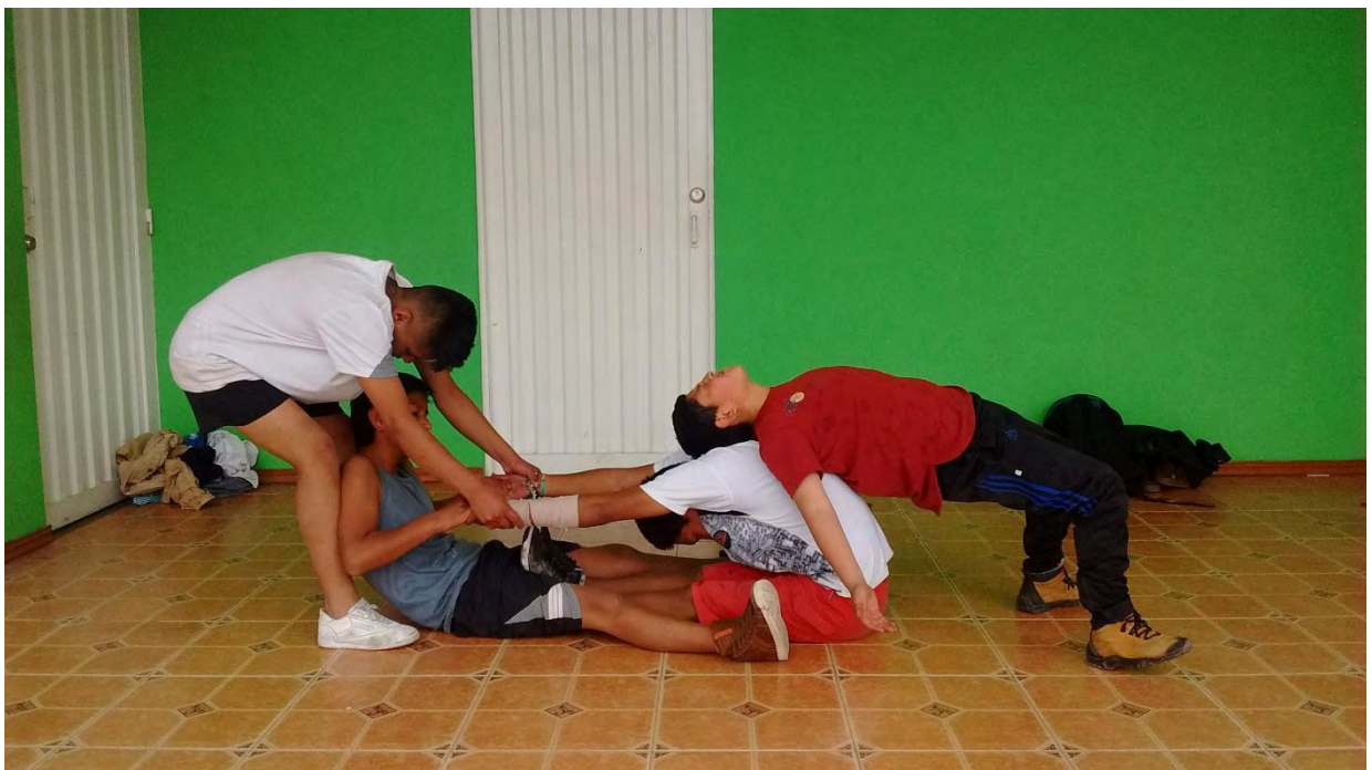
Figura 32. Ejercicios grupales 2

Beneficios físicos, puesto que mejora el estado físico general, como cualquier otra actividad física, aunque con la ventaja de ser más motivante que otros ejercicios físicos, a la hora de realizarla, mantenerla y trabajarla con más intensidad. Estos beneficios son: - Aumento de la fuerza muscular. -Aumento de la flexibilidad. -Incremento de la resistencia física. -Mejora del funcionamiento cardiovascular. Estas consecuencias físicas llevan consigo importantes beneficios psicológicos, como la mejora del auto concepto y de la autoestima, tan importantes en el desarrollo saludable de un sujeto. (MEGÍAS CUENCA, 2009 , pág. 84)