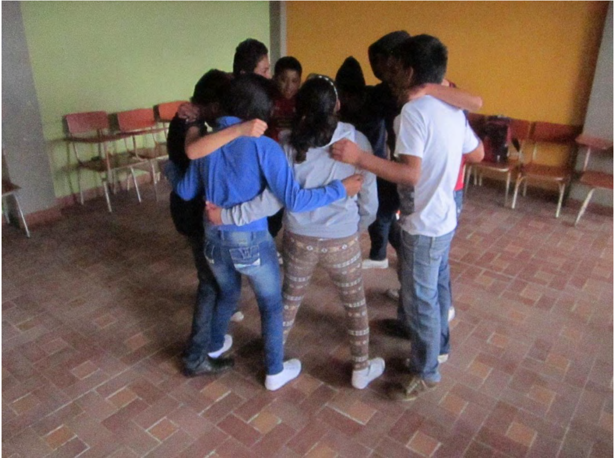
Figura 10. Integración grupal – Fuente Archivo Personal.