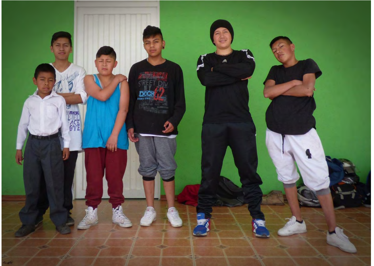
Figura 2. Experiencia con Tallerista

Para este capítulo se define al break dance como una disciplina que exige dedicación, constancia, respeto, para adquirir habilidades, destrezas, hábitos diferentes; además es una forma de aprovechar de una manera más adecuada el tiempo libre, adquiriendo un aprendizaje significativo que posibilita apropiarse la identidad del baile y generar conciencia respecto al manejo y cuidado de nuestro cuerpo; es importante conocer el inicio de esta forma de expresión y la finalidad del baile que tiene diferentes enfoques de formación a parte del fortalecimiento físico y la práctica de los pasos existentes dentro del break dance, también es pertinente resaltar su aporte en el fortalecimiento de las relaciones grupales, sociales e individuales, generando lazos de confianza a nivel personal y grupal.