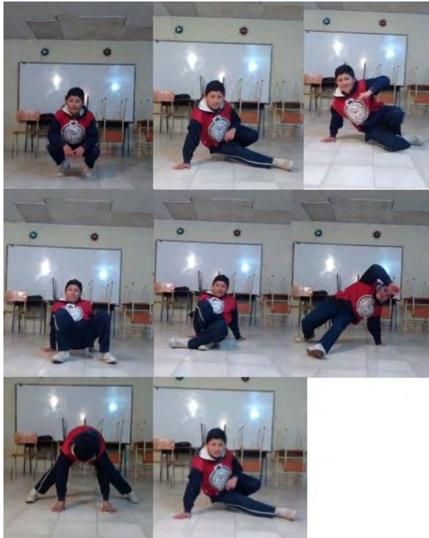
Figura 5. Secuencia pasos six step – Fuente: Archivo Personal.

Los Powermoves son los movimientos que generalmente más impactan al espectador, también son los que mayor dedicación requiere por la dificultad, se realizan movimientos de gimnasia se incluyen fler , air fler , windmill , scrambolls , head spin , 99.