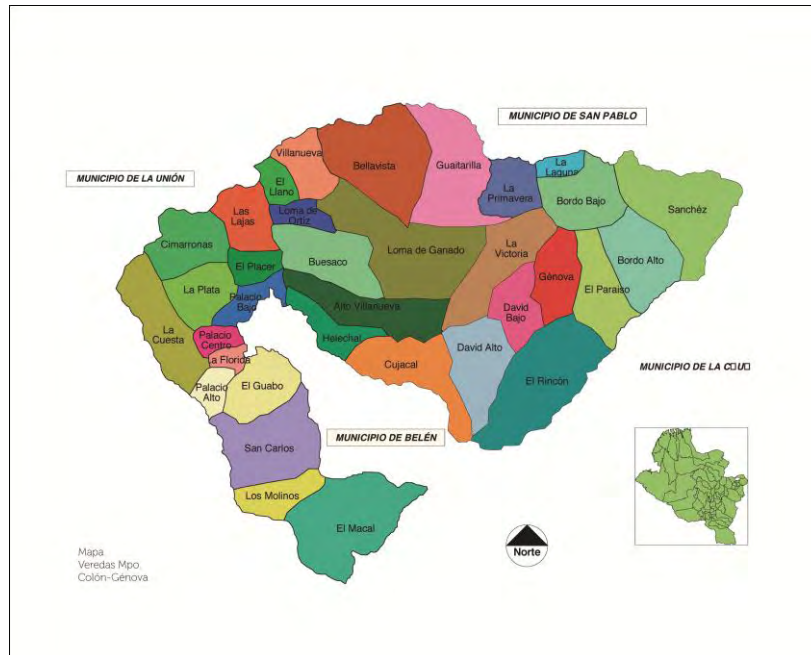
Ilustración 1 Mapa de Colón - Génova con sus corregimientos y veredas

Una vez dentro del casco urbano de Colón – Génova se puede apreciar claramente tres cerros importantes que sobresalen. El pulpito, el veneno, y el cerro San Cristóbal, siendo estos considerados como protectores de la región por sus habitantes, puesto que es allí donde se generan las fuentes de agua que mantienen al municipio. Existe el trabajo agropecuario y agroindustrial. Es una zona rica en flora y fauna donde se puede apreciar claramente su biodiversidad y a un pueblo comprometido con la misma.