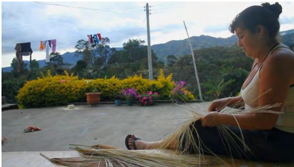
Ilustración 9. Tejedora del sombrero de paja toquilla

Se puede decir que la cultura Colonense es rica en muchos aspectos. La diversidad de ambientes naturales, culturales y sociales que conforman al municipio, se refleja en las múltiples características de cada una de las veredas y corregimientos. La fuerza y riqueza del municipio reside en su diversidad la cual se manifiesta de diferentes maneras como se podrá observar en el documental “Por los rumbos de Colón”.