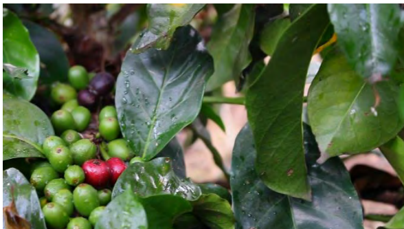
Ilustración 3. Granos de café para su cosecha en finca de Génova

que surten de este producto a gran parte del norte de Nariño y sur del departamento del Cauca y el trabajo maravilloso de la extracción de oro en sus minas artesanales. Sus platos típicos, tales como los envueltos de yuca, los tamales, el sango (Sopa elaborada a base de maíz que puede llevar gran variedad de tubérculos), el manjarillo o dulce negro entre otros, Su fe y creencias religiosas, sus prácticas deportivas más que todo encaminadas a la chaza y sus manifestaciones artísticas como la creación de bellos sombreros con la paja toquilla que son vendidos dentro y fuera del país.