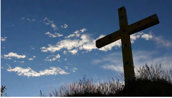
Ilustración 7. Cruz en la cima del cerro San Cristóbal