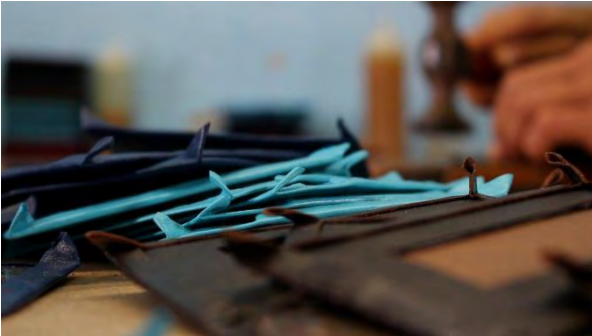
Ilustración 15. Proceso del cuero, composición con plano y texturas

Pero no solo fue la grabación para la captura de historias y personajes; en varios de los planos se logra generar una composición a base de texturas, esto se puede evidenciar en trabajo con el cuero y en la piedra con los petroglifos. La calidad de grabación de los equipos permitía este acercamiento sin deformar la calidad de la imagen. El cambio de foco en grabación parte de ser visualmente varios ejemplos de este tipo dentro del documental.