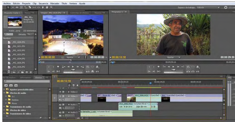
Ilustración 12. Montaje y edición en Adobe premiere CS5

Esta etapa también lleva al mejoramiento del material sonoro, lo que también se conoce como postproducción de audio realizada en el software adobe sountbooth CS5 y adobe audition CS5. Este proceso consistió en reducir los niveles de ruido que poseían las grabaciones y en ajustar los volúmenes necesarios en cada parte del documental. La postproducción incluye procesos como el montaje de imagen y sonido, la elaboración de efectos de imagen y sonido, confección de títulos y elementos de infografía si se hace necesario, grabación de músicas y otra serie de procesos técnicos. Al final en la corrección se puede decir que tenemos un producto final denominado máster el cual es el que se procede a ubicar para que quede la unión de la imagen y el sonido.