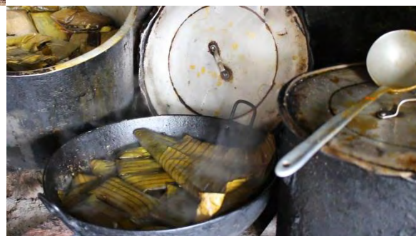
Ilustración 6. Preparación de envueltos - tamales