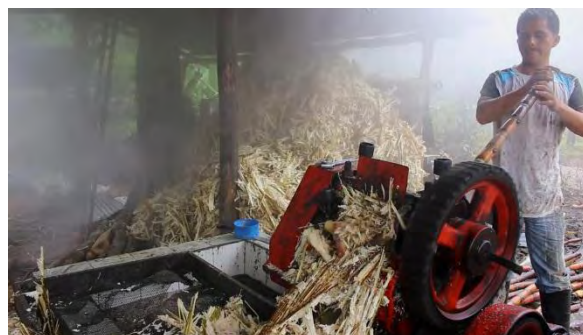
Ilustración 4. Trabajo en el trapiche panelero en corregimiento de San Carlos