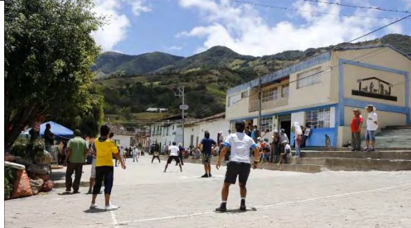
Ilustración 8. Juego de chaza en calle principal de Génova