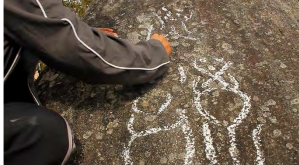
Ilustración 16. Piedra con petroglifo, composición con plano y textura

Como resultado del proyecto “Por los rumbos de Colón” se puede concluir que amplió el conocimiento frente a la realización documental y como el artista visual tiene la capacidad de decodificar la información de una investigación en un proceso creativo y audiovisual que pueda significar para una comunidad un reconocimiento de sí mismo y de su entorno. Por otro lado al comparar la información del libro con la documental se nota un leve realce en algunas historias contadas puesto que el colorido y la composición obtenidas en los planos grabados hace que el espectador tenga mayor capacidad de concentración frente a la narración de historias identitarias y culturales