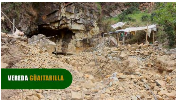
Ilustración 5. Mina de oro artesanal vereda Guaitarilla, fundación agro minera Santa Isabel