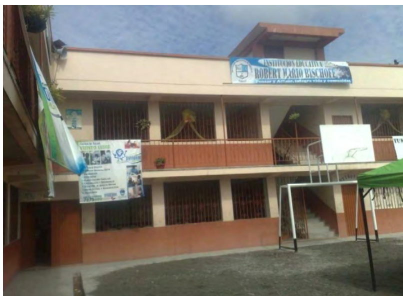
Figura No. 1 I.E. Robert Mario Bischoff Sede Principal