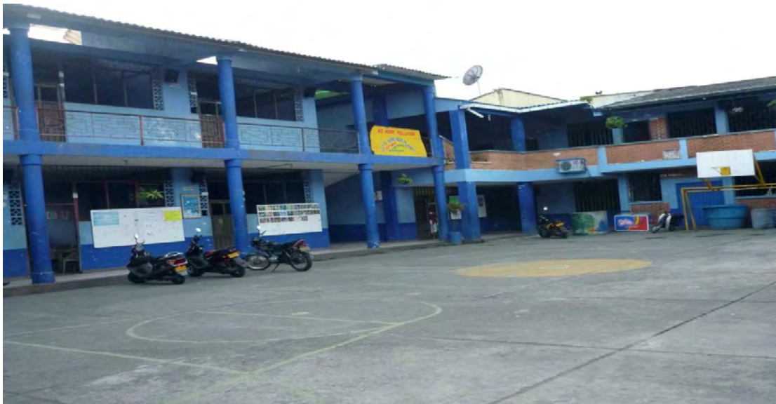
Figura No. 2 I.E. Nuestra Señora De Fátima Sede Principal

valores sólidos fomentando la identidad en que interactúen que conlleve al cambio de actitud frente a la problemática social, política y cultural a nivel local, regional haciendo presencia, garantizando mayor participación en su comunidad